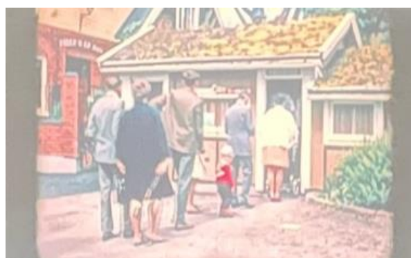
Entre till Blomstergården

Mats bjöd bland annat på världens första film av och med filmskaparna bröderna Lumière. Vi fick även titta på Charlie Chaplin, Helan o Halvan och en mycket trevlig och lite nostalgisk film ifrån vårt kära "Blomstergården", någon gång på 60-talet. Då en riktig turistpärla i vårt kära Blekinge.