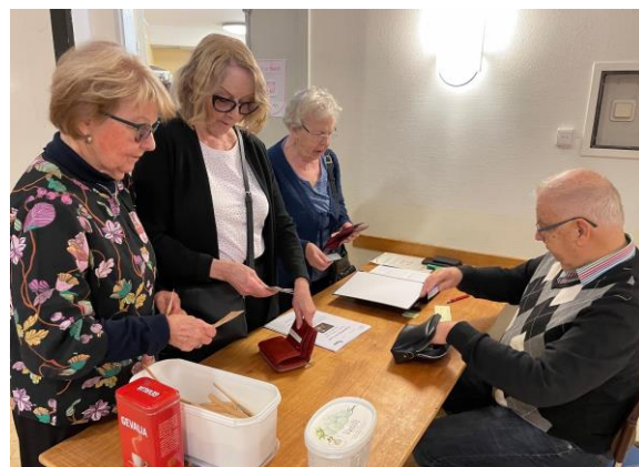
Entré till månadsmötet