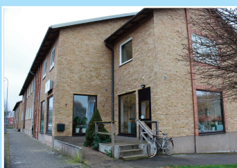
Distriktskansliet i Höör.

Som medlem i SPF Seniorerna är du alltid välkommen att kontakta distriktskansliet om du behöver hjälp med medlemsärenden eller har andra frågor. Kansliet har telefontid måndag–torsdag kl 9–12, telefon 0413-291 14.