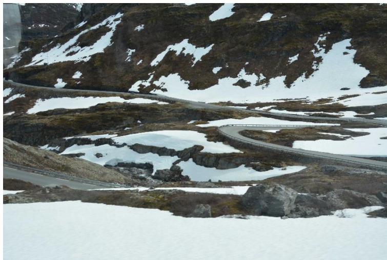
Figur 3 Geirangervej

beskrivning av Einar hade man bara för någon dag sedan plogat. Vissa år går det inte alls att köra den sträckan så tidigt på sommaren, eftersom det fortfarande ligger för mycket snö kvar