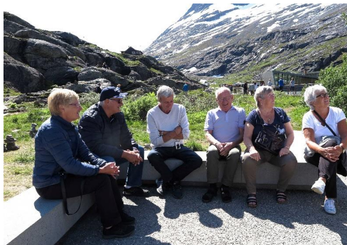
Figur 10 Rast vid Trollstigens café

Lördag är det avfärd mot Röros via Trollstigen. Vi börjar med att besöka utsiktsplatsen i Ålesund med en fantastisk utsikt över staden och fjorden. Vi passerar ett stort antal vägtunnlar på vår väg upp i fjällvärlden utmed Storfjordens strand mot Valldal med den slutliga stigningen upp mot Trollstigens övre del,