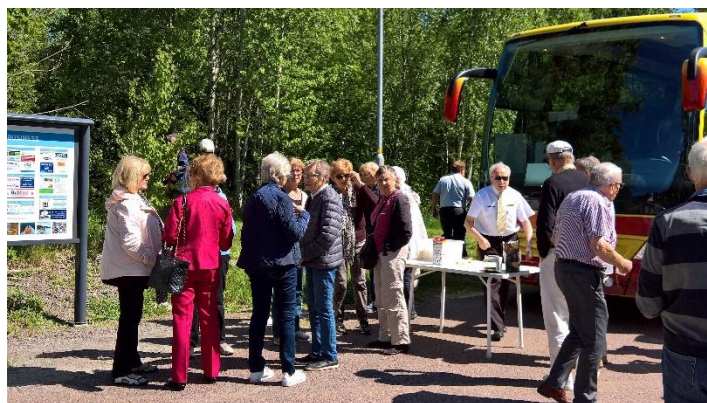
Figur 1 Bussfika vid Norsälven

En liten miss vad gällde placeringarna i bussen, ordnades upp. Tack vare de inblandades STORA FÖRSTÅELSE. Låten "vi här bak i bussen" hördes då och då. Vi hade en fin gemenskap på hela resan. Buss-kaffet med tillbehör förhöjde stämningen ytterligare, inte minst på den norska sidan.