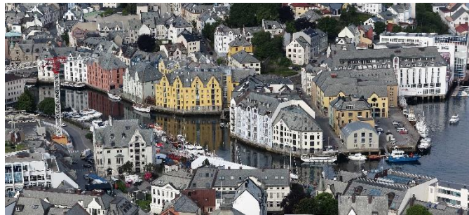
Figur 9 Ålesund

Under ca fem timmar färdas vi i Geirangerfjorden mot Ålesund. Vi passerar vattenfallen "De sju Systrarna" med "Friaren" mitt emot samt "Brudslöjan", en storslagen natur med vackra vyer, höga fjäll och den djupa fjorden som på sitt djupaste ställe mäter nästan 800 m, vilket kan jämföras med Östersjöns största djup (Landsortsdjupet 456 m). Mot kvällen anländer vi till Ålesund som är dagens slutmål, incheckning på Scandic Hotell och middag. Flera tar en sen kvällspromenad i de centrala delarna av staden inklusive hamnområdet.