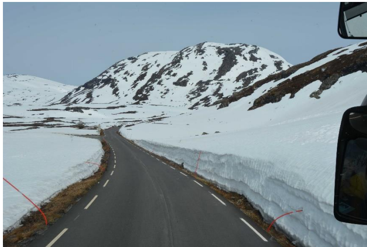
Figur 2 Geirangervej

beskrivning av Einar hade man bara för någon dag sedan plogat. Vissa år går det inte alls att köra den sträckan så tidigt på sommaren, eftersom det fortfarande ligger för mycket snö kvar