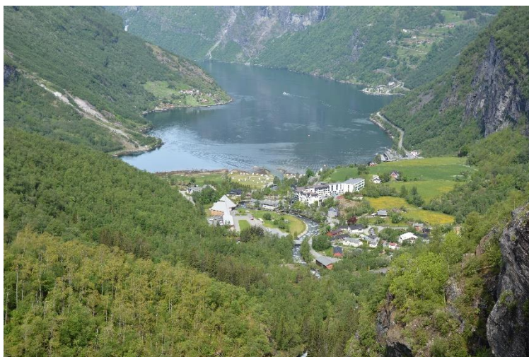
Figur 4 Flidalsjuret Geiranger

Efter denna spännande och branta färd, går vi ombord på ett av Hurtigrutens fartyg, på väg mot Ålesund. Vi passerar naturligtvis alla de sevärdheter, som finns längs denna fantastiskt vackra sträcka. Utsikterna varierade, beroende på, på vilken sida av båten man befann sig.