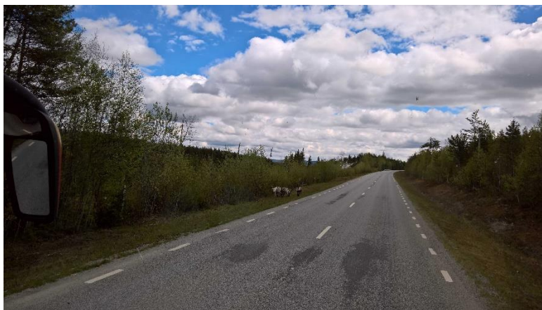
Figur 5 Funäsdalen

Så småningom lämnar vi Norge via Funäsdalen, Sveg och Mora.