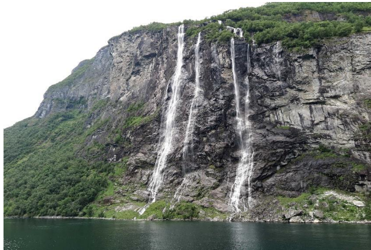
Figur 8 Sju systrar i Geirangerfjorden

Under ca fem timmar färdas vi i Geirangerfjorden mot Ålesund. Vi passerar vattenfallen "De sju Systrarna" med "Friaren" mitt emot samt "Brudslöjan", en storslagen natur med vackra vyer, höga fjäll och den djupa fjorden som på sitt djupaste ställe mäter nästan 800 m, vilket kan jämföras med Östersjöns största djup (Landsortsdjupet 456 m). Mot kvällen anländer vi till Ålesund som är dagens slutmål, incheckning på Scandic Hotell och middag. Flera tar en sen kvällspromenad i de centrala delarna av staden inklusive hamnområdet.