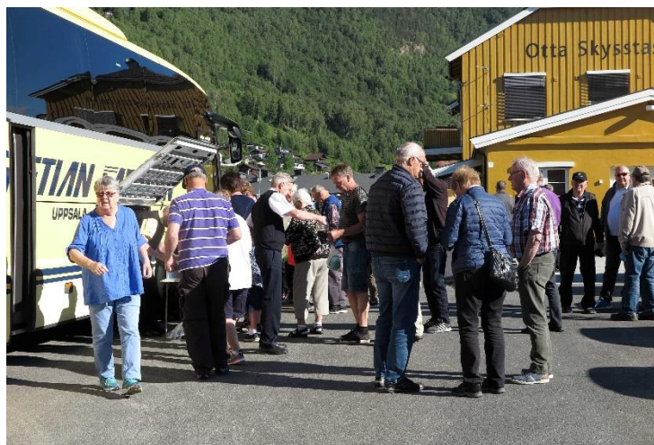
Figur 6 Busskaffe i Otta

Fredag, dag två var det tidig avfärd ca 0715, solig dag men endast 7 grader. Färden gick i huvudsak på nordvästlig kurs mot första delmålet Geiranger. Nu börjar vi komma in i den norska fjällvärlden med höga berg och djupa dalar och efter en stund ser vi den första snön på de högsta topparna.