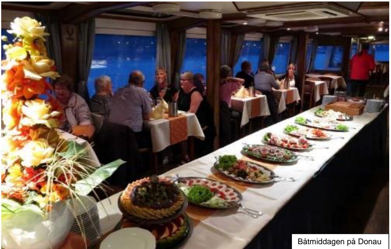
Båtmiddagen på Donau