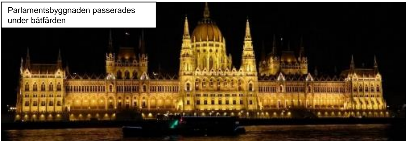
Parlamentsbyggnaden passerades under båtfärden

Broarna över Donau är nio till antalet och varje bro har sin historia, Kjedjebron är kanske den mest kända för sin speciella byggkonstruktion och utseende. Vi checkade in på vårt hotell Radison Blue i de centrala delarna av Pest. Middagen avnjöts på ett restaurangfartyg på Donau där vi serverades en buffé under en drygt två timmars båtfärd på Donau, fantastisk upplevelse att färdas och se alla stadens ljus från floden.