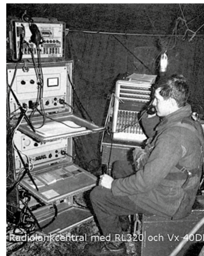
Radiorätkentral med RL320 och Vx-40DL

Kulturarrangemang i samarbete med Studieförbundet Vuxenskolan