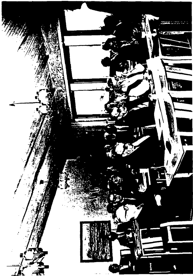
Tölö 27 sept. 1984