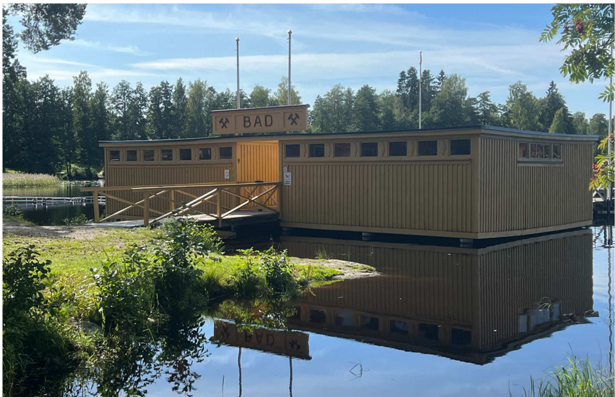
Ett gammalt kallbadhus från ursprungligen 1938.

Denna anläggning revs 1985, och ersattes av byggnader på land, (till skillnad från föregångarna som alla anlagts på pålar ute i vattnet) samt en ny simstadion.