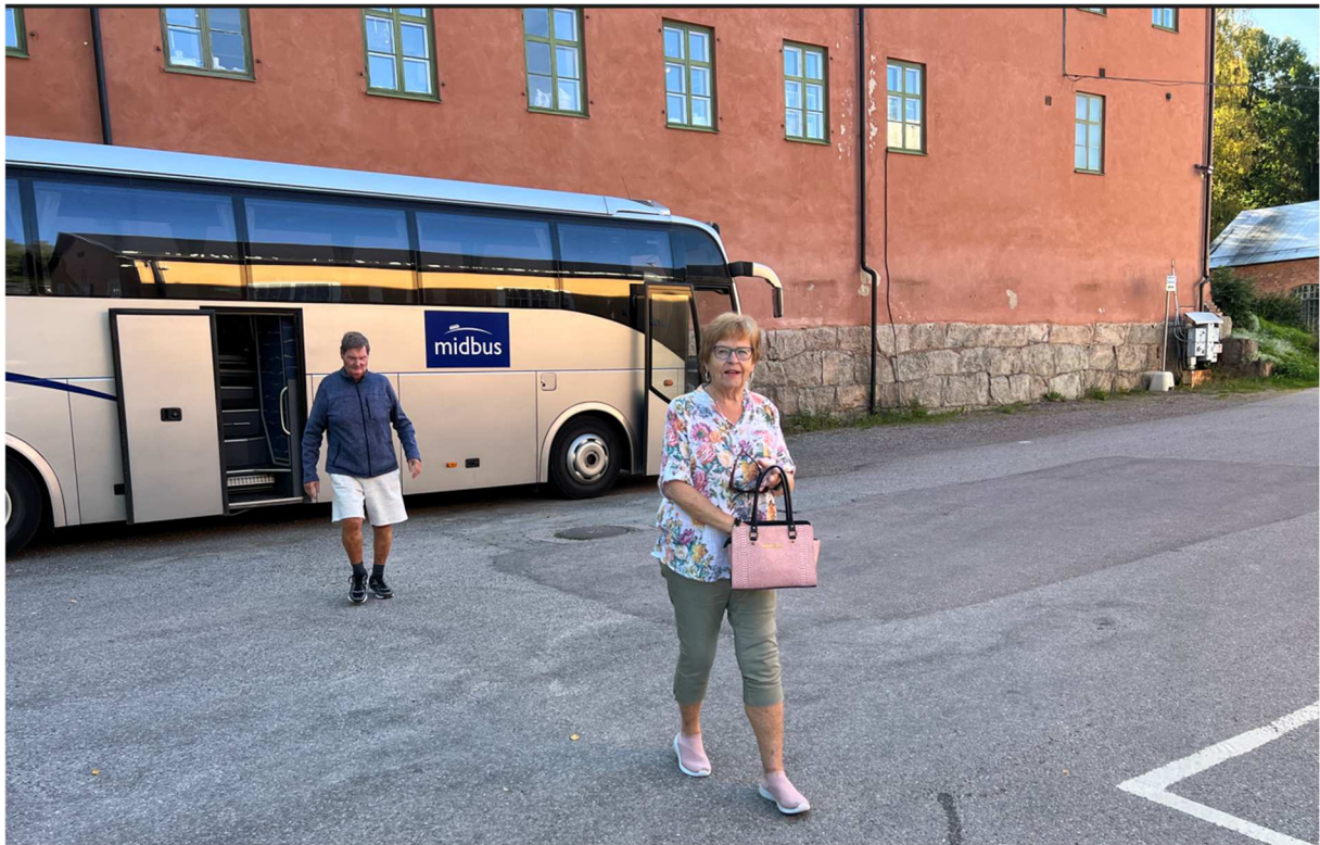
Det vankades kaffe och fralla så gäller att hänga med