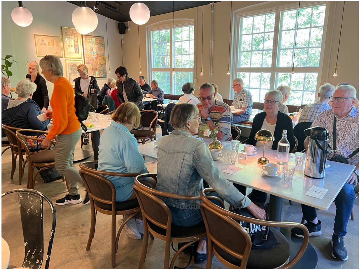
Inte fel med kaffe