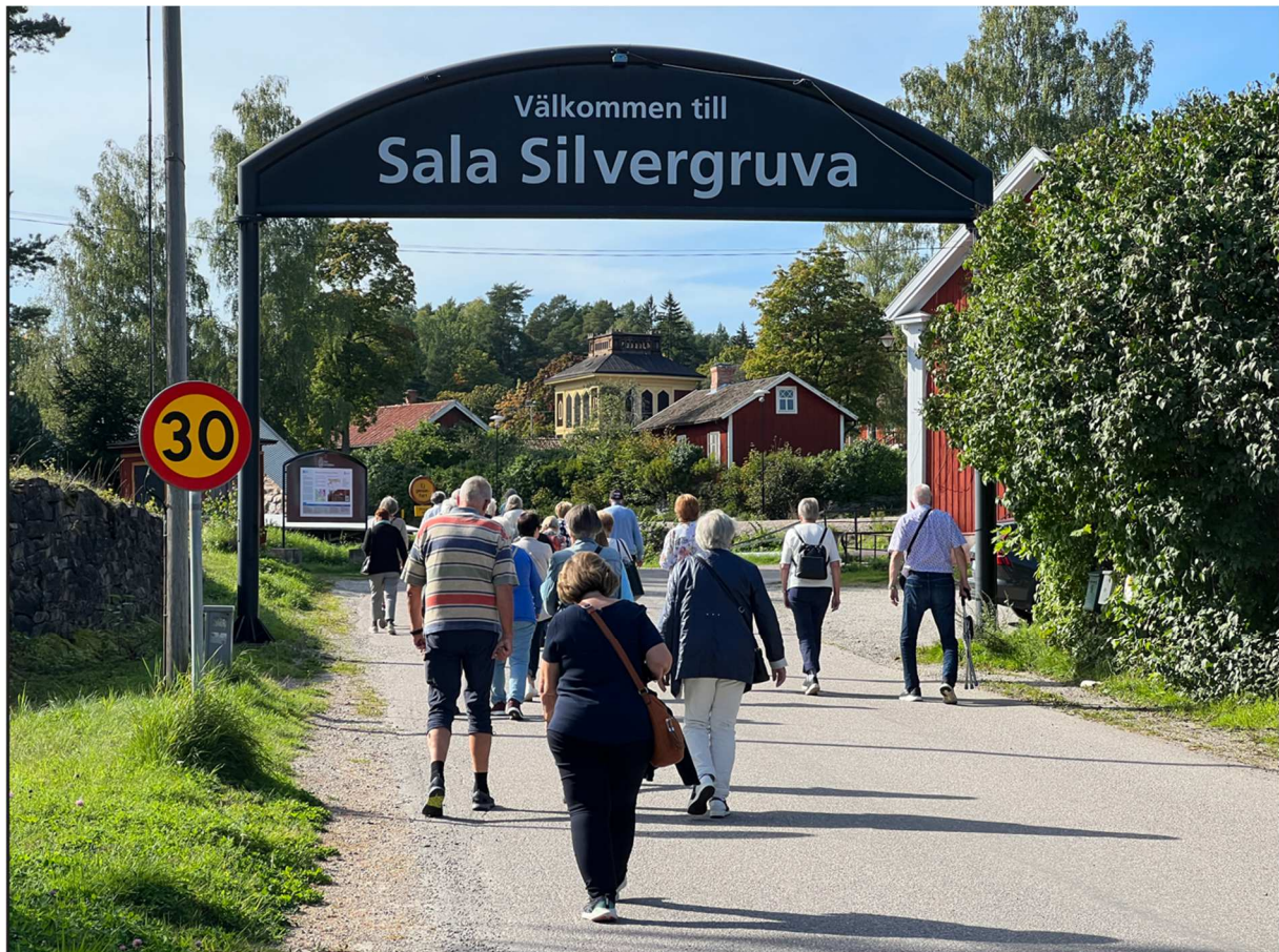
Ankomst till Sala Silvergruva