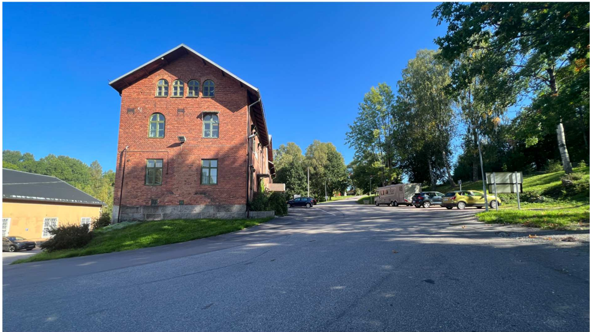
Outletförsäljning fanns i denna byggnad