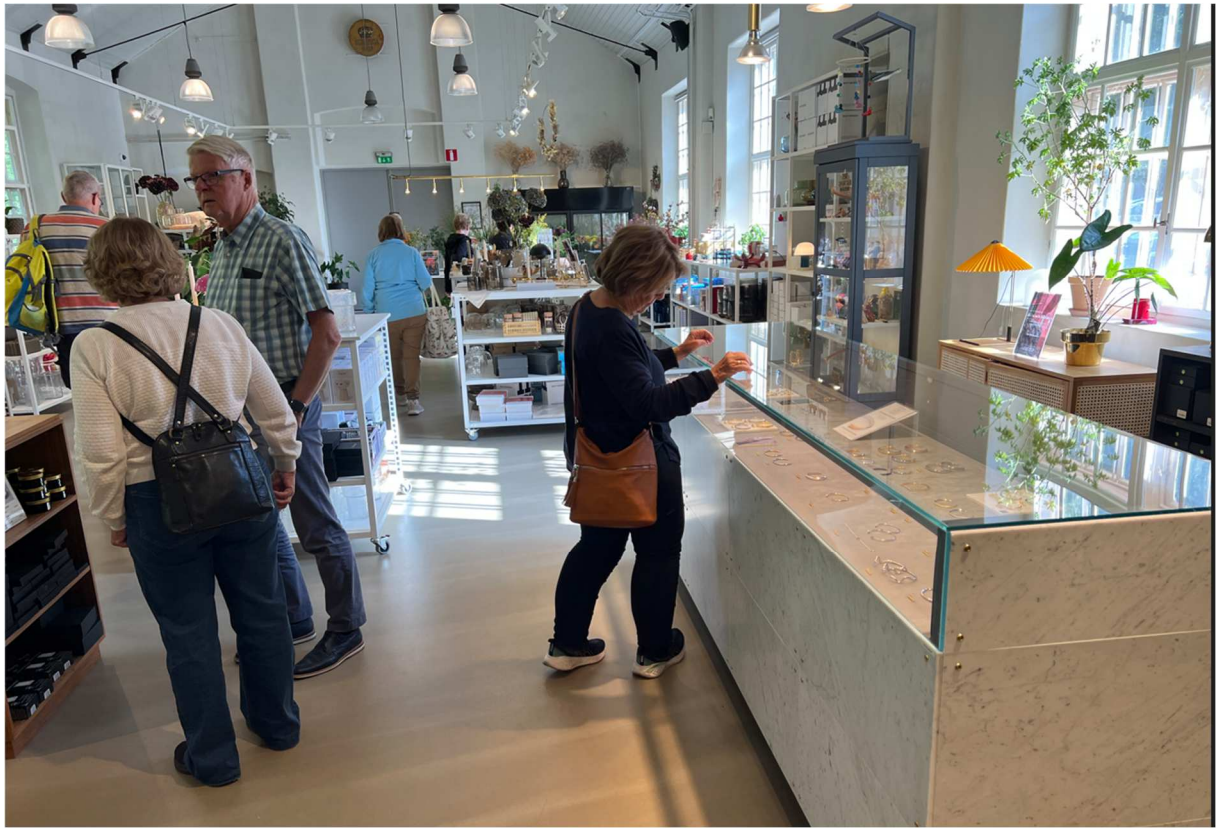
Här har vi en som fastnat bland smycken och annat