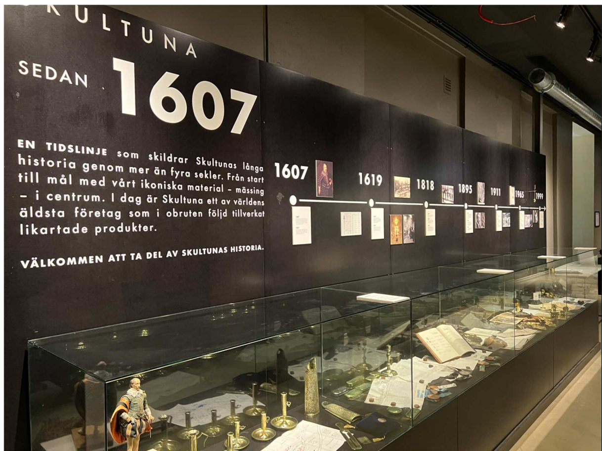
Det fanns ett litet museum där man kunde läsa lite om bruket historia genom åren