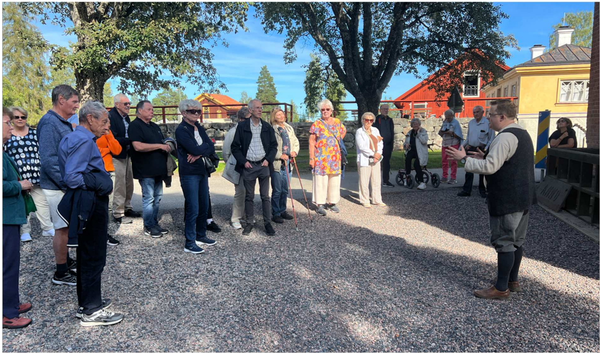
En annan guide som förevisade området för den grupp som undertecknad gick med.