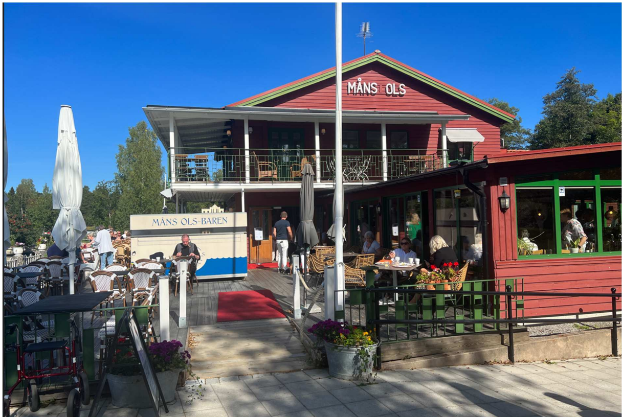
Färden gick vidare mot Sala där lunch skulle intagas på Måns Ols Restaurang. Mycket god lunch som bestod av kycklingfiléer och potatis.