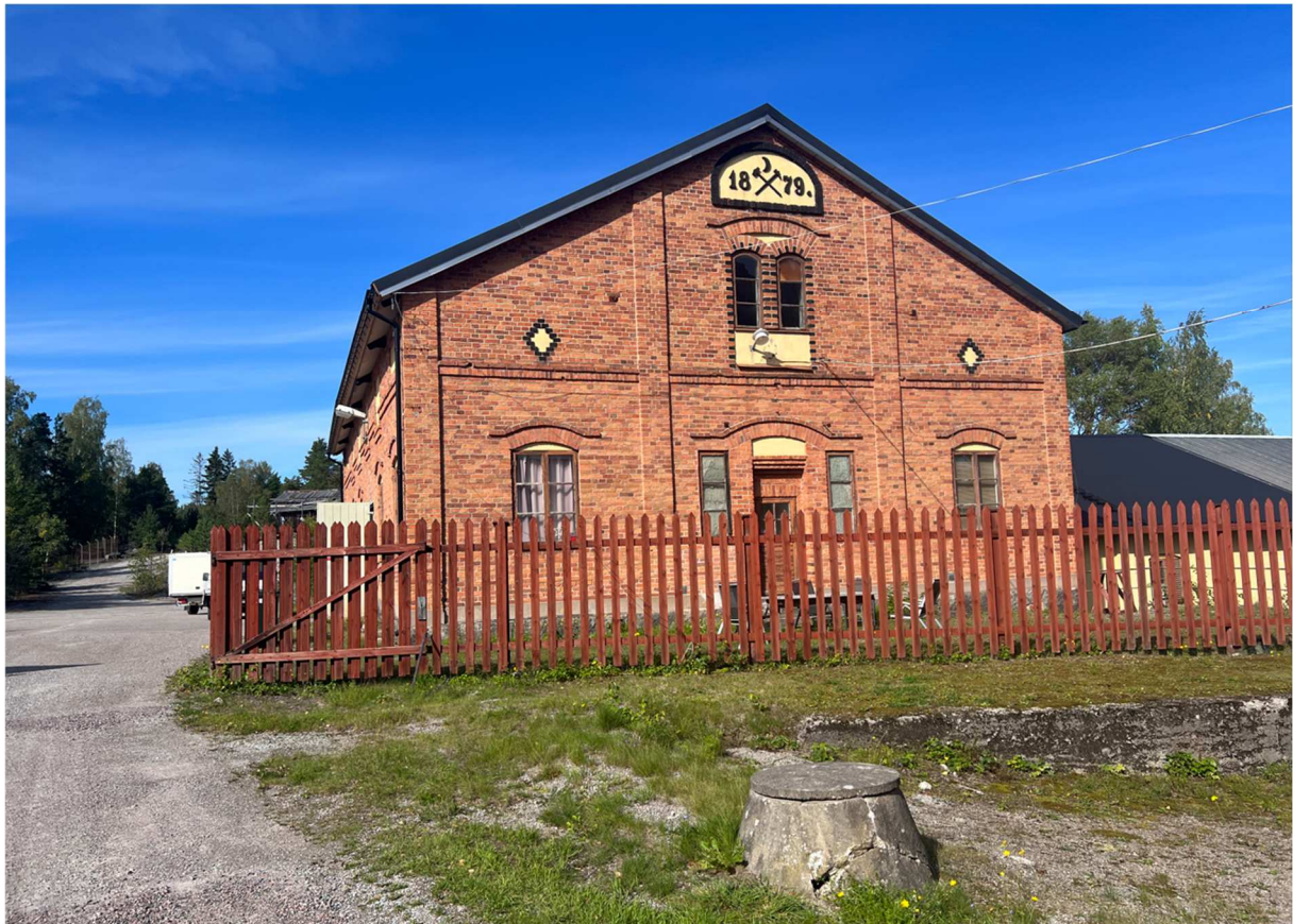
En byggnad från 1879