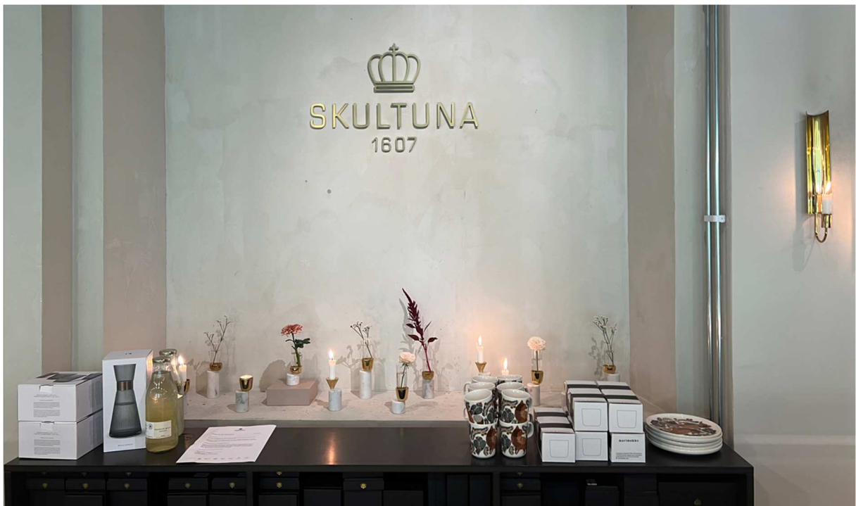
Ett gammalt bruk som startade redan år 1607