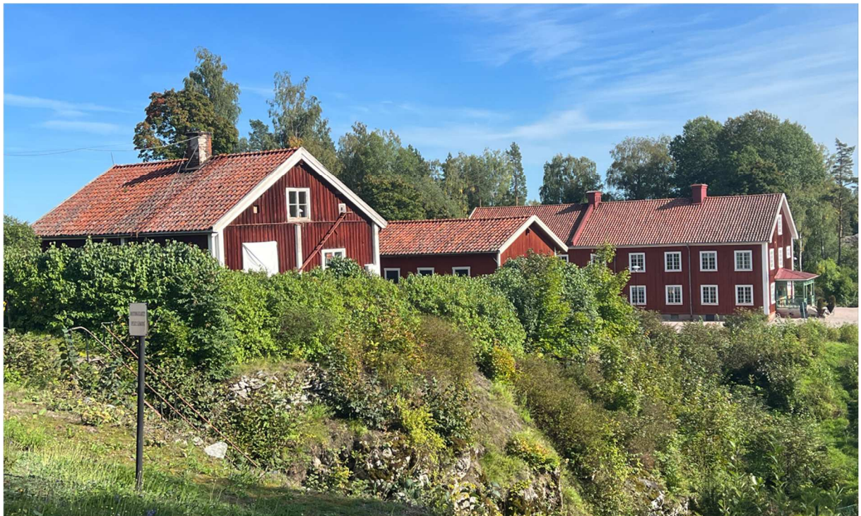
Byggnader där vissa tjänstemän bodde en gång i tiden. Husen har renoverats.