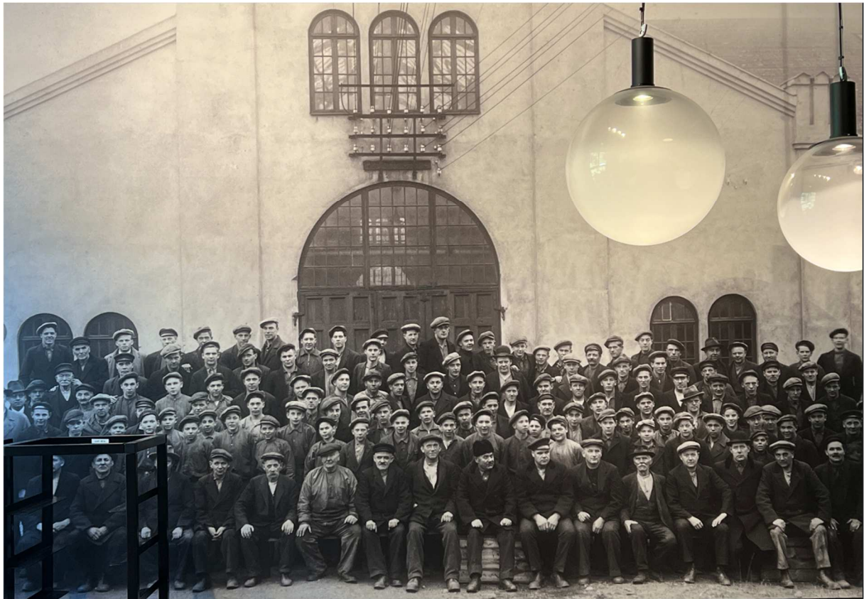
Arbetare på bruket från svunna dagar.