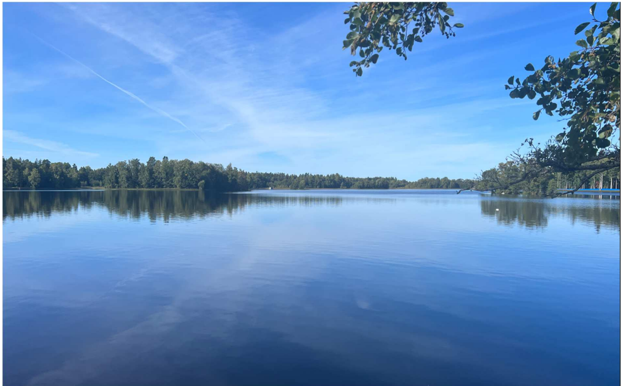
Utanför restaurangen fanns en sjö som låg alldeles spegelblank.