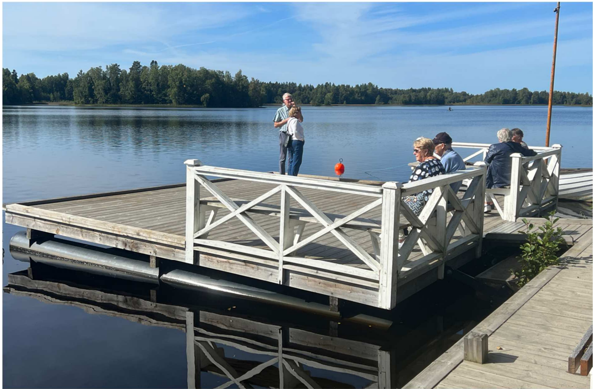
Vissa som sitter och njuter i det vackra vädret