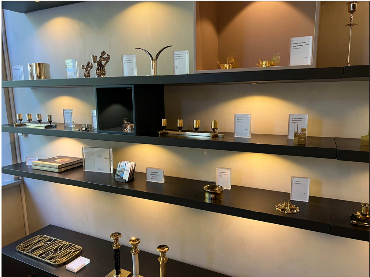
Fler fina saker i utställningslokalen