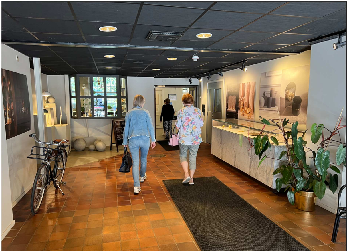
På väg in till caféet