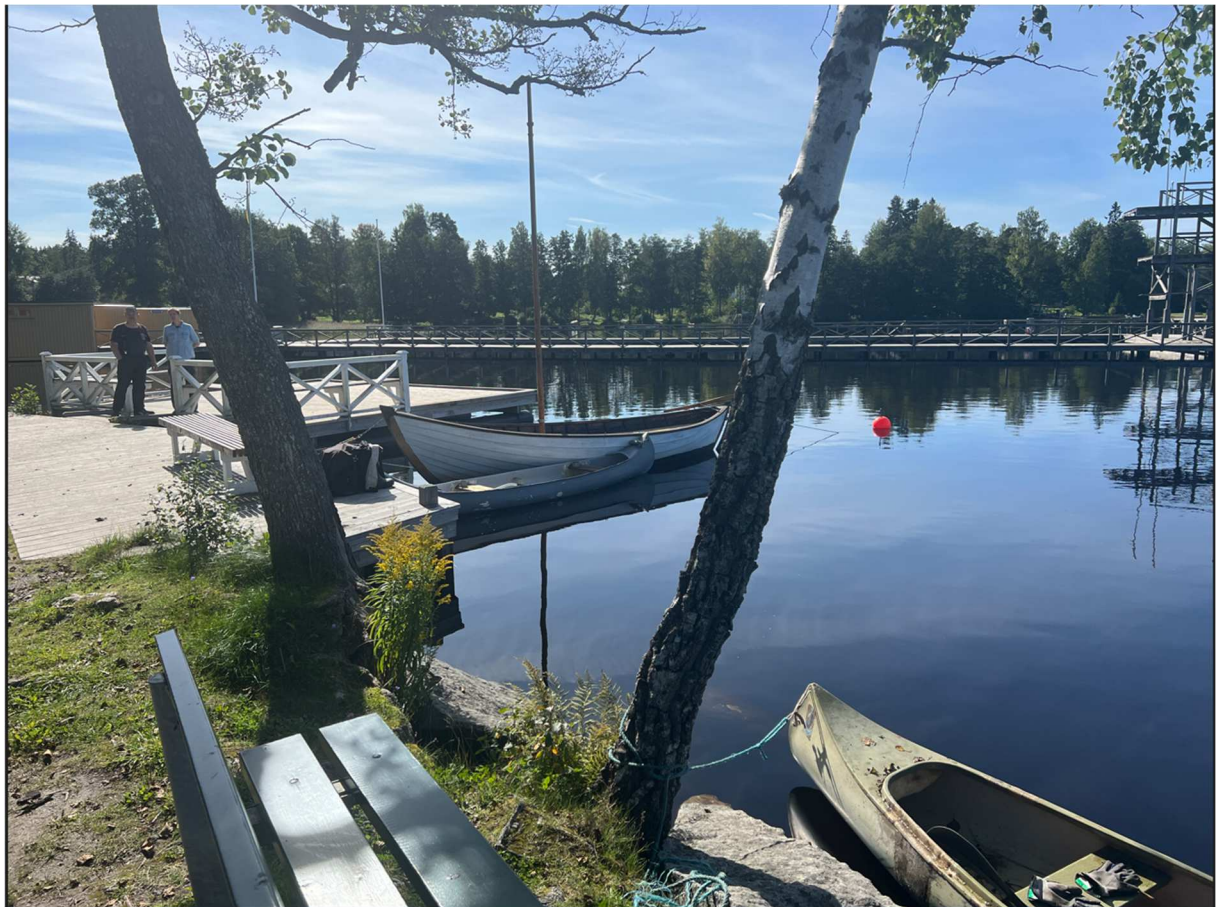
Gamla träbåtar låg förtöjda vid brygga, Det fanns även ett hopptorn för de som kände för att bada vilket ingen i vår grupp kände för.