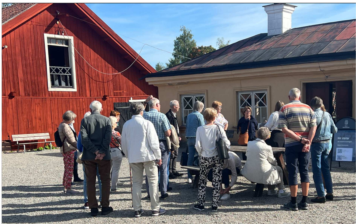
Gruppen samlad i väntan på den guideade turen runt gruvområdet.