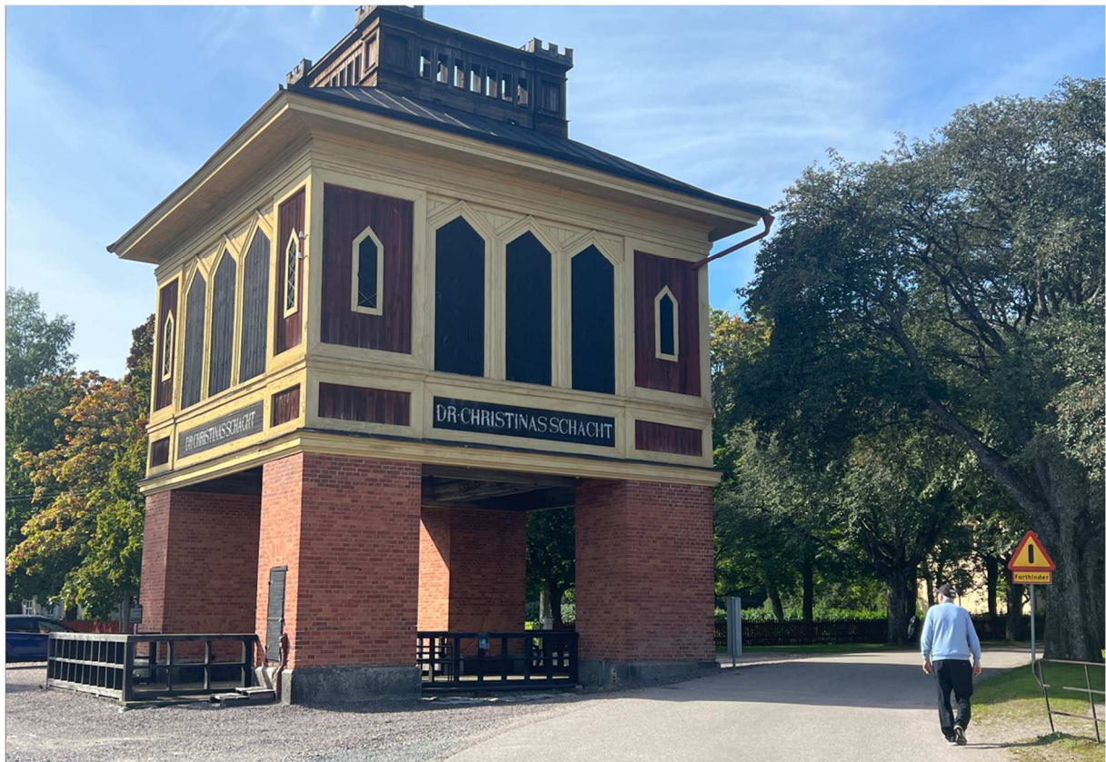
Drottning Kristinas schacht. Under denna byggnad fanns ett gruvhål som var över 250 meter djupt.