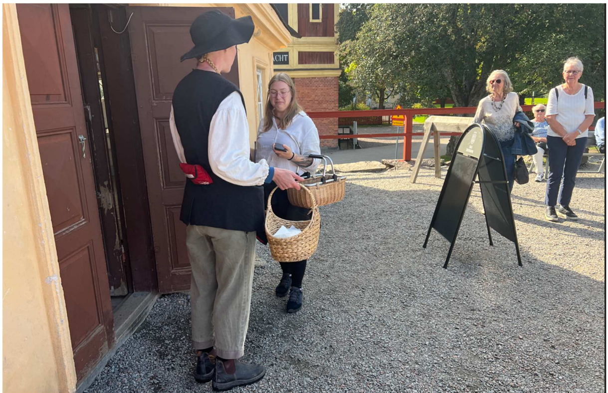
En av guiderna som skulle ta en grupp runt.