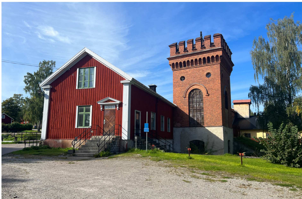
Gamla byggnader fanns det gott om. Gruvan har funnits sedan Gustav Vasas tid d.v.s. 1500-talet.