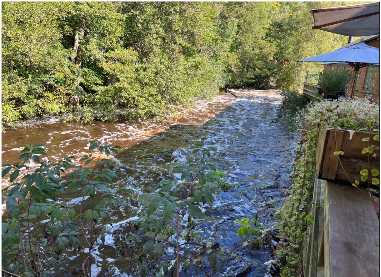
Utanför rinner Svartån med full kraft.