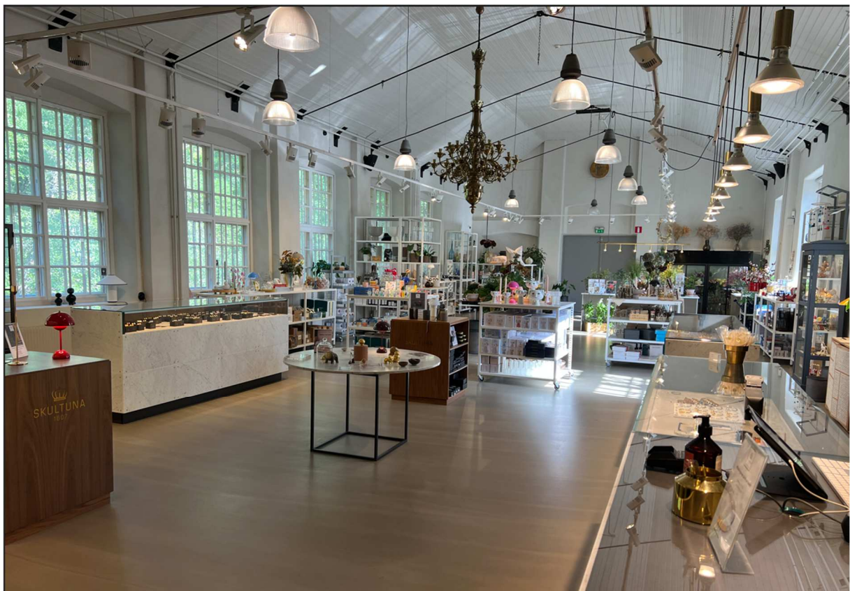
Interiörbild från Skultunas utställningslokal där man även kunde göra inköp för hugade spekulanter.