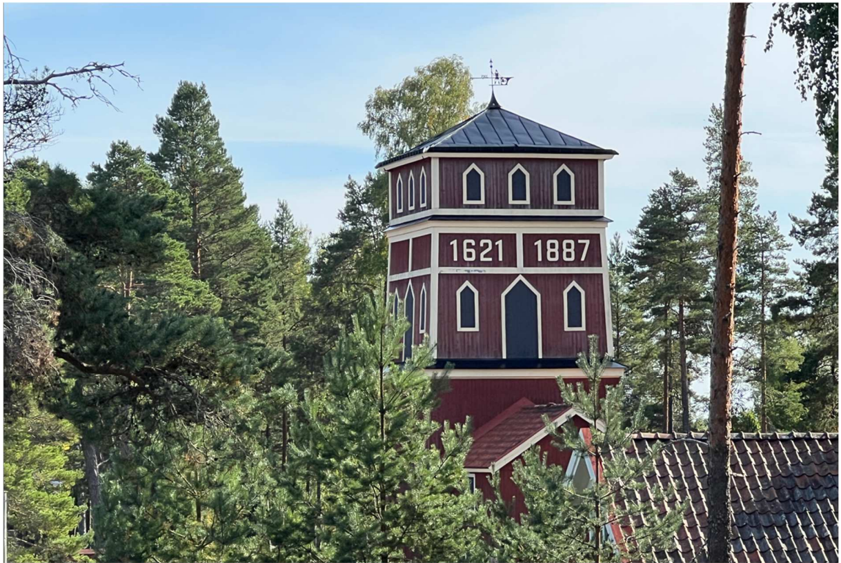
En byggnad som ligger på området där den ursprungliga brytningen startade.