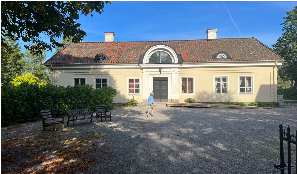
Här bodde direktören för bruket.