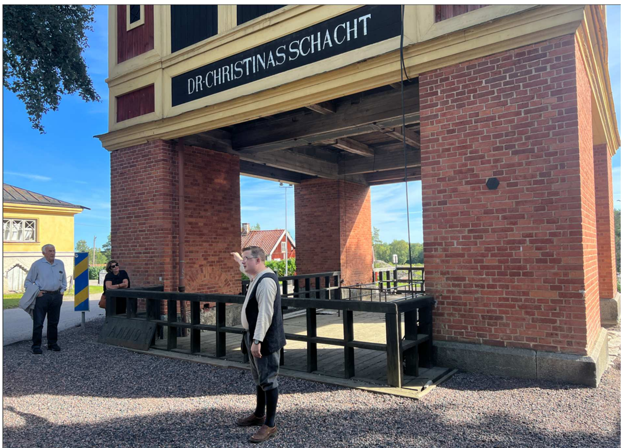
Här får vi veta mer i detalj om Drottning Kristinas schakt