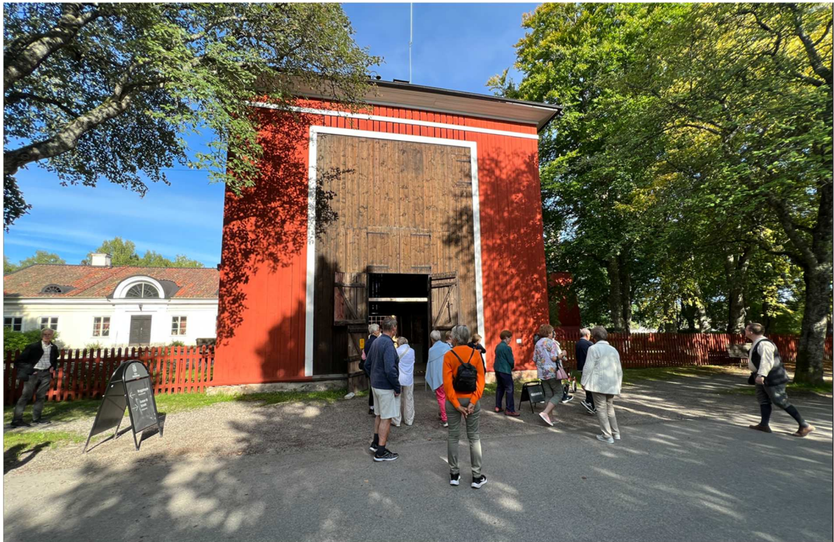
Gustav III:s gruvschakt