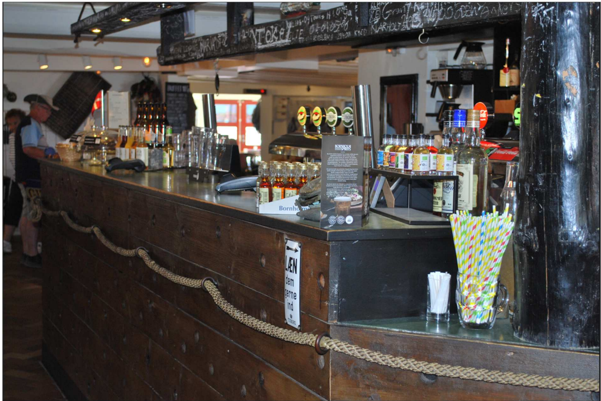
Här beställde man alla de goda flytande varorna