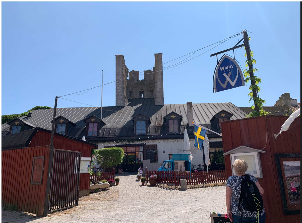
En av många krogar i Visby