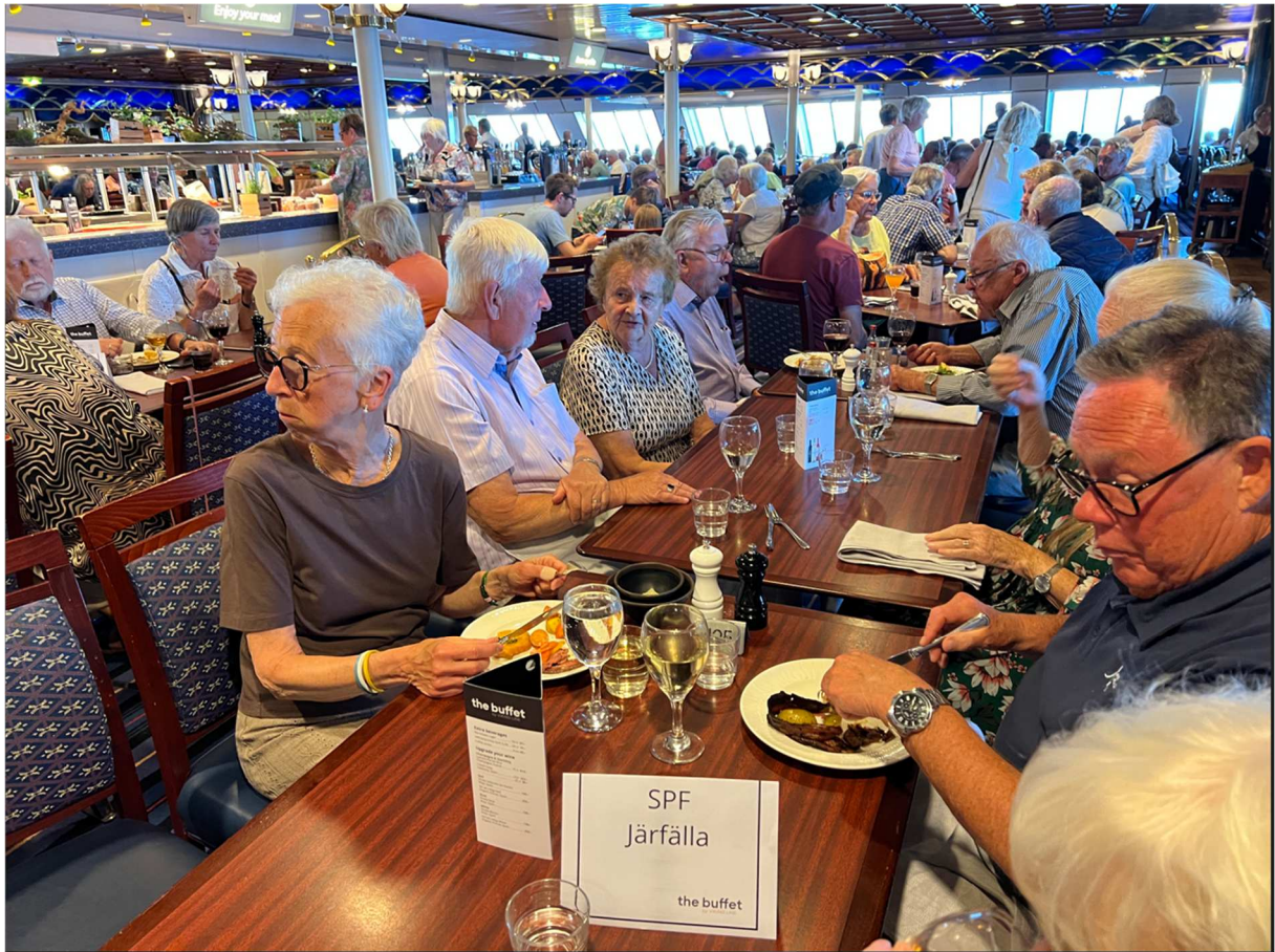
Ytterligare några från gruppen