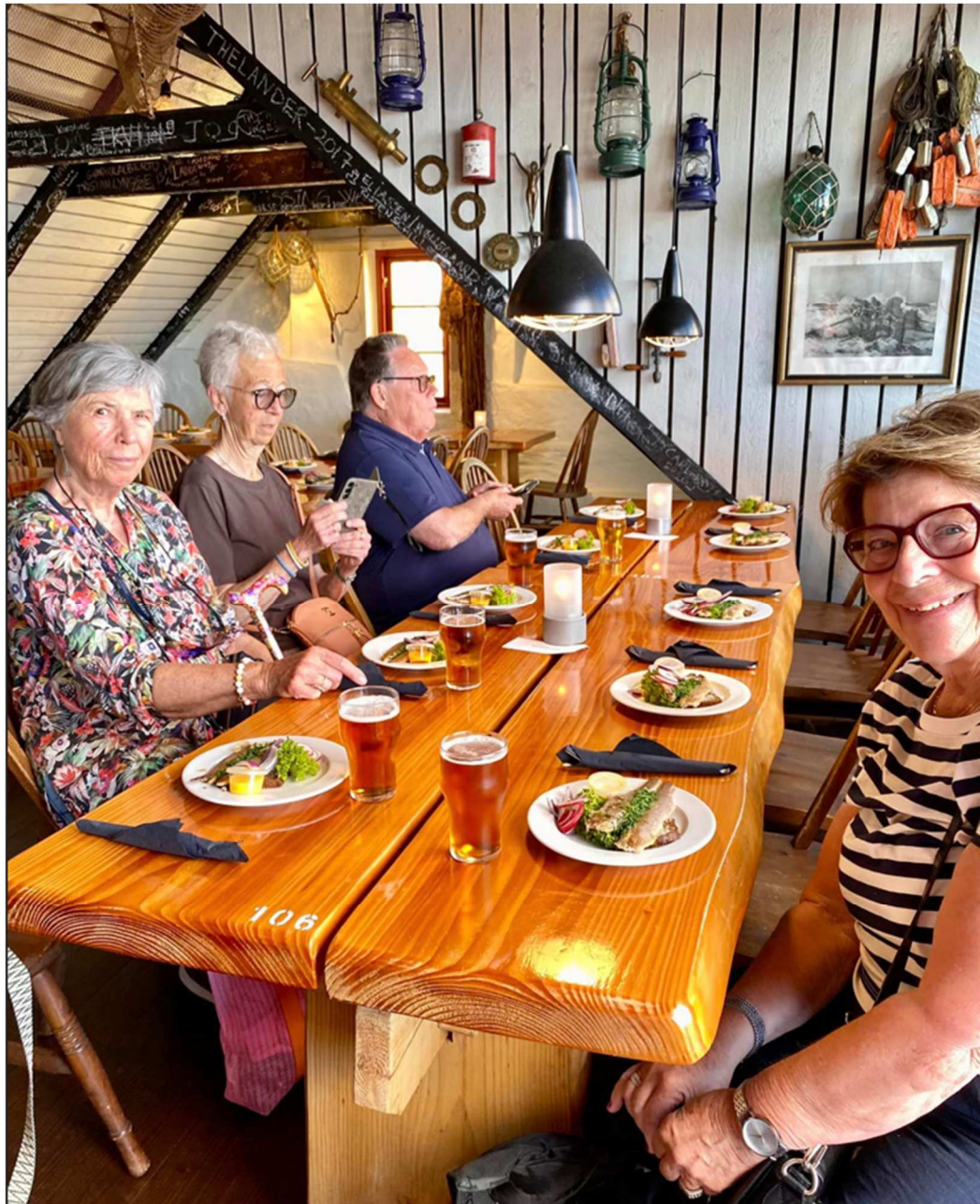
Fler som ser nöjda ut efter lunchen.