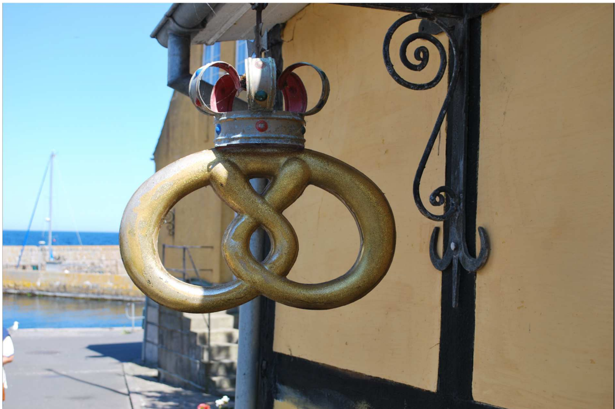
En typisk dansk skylt som visar att här finns ett bageri.