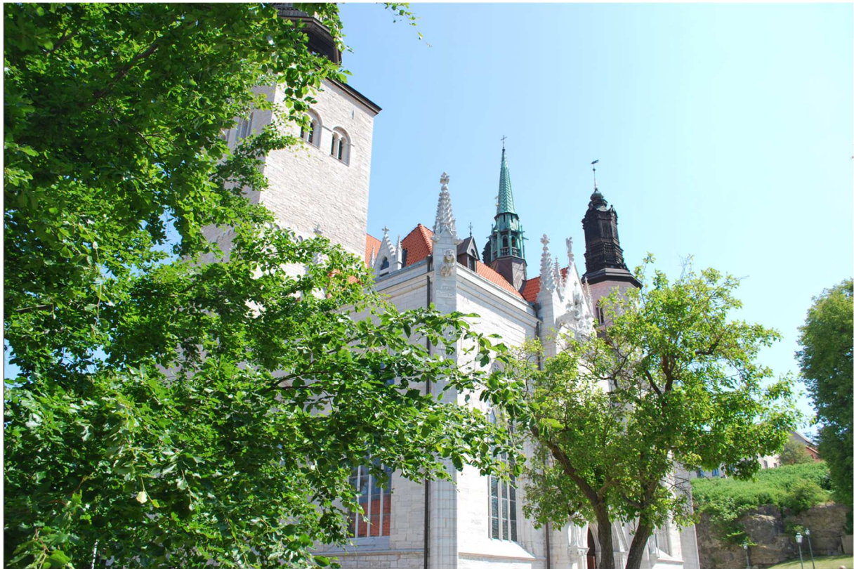
Visbys berömda domkyrka Sankta Maria med sina 3 torn.