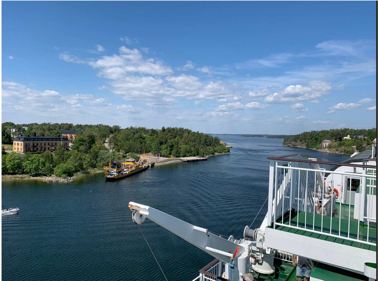
Fler bilder från Oxdjupet