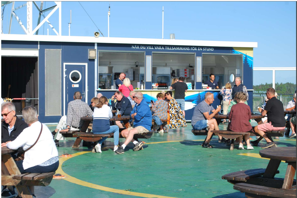
På soldäck fanns möjlighet att införskaffa drycker att svalka sig med i den varma solen.