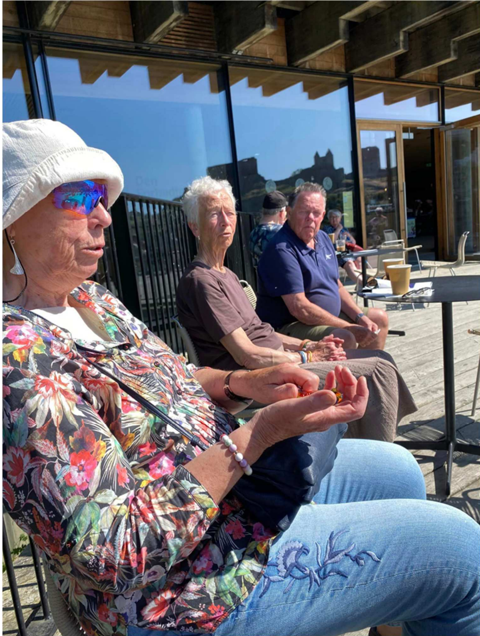
Här är några som valde förfriskningar i stället för promenad