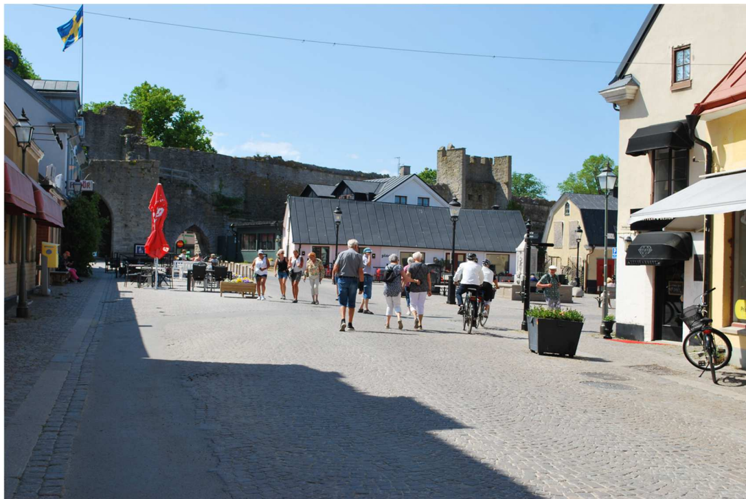
Vår promenad tog oss till Söderport innan vi vände om och gick tillbaka till Österport för att åka till fartyget.