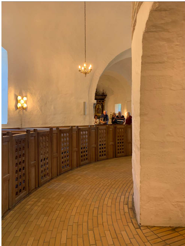
Bänkarna fanns utspridda runt i kyrkan så alla kunde inte se vad som hände framme vid altaret. Å andra sidan fanns möjligheten kunna sova under gudstjänsten utan att prästen såg det!