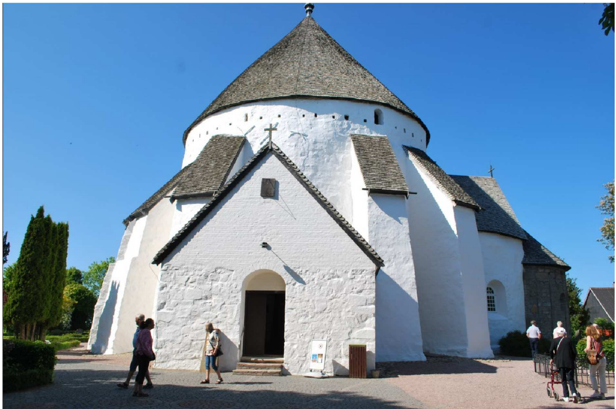
Mest känd av Bornholms rundkirker är Østerlars Rundkirke, eftersom den är den största i Danmark och den mest besökta. Hit kommer mer än 150 000 besökare årligen utöver de vanliga kyrkobesökarna. Østerlars Rundkyrka anses därför också vara en av Bornholms största attraktioner.