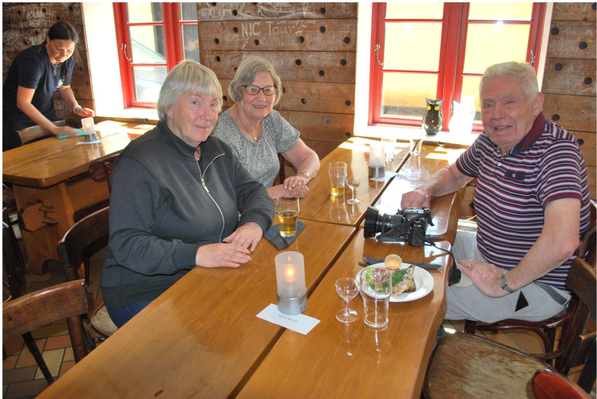
Ytterligare några som ser nöjda ut efter lunchen.