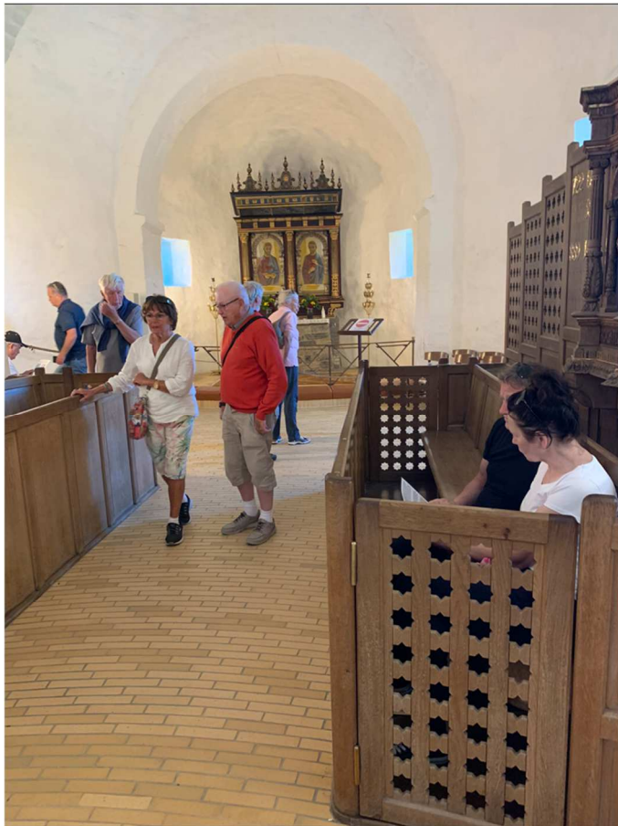
Altartavlan i Österlars kyrka