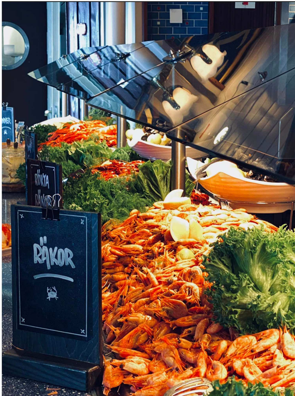
På kvällen bjöds vi på skaldjursbuffé på båten. Det fanns stora humrar, kräftor, musslor och annat gott.