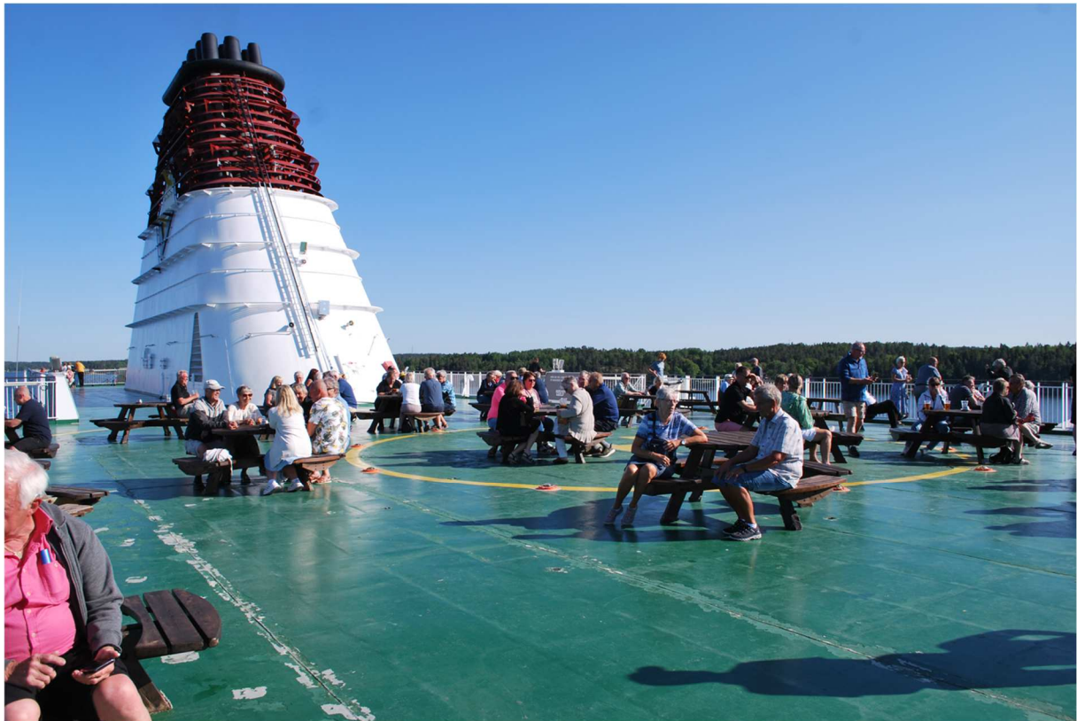
Många utnyttjade soldäcket innan middagen som serverades först kl. 19:30.