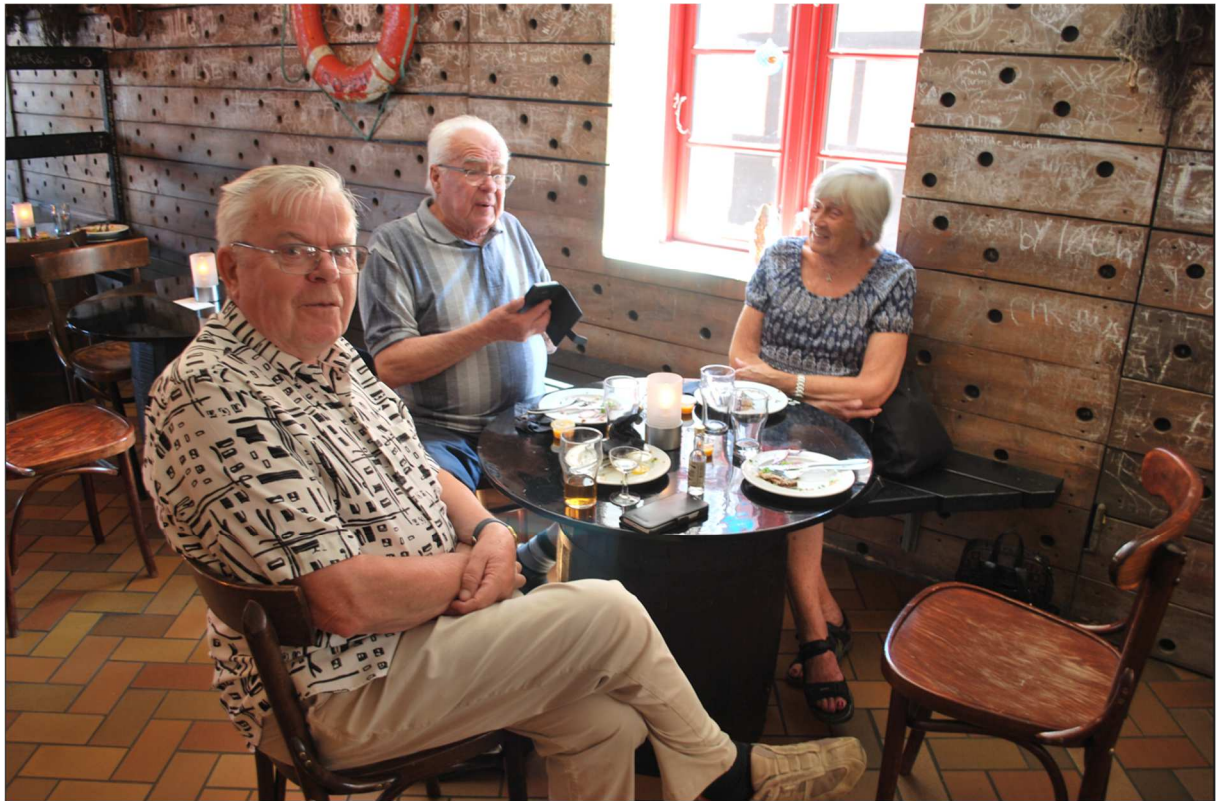
Några nöjda Järfällabor efter lunch med tillbehör.