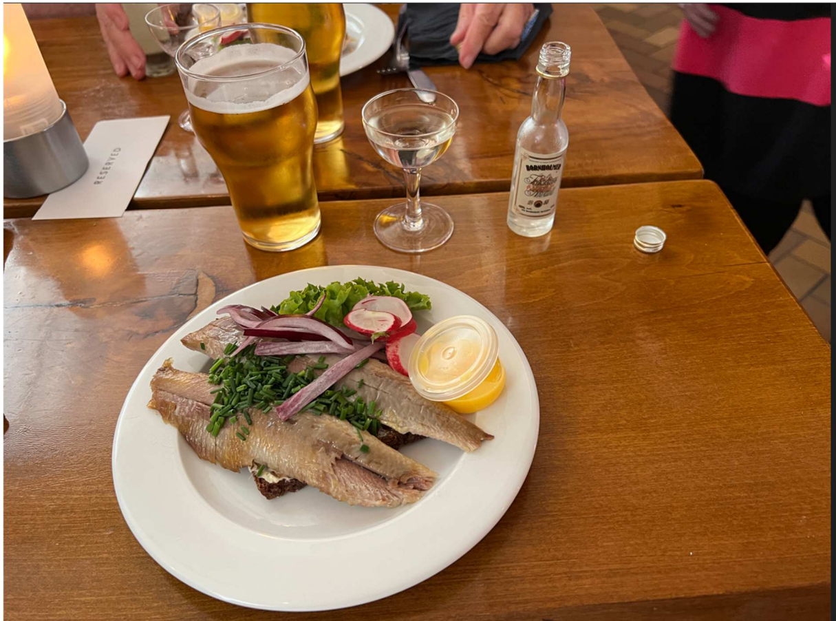
Så här såg det ut när man försett sig med alla nödvändiga tillbehör d.v.s. öl och "En lille en = en liten snaps".