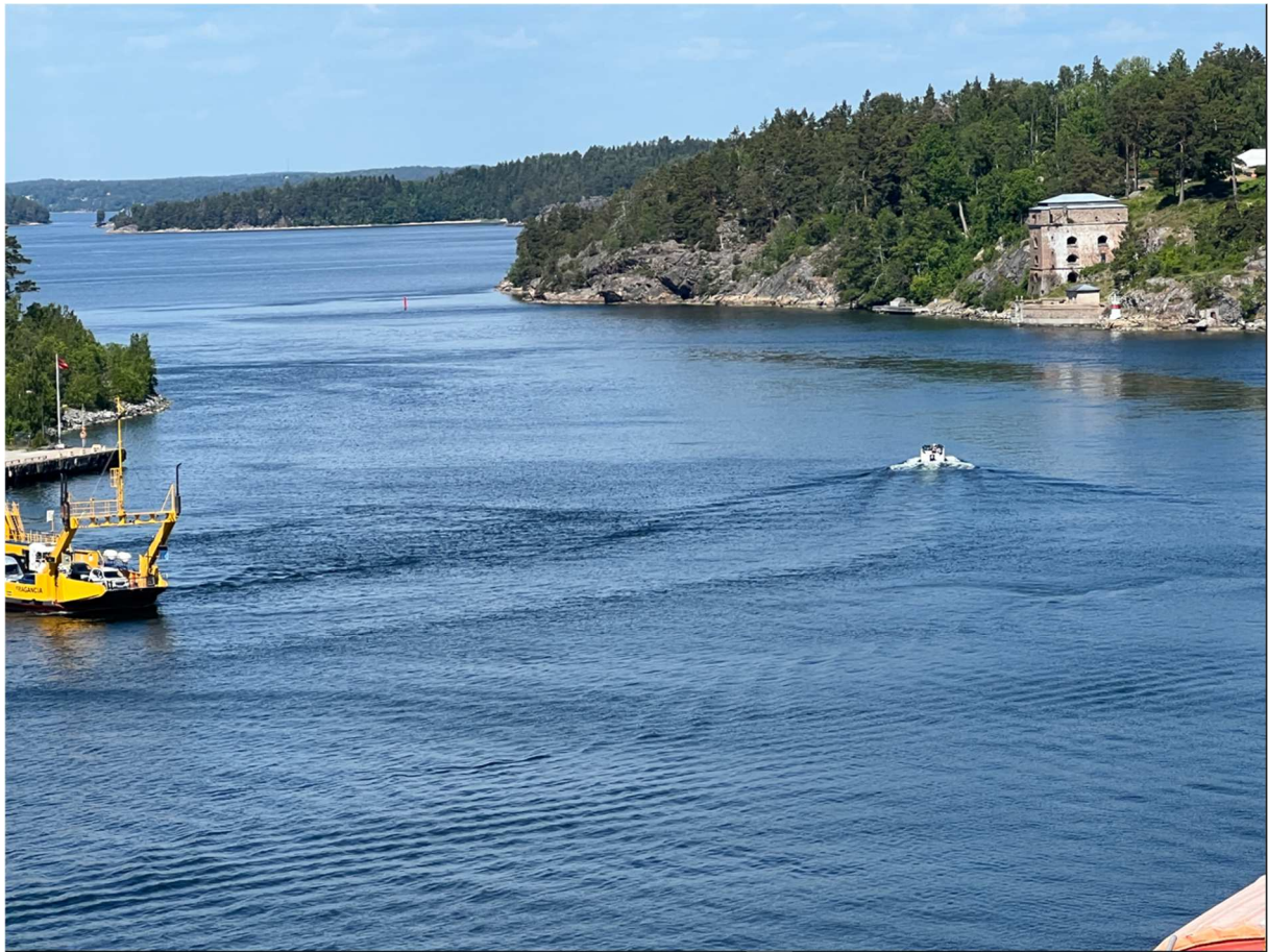
En del av Fredriksborgs fästning till höger i bilden.