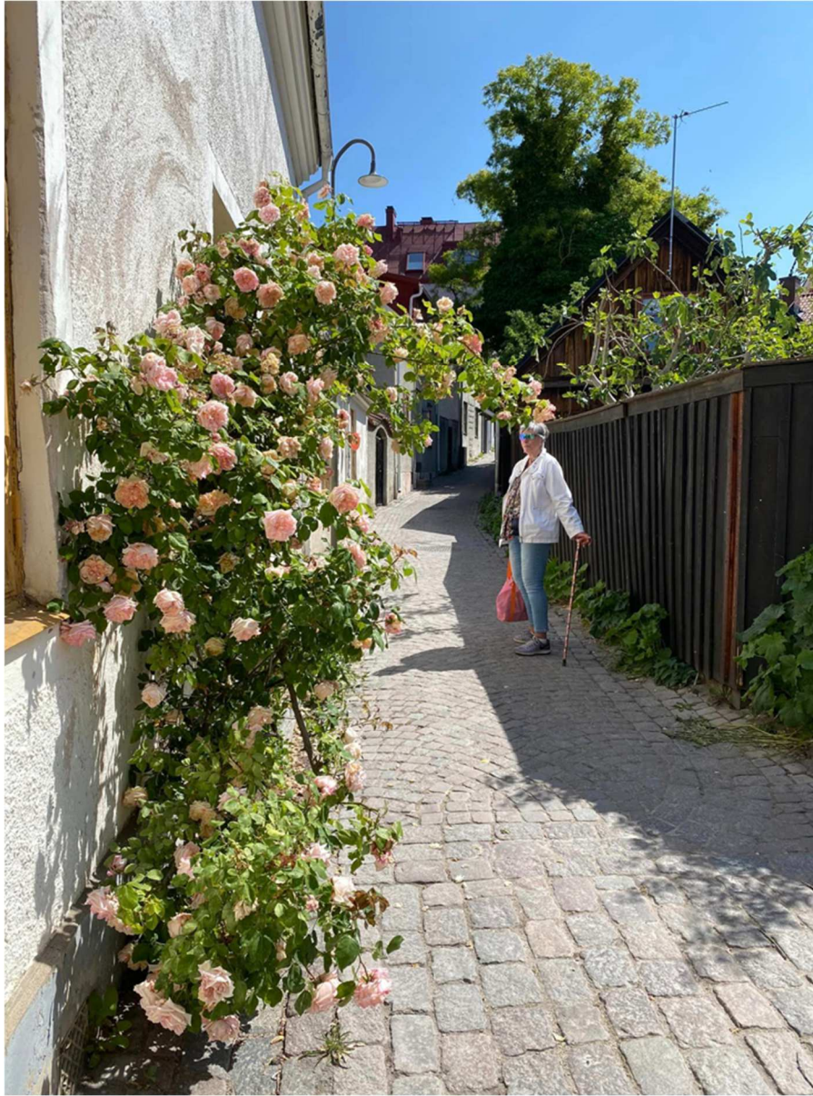
Visby kallas även rosornas stad och här ser vi lite av den varan