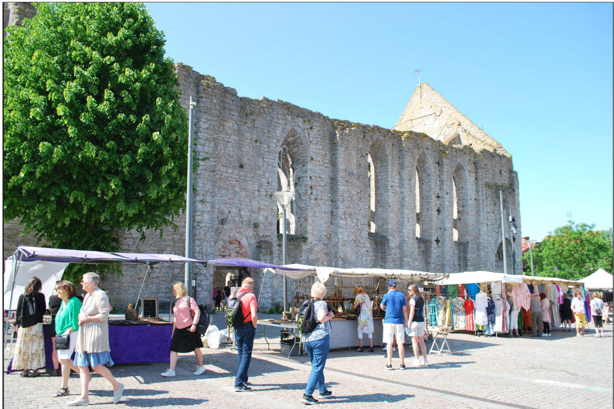
Kyrkoruinen vid Stora torget