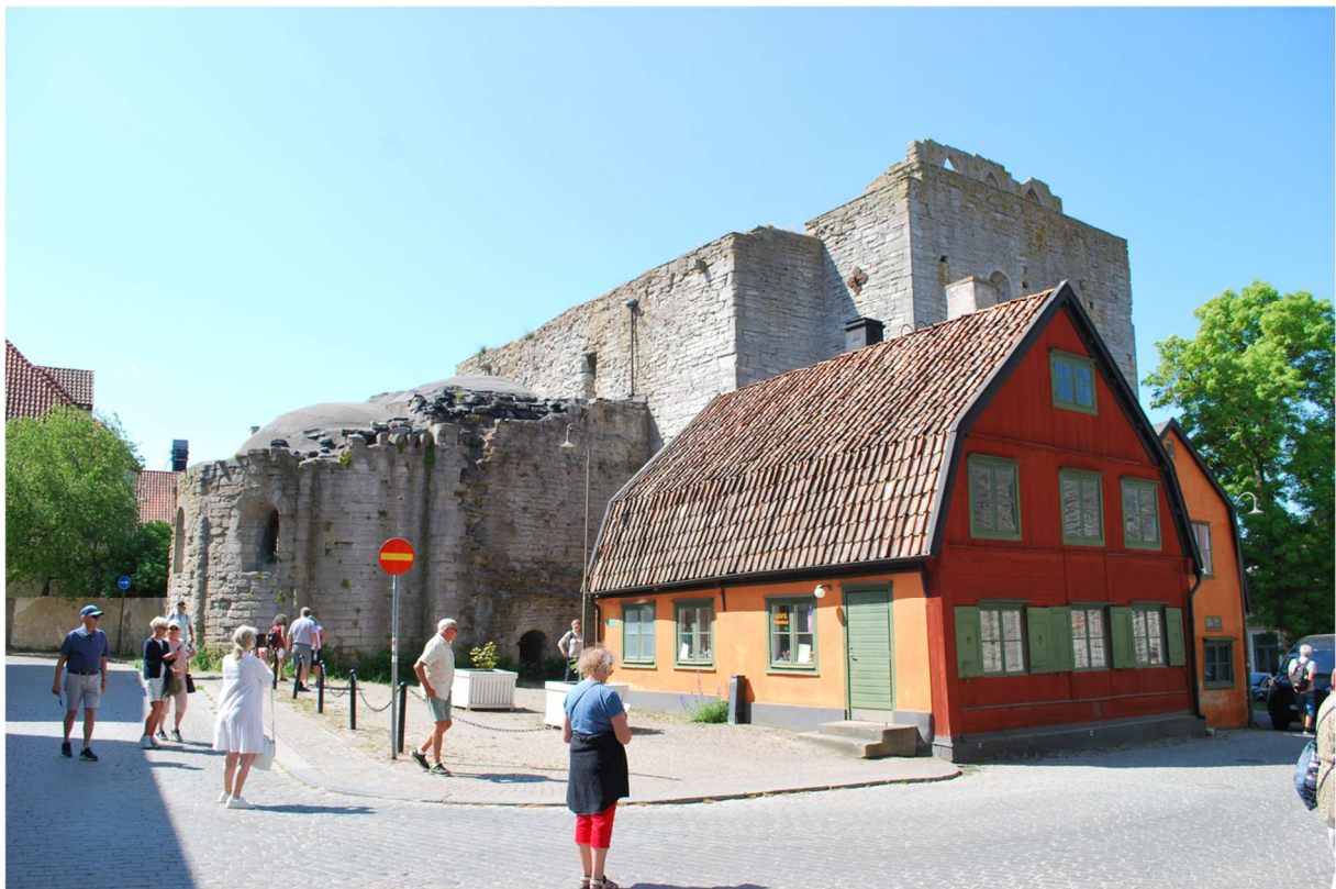
Någonstans i Visby