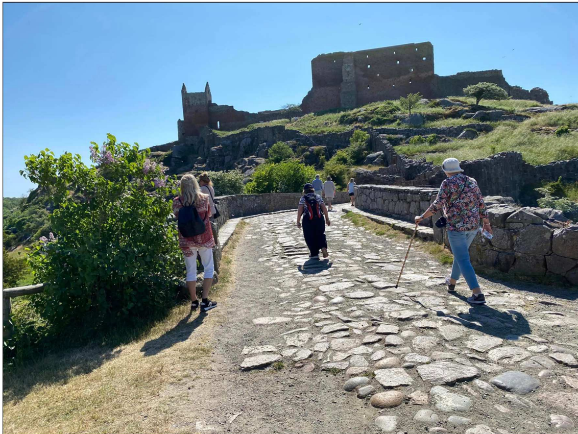
Uppför på knaggliga stenar.