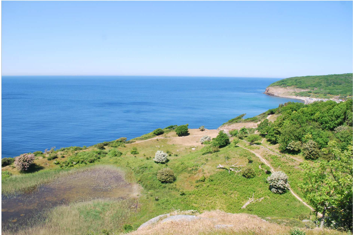
Nästan framme men först några bilder från den sagolika utsikten