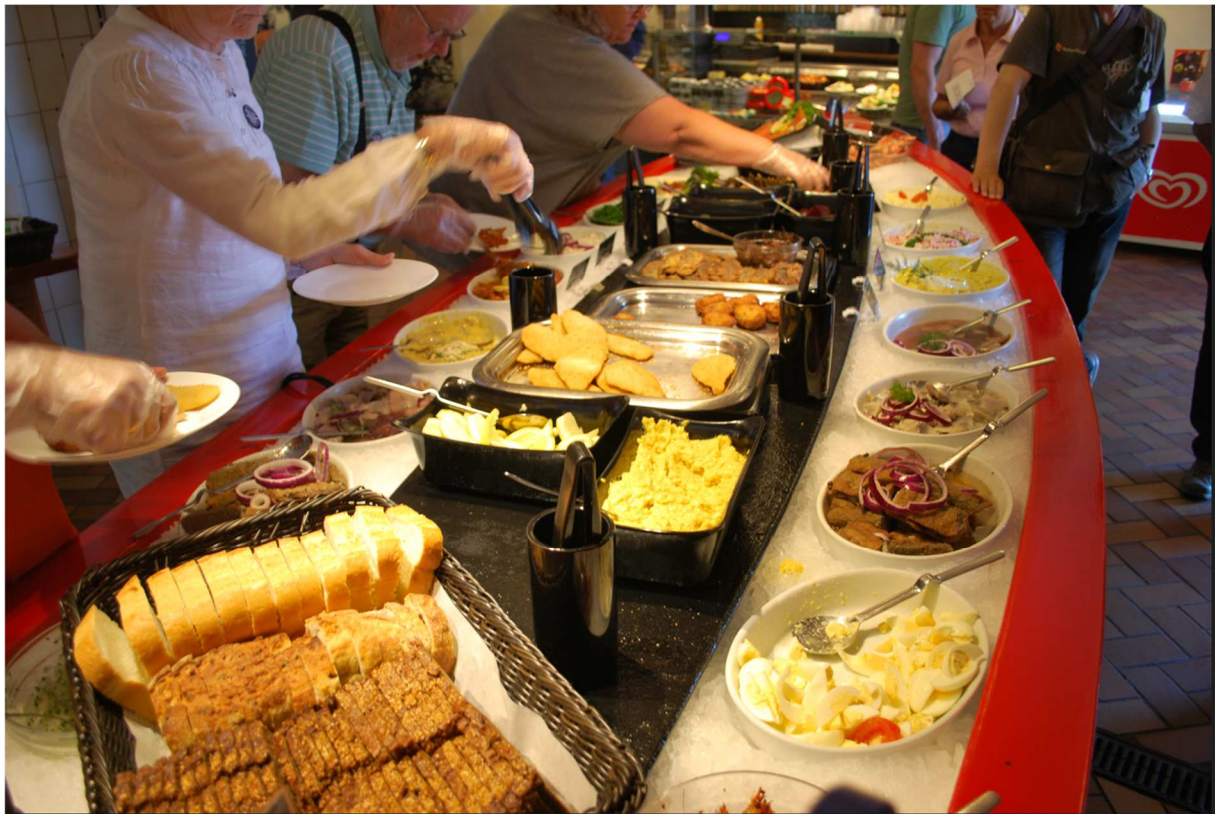
Gudhjems rökeri hade även en buffé att erbjuda men vår lunch var beställd i förväg. Nästa gång man kommer till Gudhjem skall man kanske prova buffén som såg mycket läcker ut.