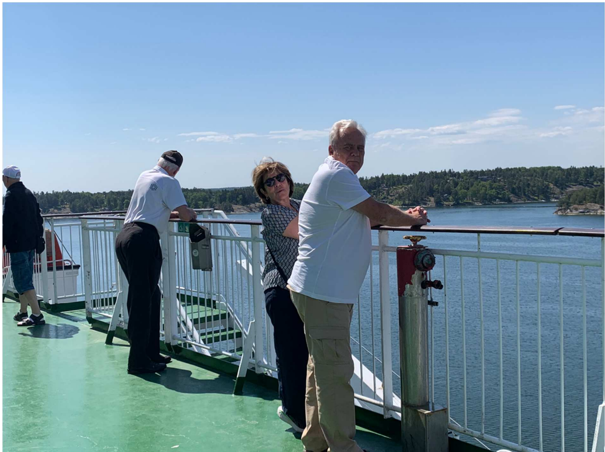
Här har vi två som beundrar de vackra vyerna vid Oxdjupet