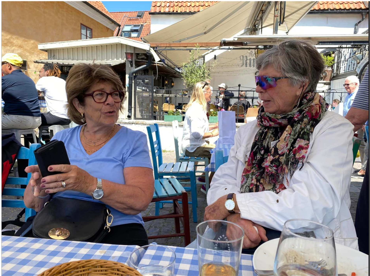
Två av våra damer som hittat ett vattenhål i Visby