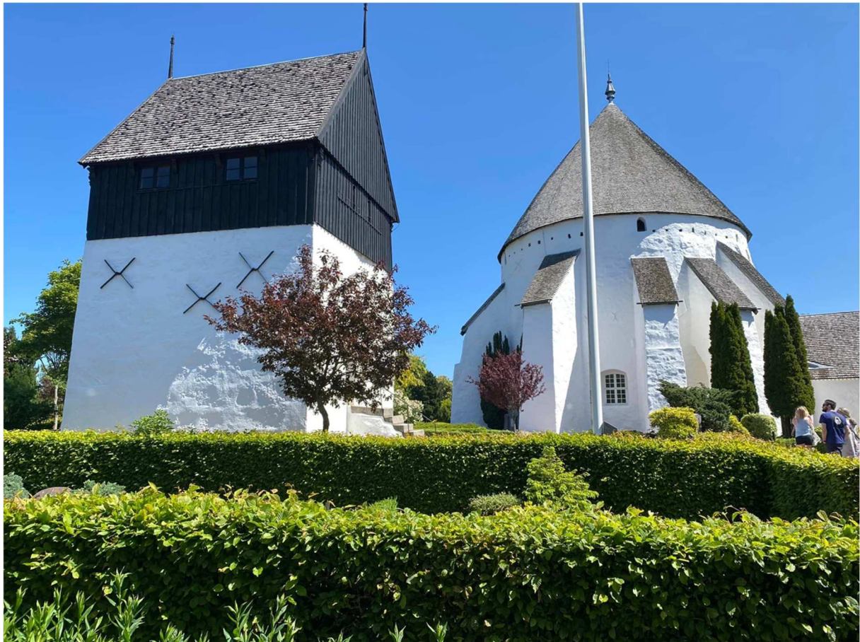
Efter Gudhjem åkte vi till Österlars rundkirke = Österlars rundkyrka.