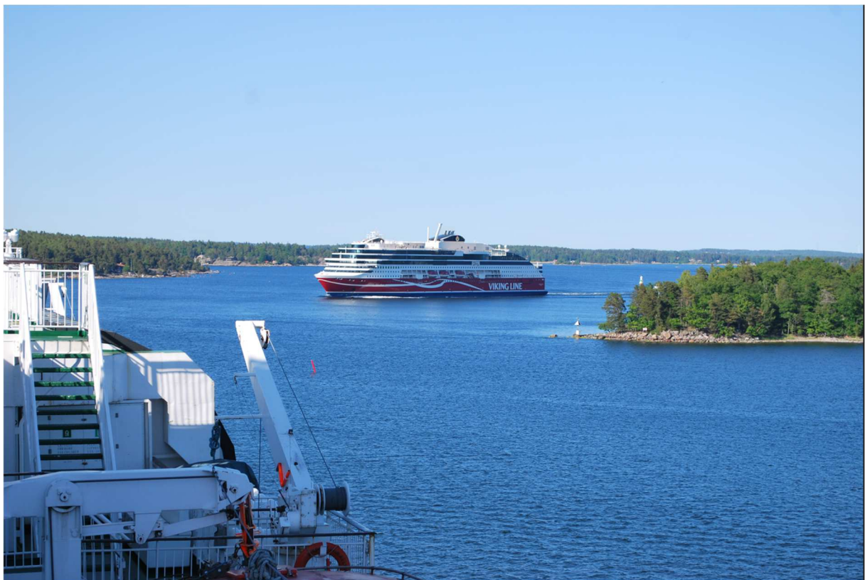
Vi mötte ett annat av VikingLines fartyg som var på väg mot Stockholm