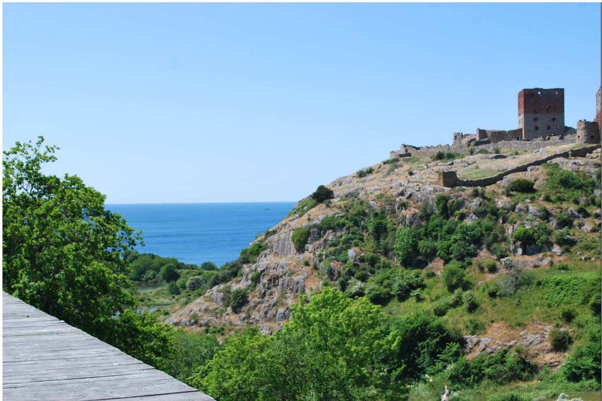
Vacker vy på väg till borgen