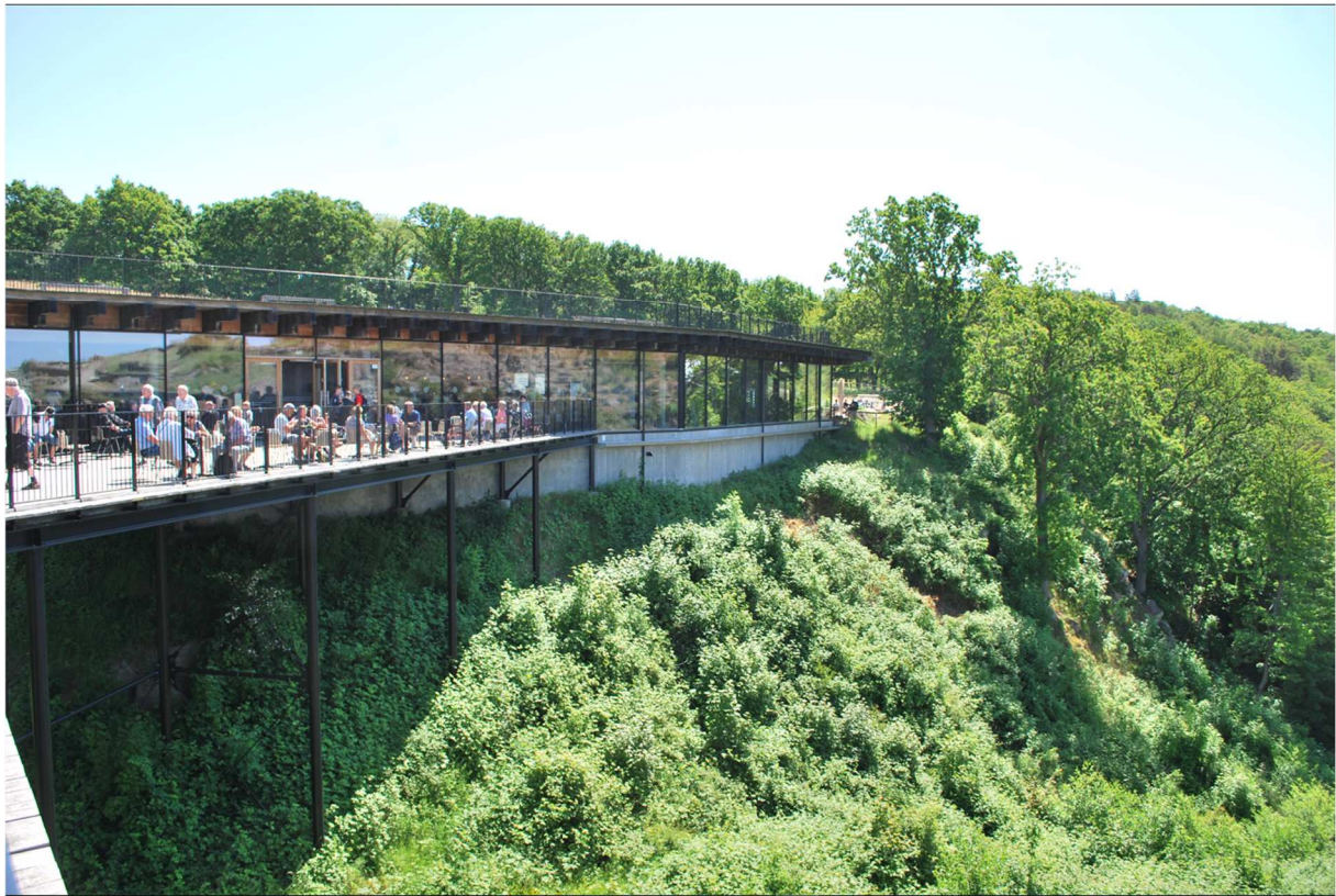
Bilden visar Visitor Center där man kunde slå sig ner och få lite förfriskning om man inte som många i vår grupp följde med vår guide upp till borgen.