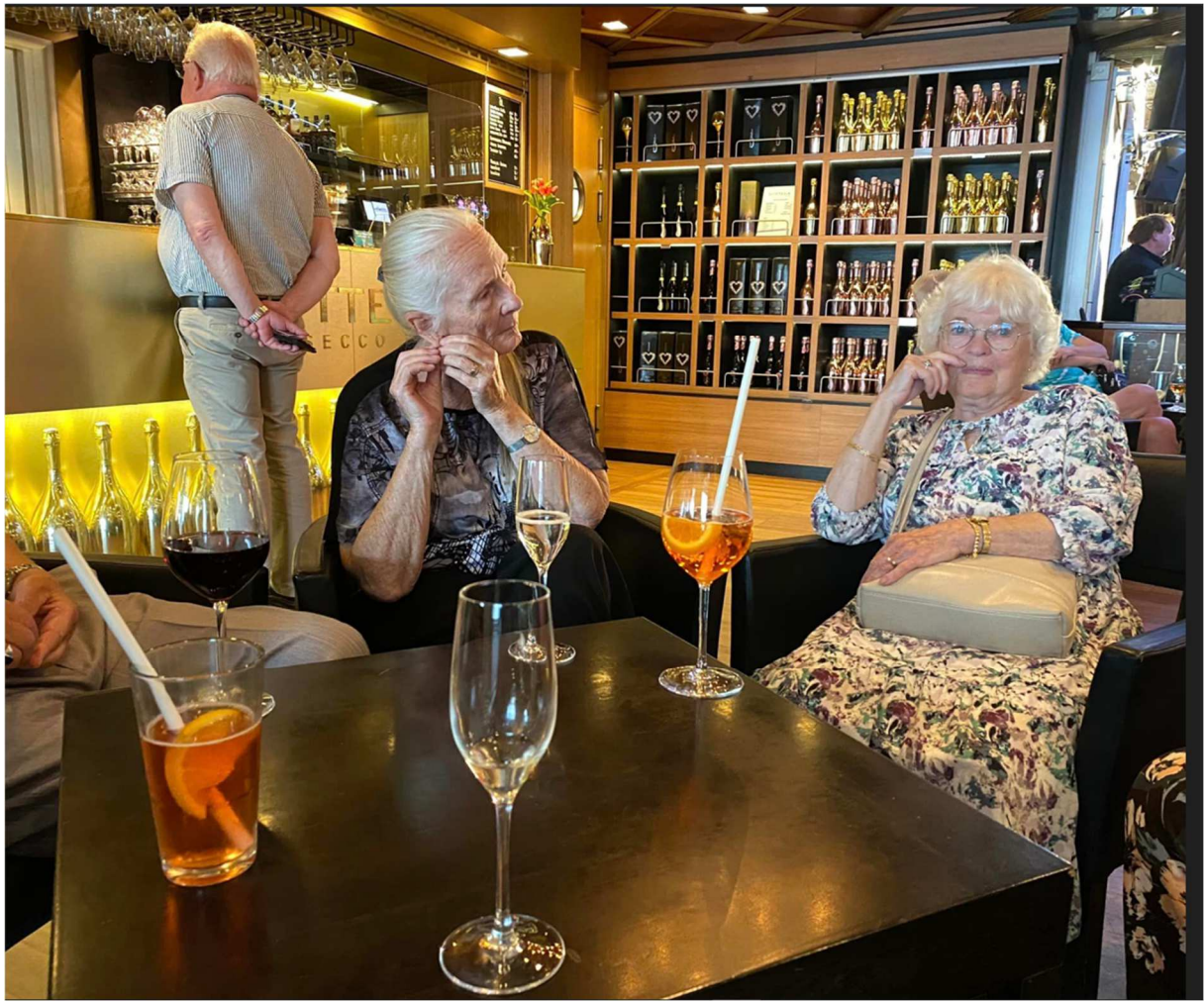
Samling i baren efter middagen.