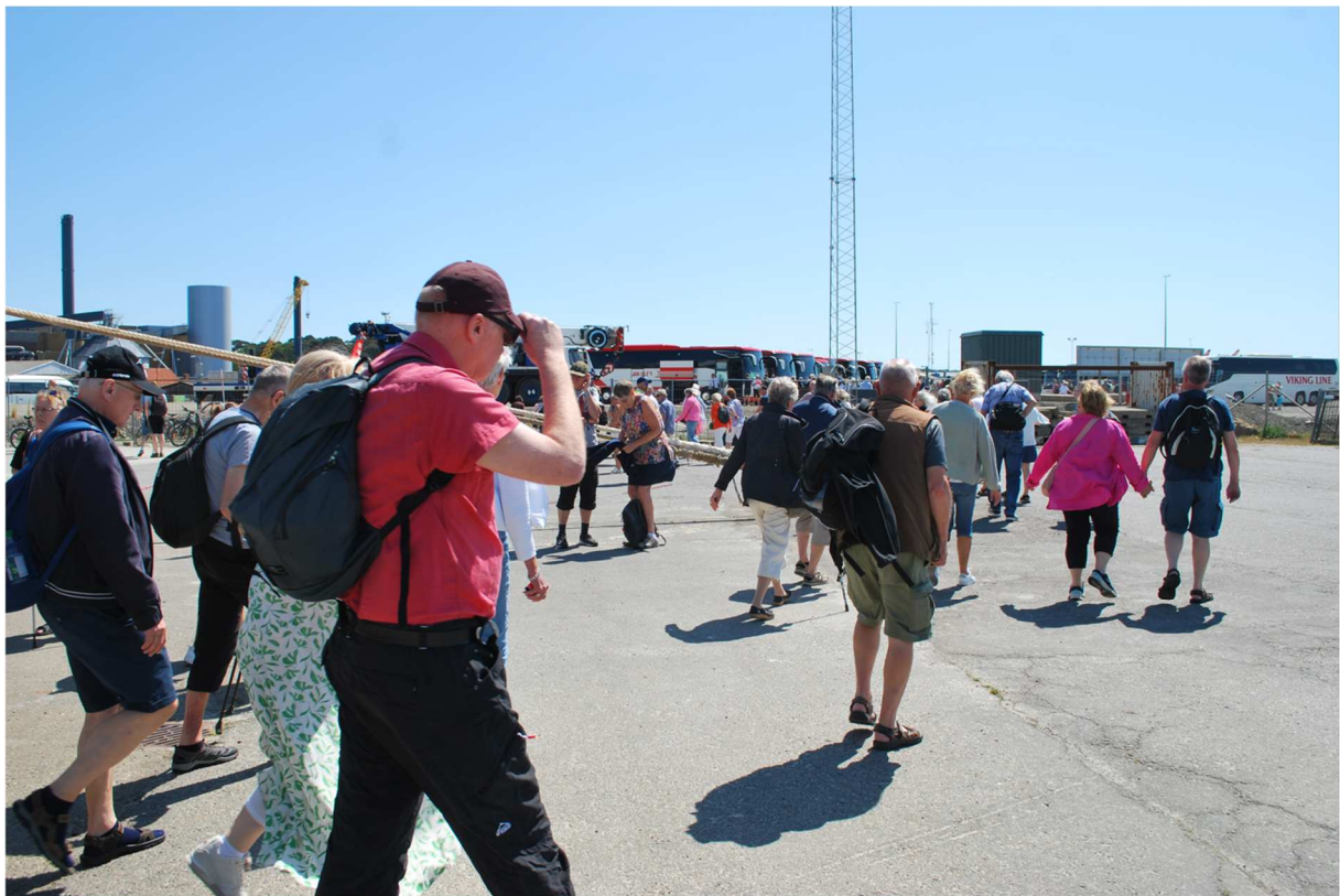
Mot utflyktbussarna med stormsteg. Hela vår Järfälla-grupp hade bokat utflykten "Bornholms guldorn"