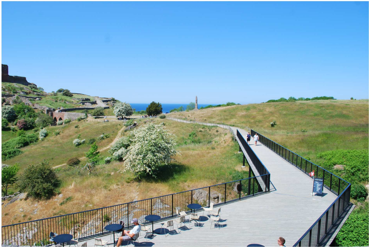
Nu skall vi påbörja vår vandring upp till borgen.