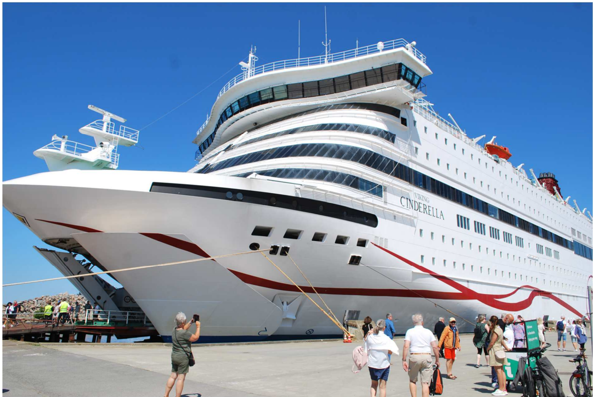
Cinderella i Rønne

Rønne hamn var kanske inte den vackraste platsen på Bornholm men snart skulle vi få uppleva Bornholm på riktigt.