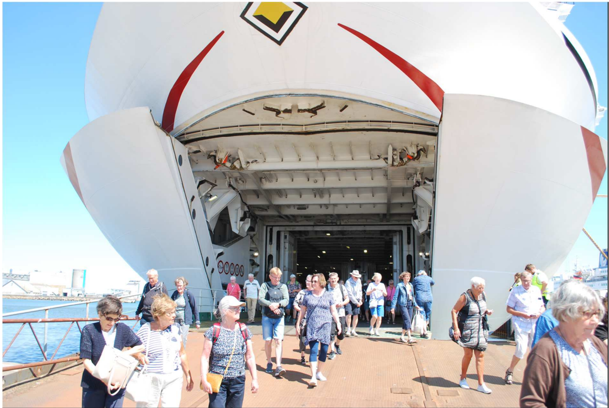
Nu har vi äntligen fått gå av fartyget och klockan har då hunnit bli 11:30 på förmiddagen Solen skiner från en klar himmel som den brukar göra på Bornholm