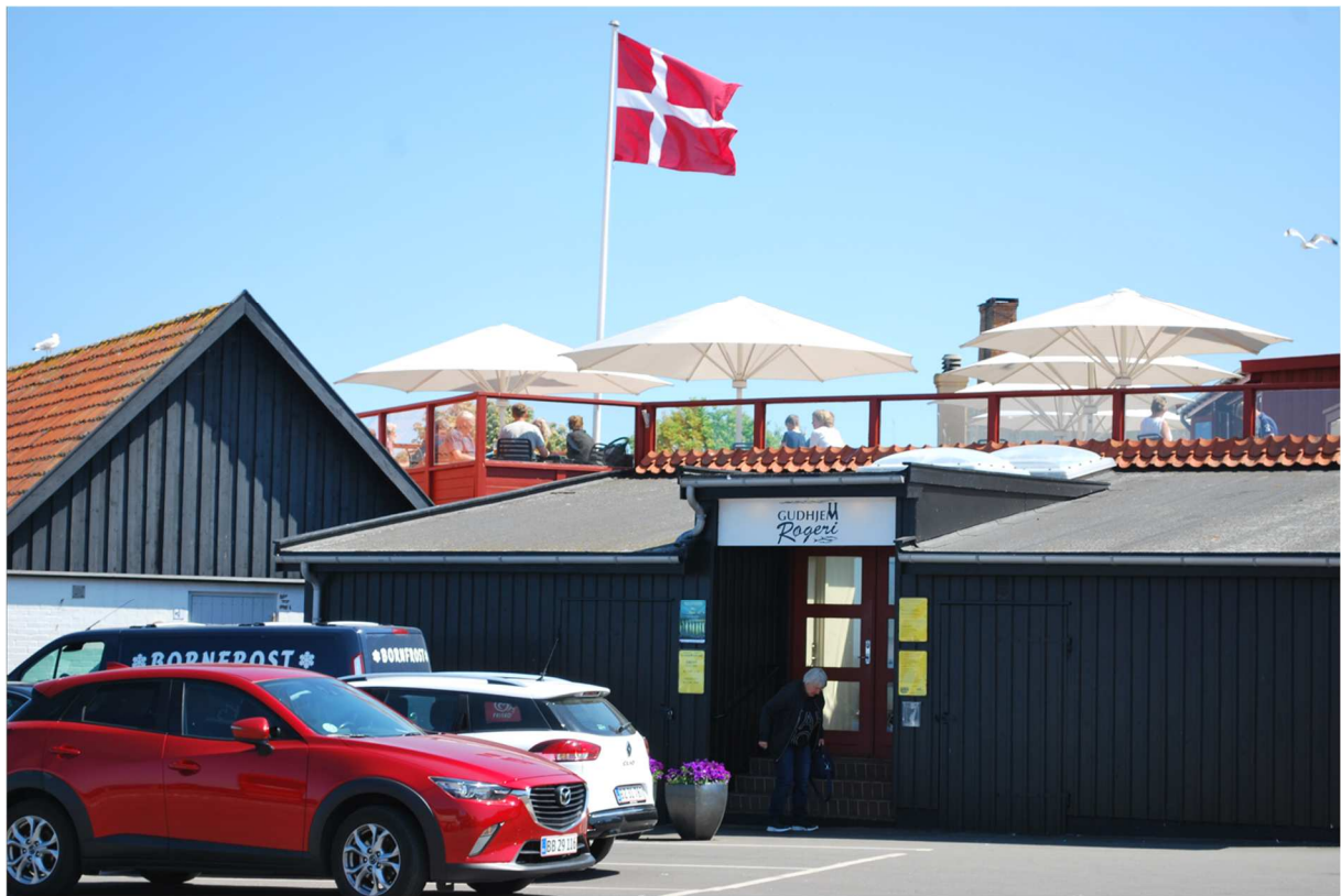
Här skall vi inmundiga vår lunch. Gudhjem Røgeri = Gudhjems rökeri.