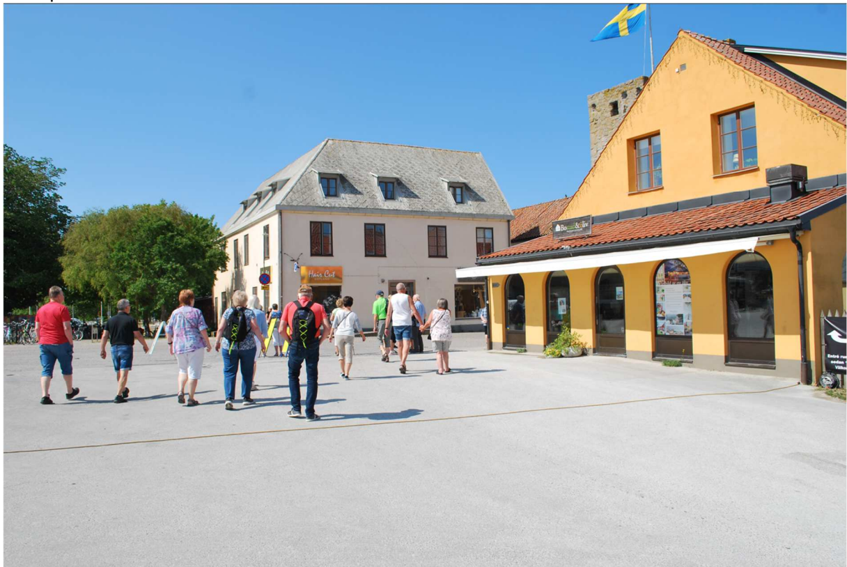
På väg in genom muren till Visby