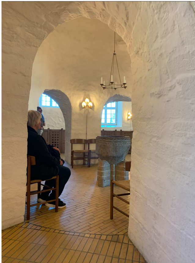
Dopfunten låg i en egen liten vrå av kyrkan.