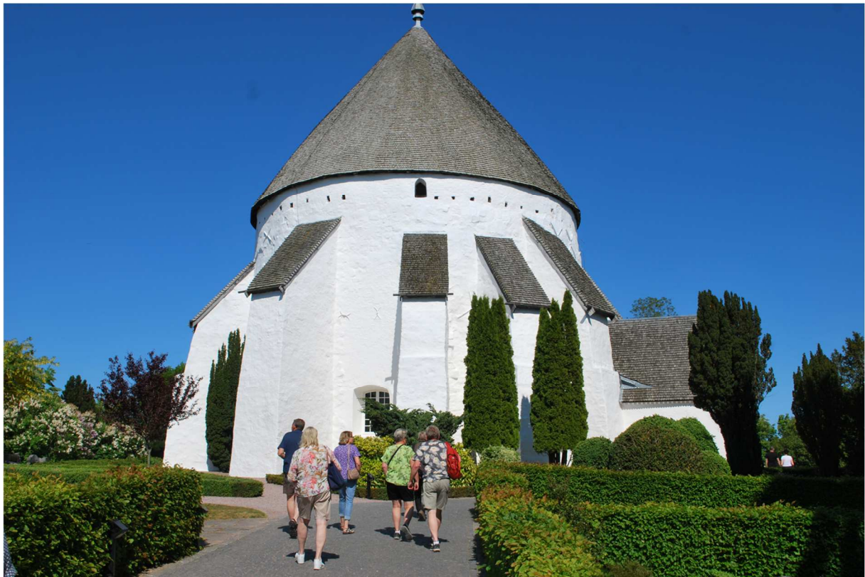
Rundkyrkorna byggdes som kombinerade kyrkor och försvarsverk och var och en av de bornholmska rundkyrkorna har sin speciella särprägel.