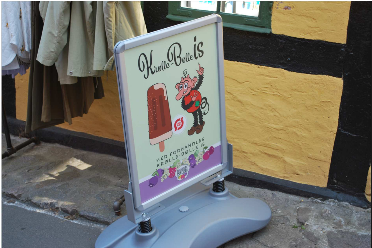
Glass är en stor grej i Gudhjem. Det fanns att köpa lite överallt.