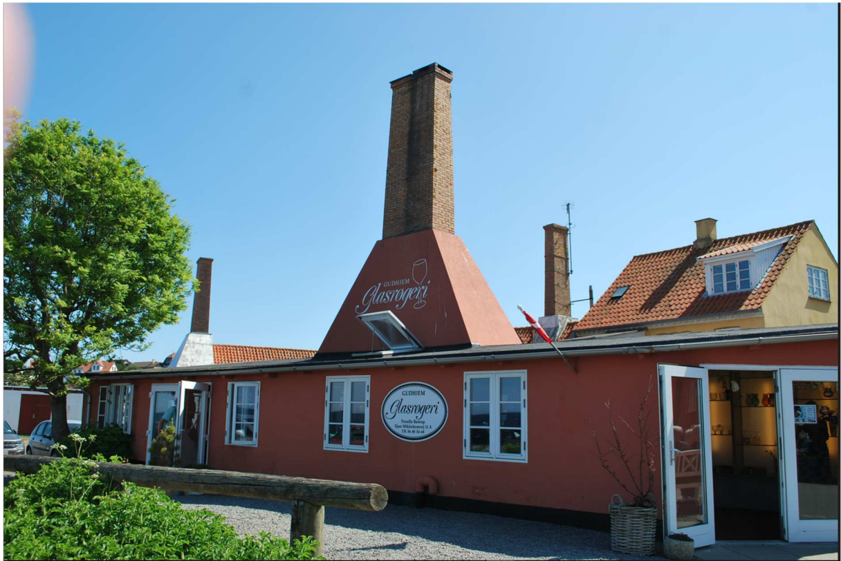
Efter lunchen tog vi en lite promenad i Gudhjems hamn och lite runt omkring.