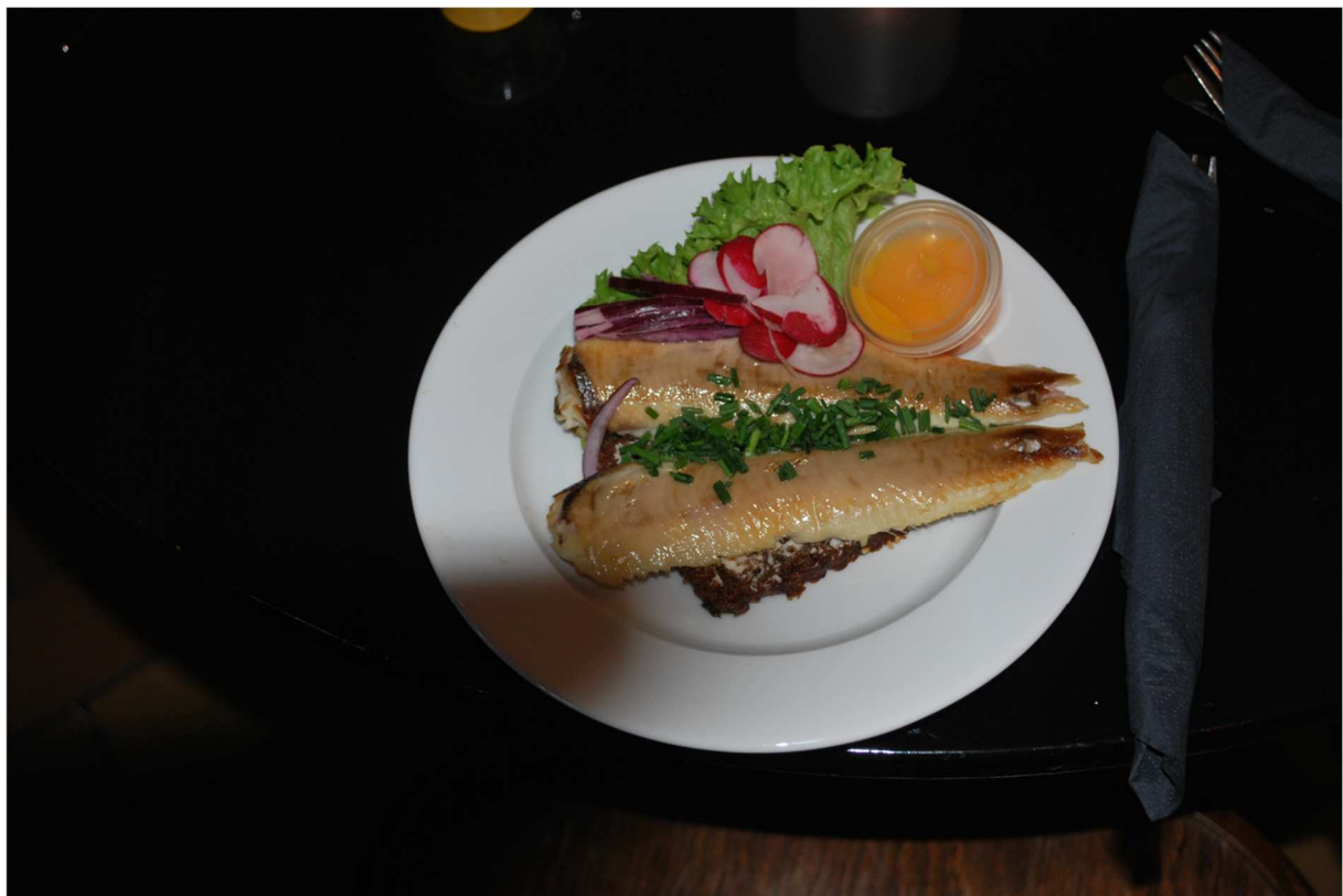
Detta är den lunch vi skulle äta d.v.s. "Sol over Gudhjem = Sol över Gudhjem".