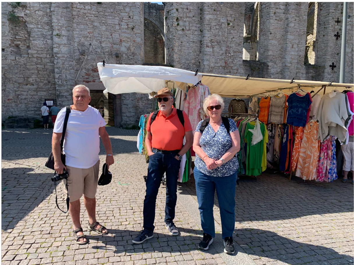
Här har t.o.m. reseskildringsförfattaren fastnat på en bild tillsammans med 2 grannar där vi bor som också är medlemmar i SPF Järfälla.