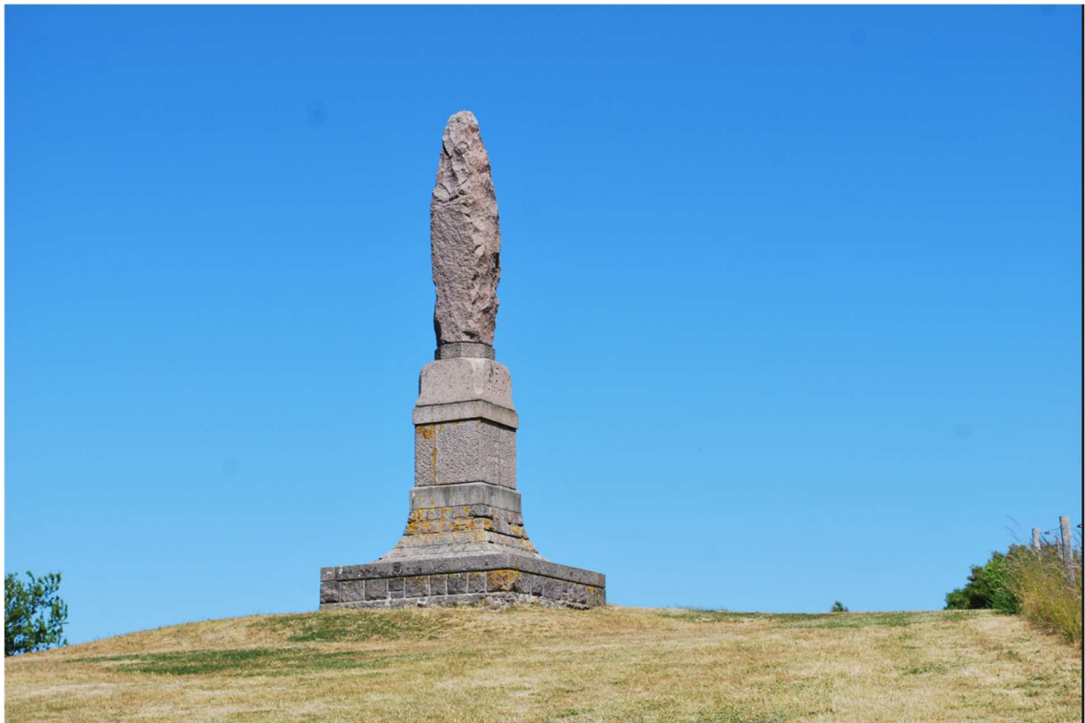
Detta är ett frihetsmonument som bornholmarna reste när man 1660 körde ut svenskarna från ön.

Ön tillhörde Danmark sedan länge men övergick till Sverige 1658 genom freden i Roskilde. De svenska styrkor som kom till ön mötte dock hårt motstånd, och efter svenskarnas misslyckande i nästa svensk-danska krig att erövra Köpenhamn återgick Bornholm till Danmark genom freden i Köpenhamn 1660.