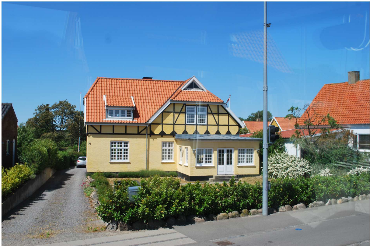
Nästan alla på Bornholm bor i egna hem. Väldigt få flerfamiljsbostäder finns på ön.