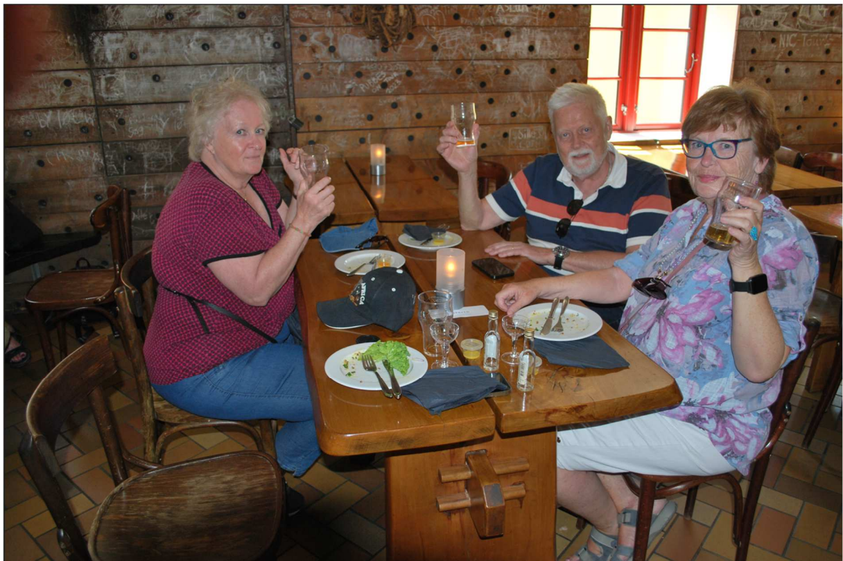
Här har vi några som uppenbarligen varit i baren och försett sig med både det ena och det andra.