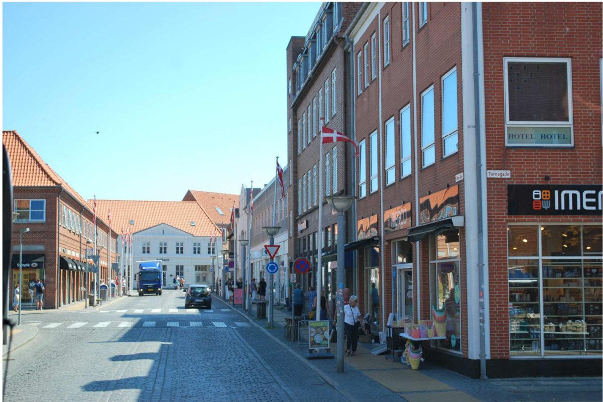
Exteriör från Rønne centrum