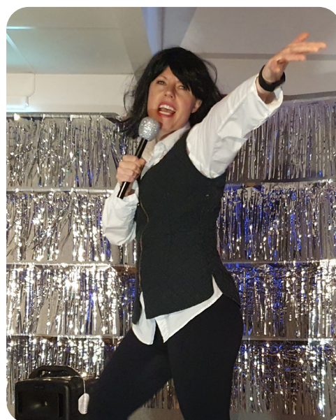
Mia som Carola...