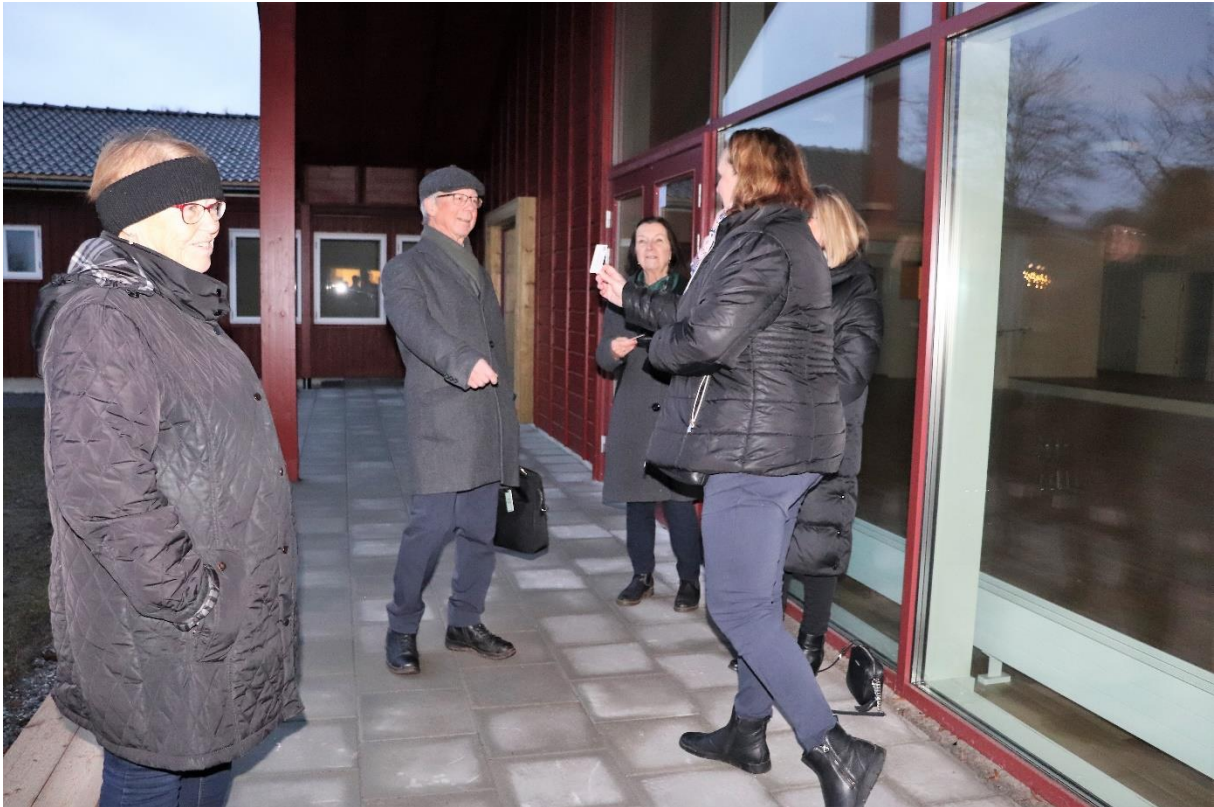
Ordföranden från PRO, SPF och Bålsta finska förening tar emot nycklar till sin nya hemvist.