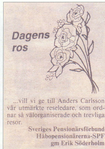
Infört i EP den 14 mars 1988.