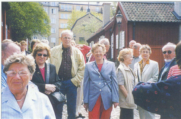
Bland Söderkåkar juni 2004.