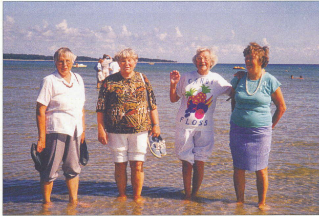
Fyra badbrudar på Gotland 1994.