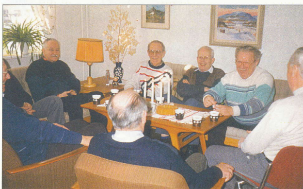
Cirkeln EU 1994.