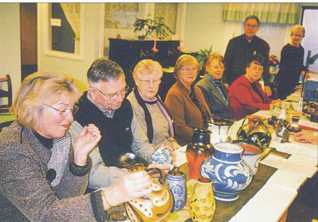
Cirkel om Uppsala Ekeby.