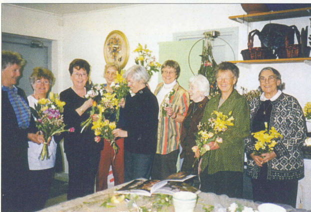
Kurs i blomsterbindning år 2002.