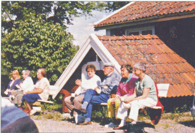
SPF-resa till Hälsingland juni 1997.