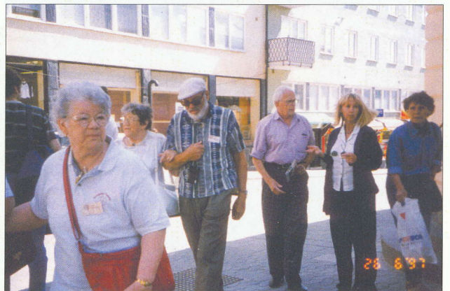
SPF-resa till Hälsingland juni 1997, På vandring i Hudiksvall.