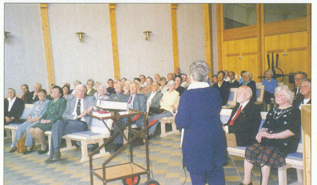
SPF Uppsala distrikts höstmöte 2000.