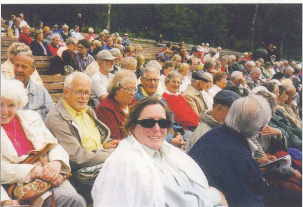
Publik vid Ingmarsspelen i Nås Dalarna.