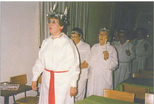
Luciatåg 13 december 1988.