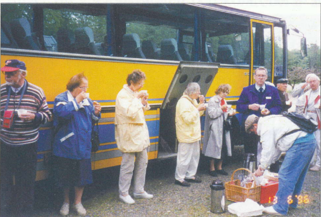
Busskaffe i samband med resa till Norrvikens Trädgårdar 1996.