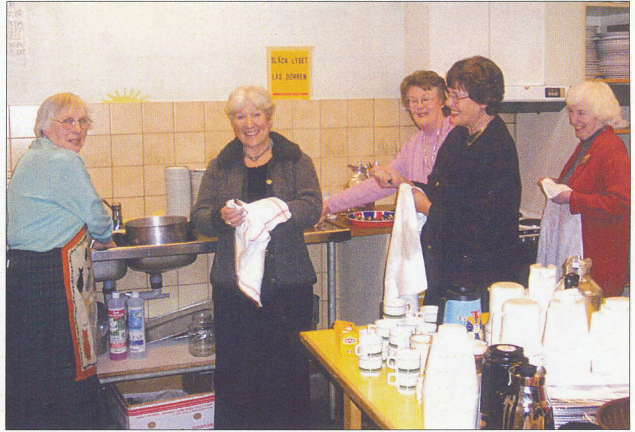
En kaffegrupp på ett månadmöte 2003.