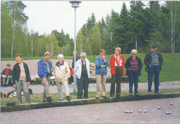
Boulebanan på Lastberget 2003.