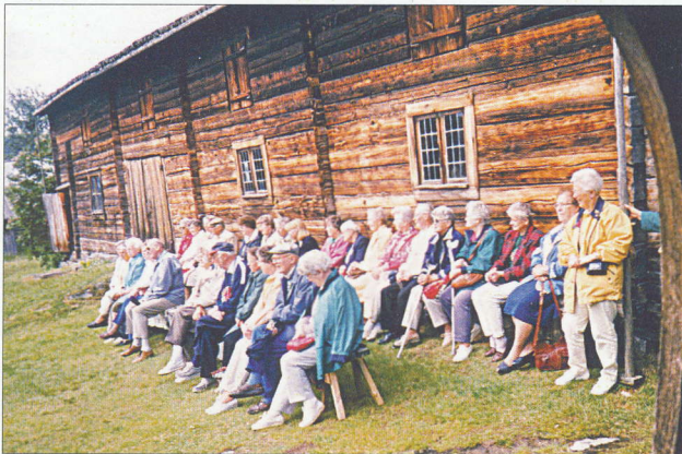
SPF-resa till Hälsingland juni 1997, Besök på Karlsgården.