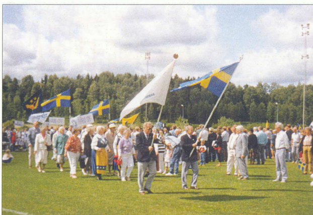
Nationaldagen 1993 firas av bland andra SPF och PRO på gröna dalen.