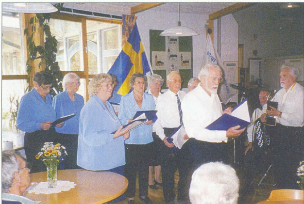
Duromoll underhåller vid Distriktets höstmöte 2000 i Bålsta.