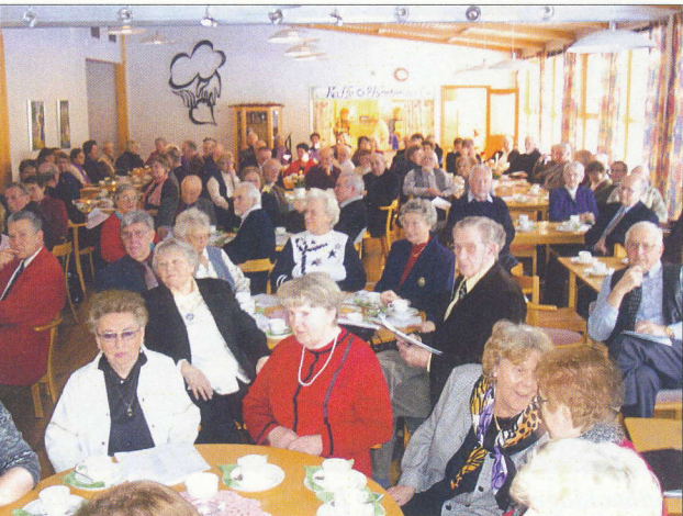
Månadmöte i Kyrkcentrum år 2003.