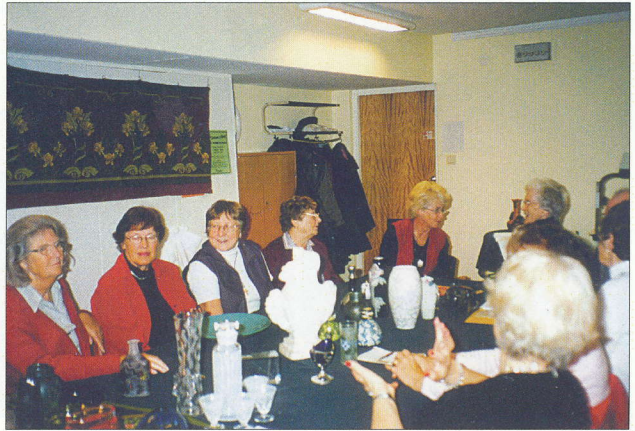
Studiecirkel i morgondagens antikviteter år 2000.