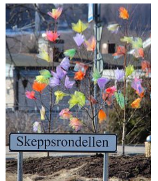
PÅSK. Nu är det påsk i Bålsta.

Förr brukade man smyga sig upp tidigt på fastlagsmåndagen och daska varandra in på bara skinnet med fastlagsriset. Men det var länge sedan. Anders Jagemo