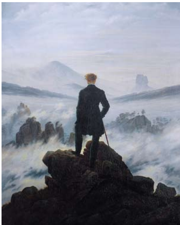
Caspar David Friedrich: Vandraren över dimhavet, 1818.

dominerade. Naturen var viktig, den besjälade naturen, och även konstnären var viktig, det romantiska geniet. Vi talade mycket om de fantastiska, stämningsfulla verken av den tyske målaren Caspar David Friedrich , född i, det då svenska, Greifswald .