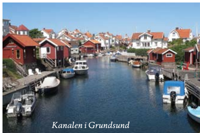
Kanalen i Grundsund