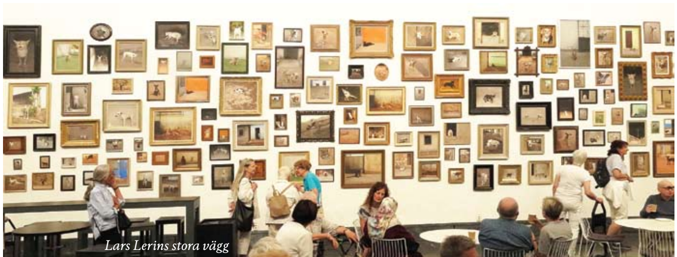
Lars Lerins stora vägg

Det var ett fantastiskt fint väder denna dag vilket bidrog till en fin upplevelse. Efter guidningen hade vi fri tid att gå igenom utställningen en gång till och titta närmare på intressanta motiv och också besöka museibutiken. Efter detta begav vi oss av ut i solen upp till Hasselbacken för lunch.