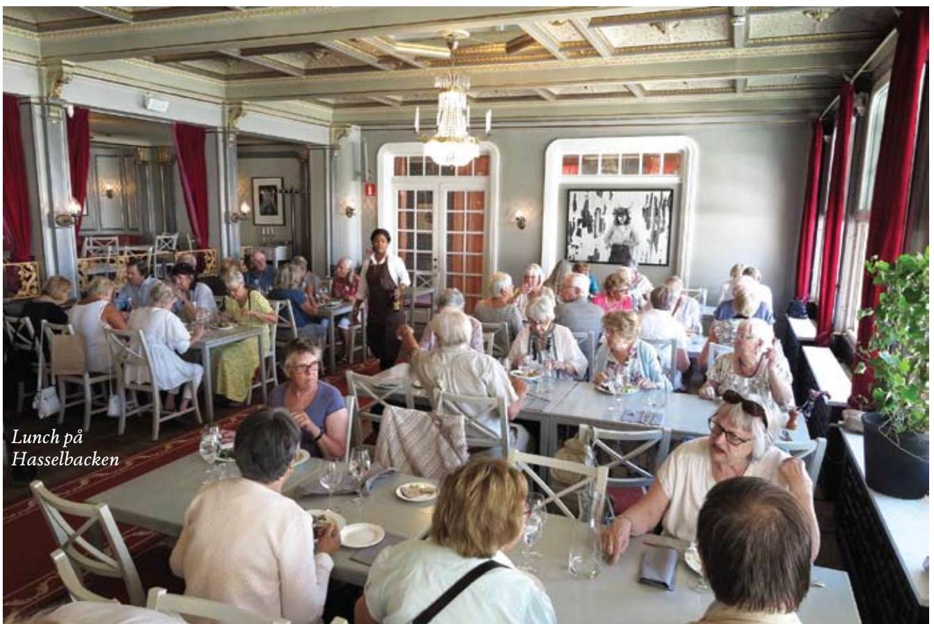
Lunch på Hasselbacken