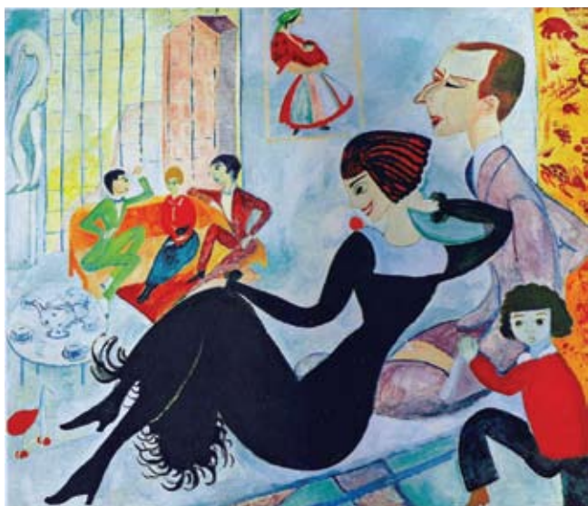
Sigrid Hjertén: Ateljéinteriör , 1916.

Expressionister var även den rysk-franske Chagall (inspiratör till surrealismen) och den ryske konstnären Kandinsky (tidig med abstrakt konst) – tillsammans med Paul Klee aktiv vid Bauhausskolan. Dessutom har vi givetvis talat mycket om Picasso och kubismen och om Dali och surrealismen (i Sverige representerad av "Halmstadgruppen") och om många andra modernistiska varianter – inklusive popkonsten.