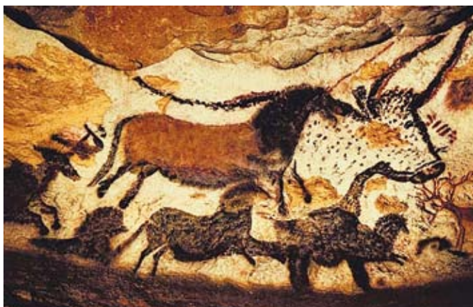
Grottmålningar i Lascauxgrottan i Frankrike, 17000–12000 f.Kr.

När det gäller den konsthistoriska utvecklingen började vi redan förhistoriskt med den decimeterhöga, kalkstensfigurinen Venus från Willendorf , en kvinna med mycket yppiga former (funnen nära byn Willendorf i Österrike) och fortsatte sedan med några av världens äldsta bildkonstverk: de fina djurmålningarna i Lascauxgrottan i Frankrike.