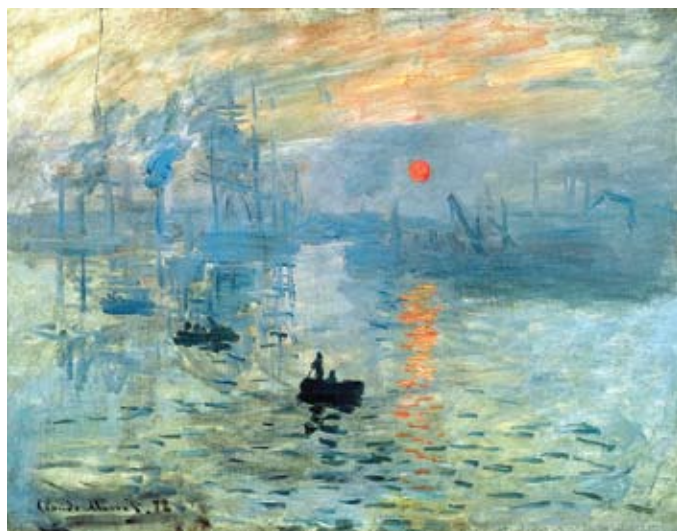
Claude Monet: Impression, soluppgång, 1872.

Begreppet impressionism har en intressant historia. Claude Monet ställde ut sin målning Impression, soleil levant (Intryck, soluppgång). En kritiker, som var negativ, hånade Monet och kallade honom impressionist, vilket ledde till att hela konstrikningen började kallas impressionism.