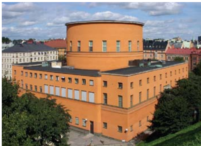
Gunnar Asplund, arkitekt: Stockholms stadsbibliotek, huvudbiblioteket, 1928.

I Stockholm finner vi många byggnader av framstående svenska arkitekter, bl.a. Stockholms stadshus av Ragnar Östberg, Stockholms konserthus av Ivar Tengbom och Stockholms stadsbibliotek av Gunnar Asplund.