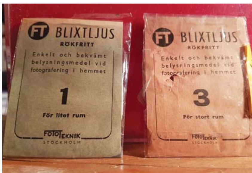
Detta är blixtpulver från 1920 talet, lånat från fotograf Kerstin Eilerts samlingar.