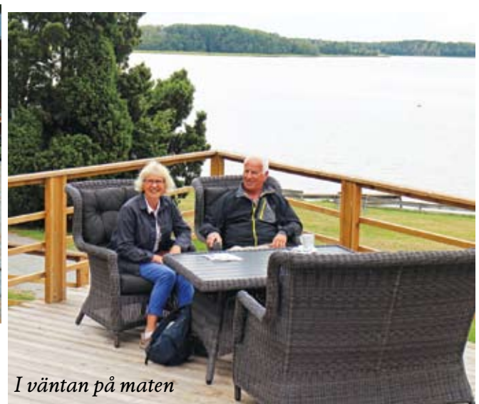
I väntan på maten

Vi hade förväntat att 22 personer skulle äta lunch på det som kallas Bresse krog men det hade man tydligen helt missat. Tyvärr tog det därför lång tid att servera oss. Under väntan på lunchen kom det faktiskt några droppar regn men inte mer än att vi satt kvar under bar himmel.