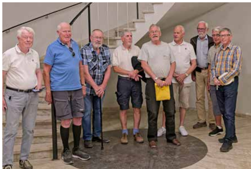
Vi som var med.

När vi avslutat visningen, tackat vår guide för en förträfflig visning och vi kommer upp på ASEA-torget möts vi av värmen och ilade snabbt till våra bilar där vi kunde njuta av en sval hemfärd till Bålsta.