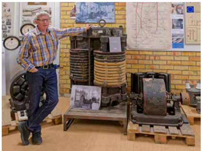
3-fastransformator vid linjen Hällsjön-Grängesberg 1883. På ömse sidor generatorer.

utnyttjas med att bygga vattenkraftverk och då slapp man också smutsa ner storstäderna med kolröken. Men det blev lång väg att transportera elen och för att klara detta beslutades att gå över tillväxelström, 3 faser och högspänning. Det var här som ASEA blev marknadsledande på att skapa materiel för de höga spänningarna.