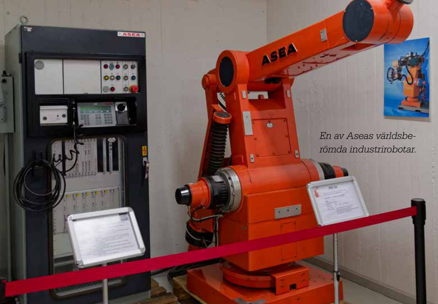
En av Aseas världsberömda industrirobotar.