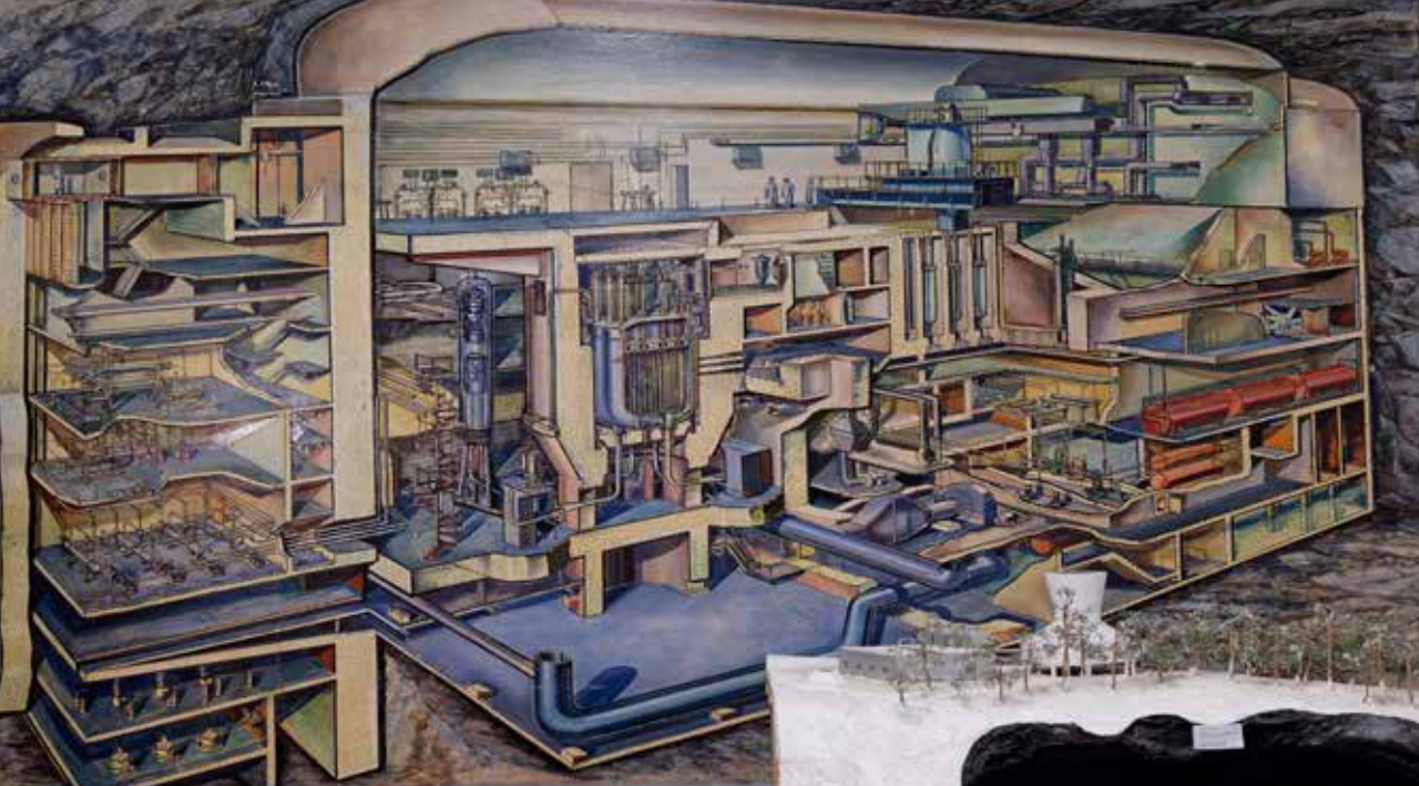
Modell på hur Ågestareaktorn såg ut inne i berget.

I dag arbetar ABB med eldistributionsledningar på miljonvoltsnivå. ASEA hade länge världen största högspänningslaboratorium i Västerås.