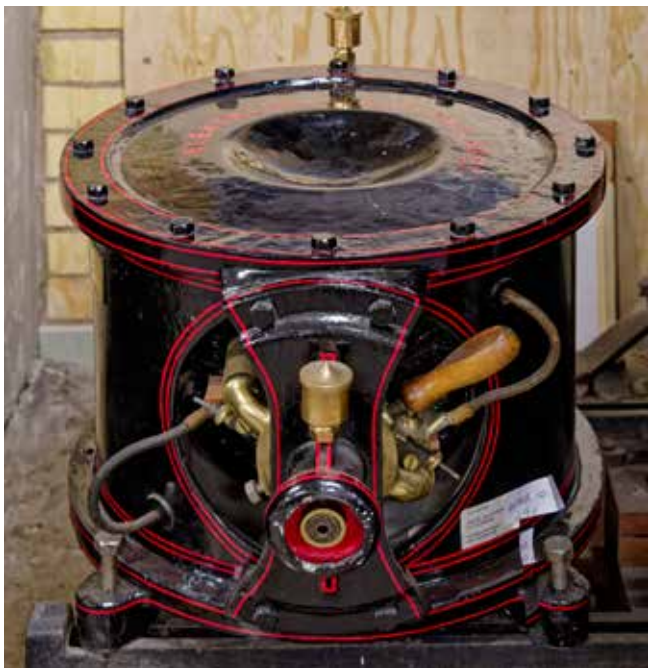
Dynamomaskin 'Grytan', vackert restaurerad.

Efterhand dök det upp fler och fler tillämpningar för att använda elenergin till ändamål som tidigare aldrig hade varit möjligt. Marknaden fullkomligt exploderade i produkter som kunde drivas på el. I de stora städerna och på stora fabriker byggdes koleldade kraftverk som producerade el. I början användes likström. De stora städerna fick belysning, både i hemmen och på gatorna. De gamla hästspårvagnarna fick elmotorer och ånghissarna i fastigheterna elektrifierades. Men efterfrågan ökade så kapaciteten började ta slut. Då kom tankar på att få elkraften norrifrån. Där fanns det älvar där det fanns det rinnande energi i form av vatten. Den lösningen skulle kunna