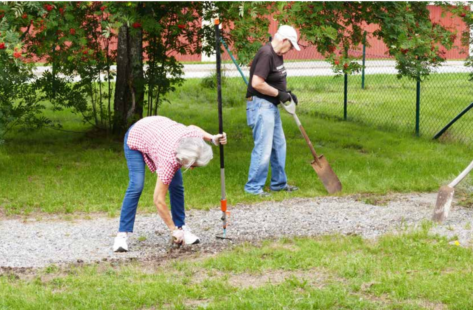
Det var en gång en gång, men gud vad den är lång.