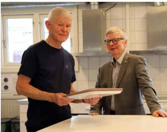
Bemanning till köket sökes, även män är välkomna.