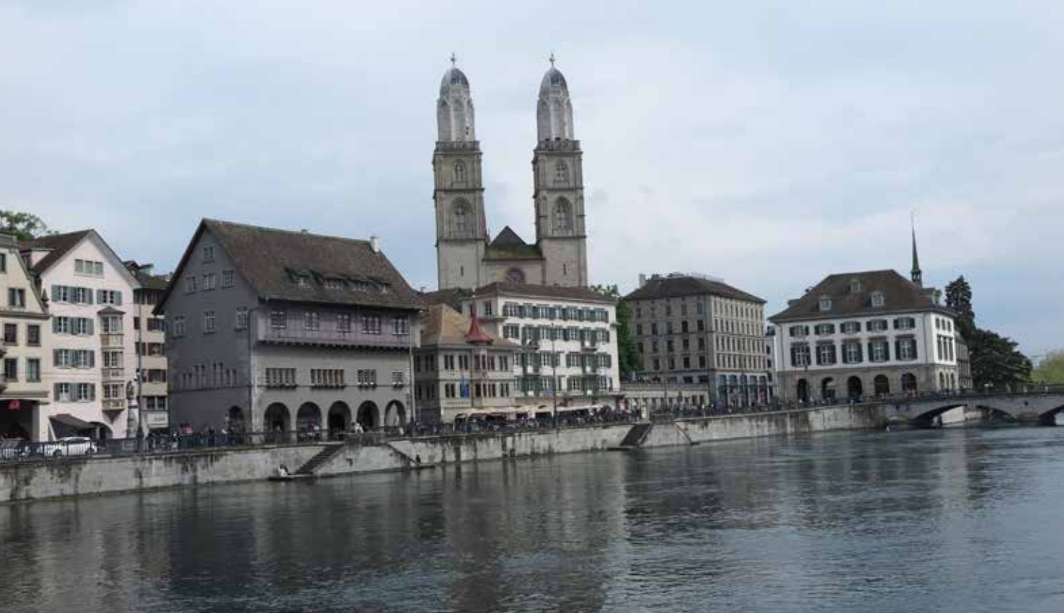
Stadsvy från Zürich