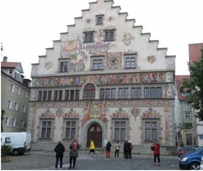
Rådhuset i Lindau

under ett antal år före andra världskriget transporterade bl.a. turister över hela världen, även till Sverige. Skeppet Hindenburg var det största skeppet, 245 meter långt och 41 meter i diameter. Efter den katastrofala olyckan i New York 1937 upphörde persontrafiken med luftskepp.