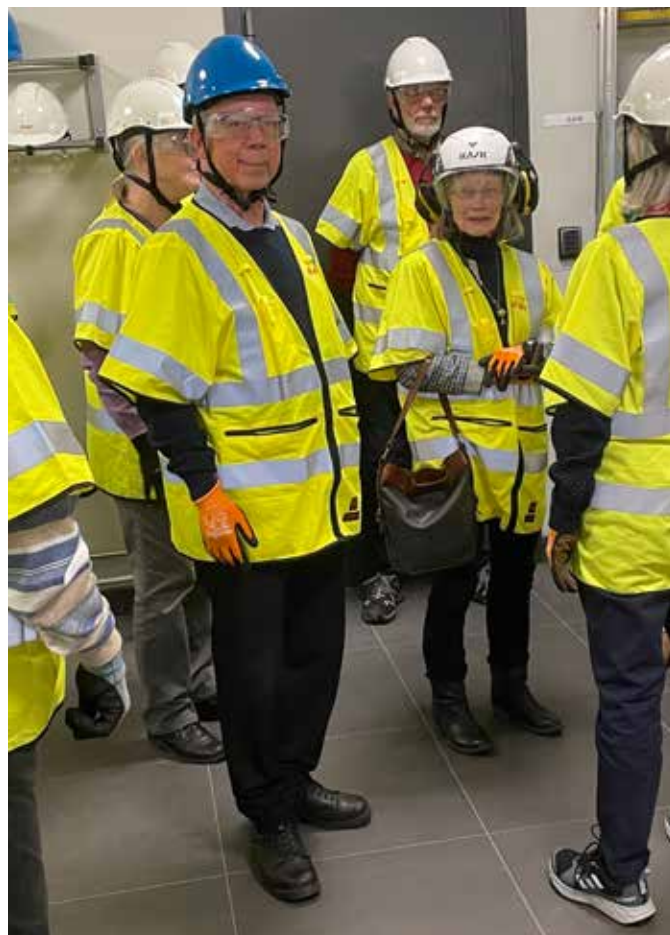
Rundvandring hos Eon.