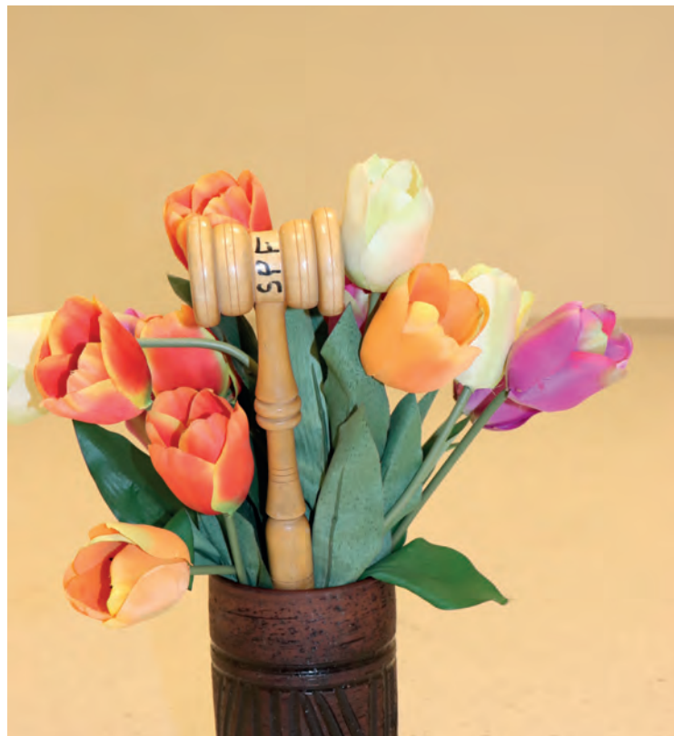
Omslagsbilden: Årsmöte 2023