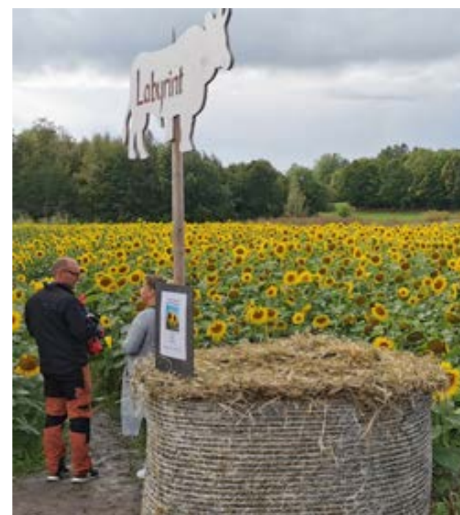
Omslagsbilden: Skördefest på Åland.