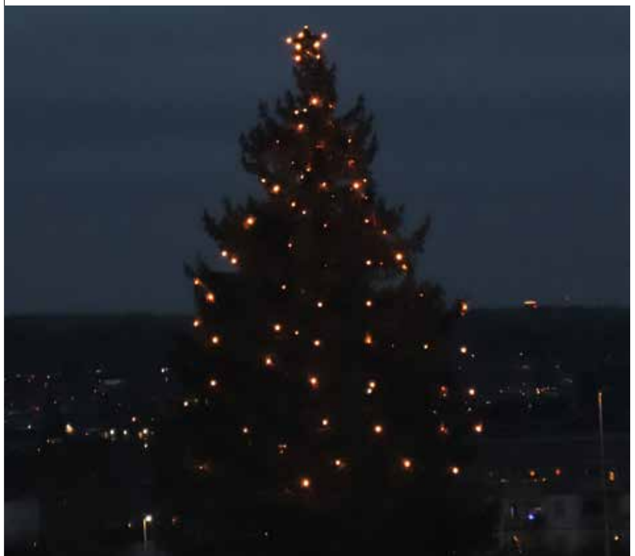
Omslagsbilden: Julgran Centrumbacken