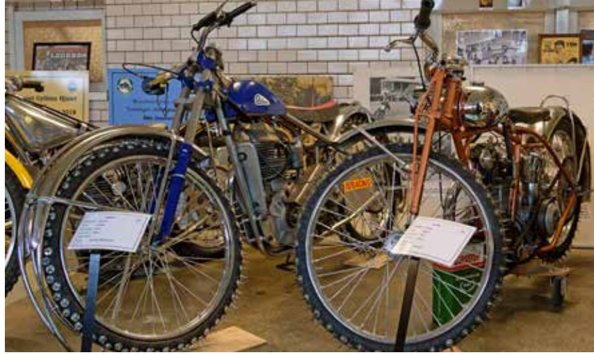
Isracers. Med långa livsfarliga isdubb.

Mätta och belåtna var det bara att ge sig ut dimman igen för hemfärden.