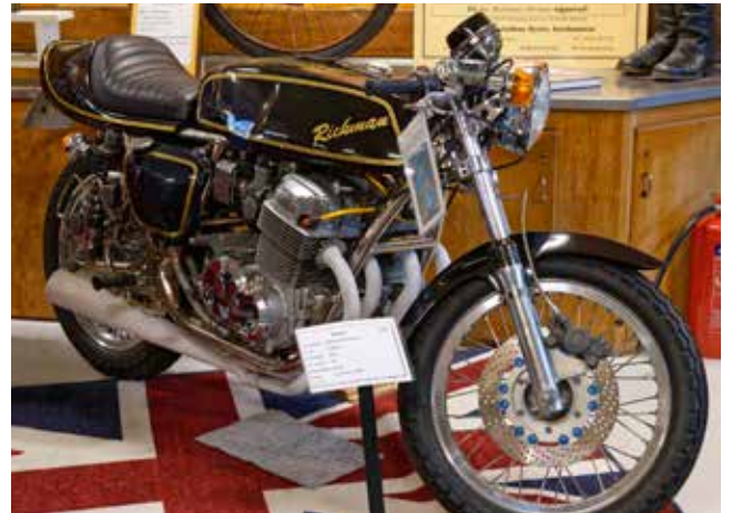
En fyrcylindrig motor, på tvären i ramen, här en Rickman-Honda 750cc 1976.