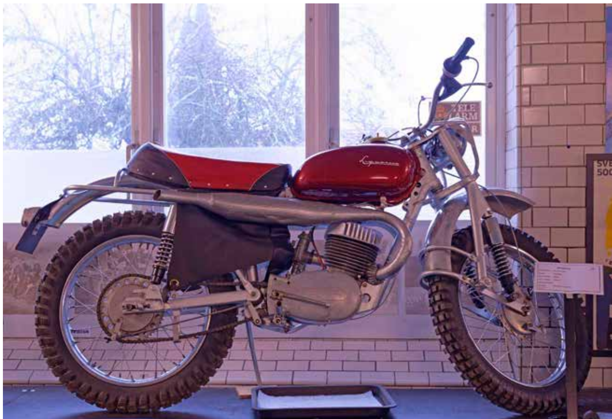
Husqvarna Silverpilen. Många 16-åringars dröm. Tillver- kad 1961.