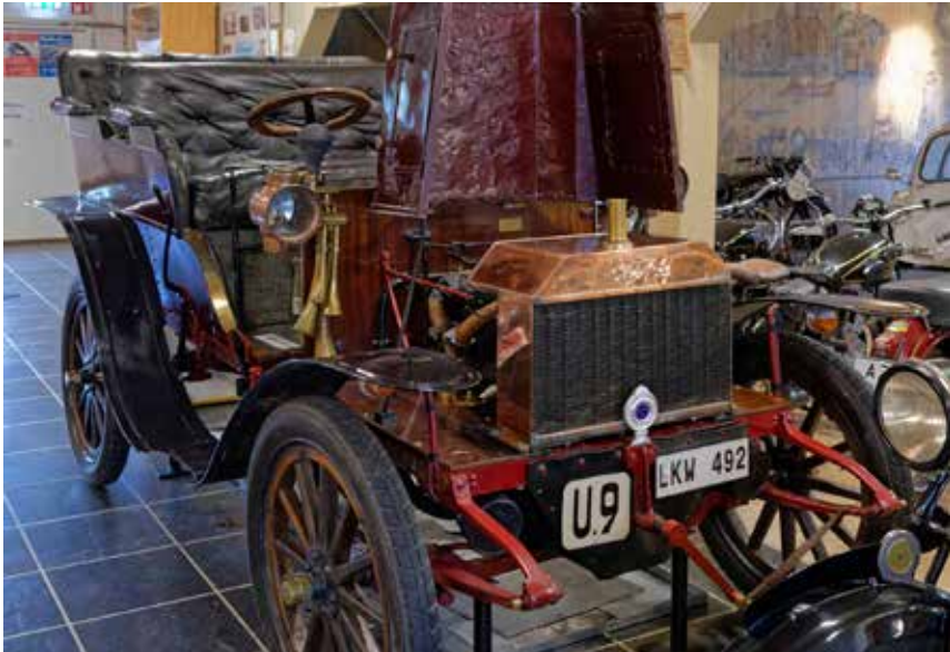
Vabis första serietillverkade automobil 1903, replika.