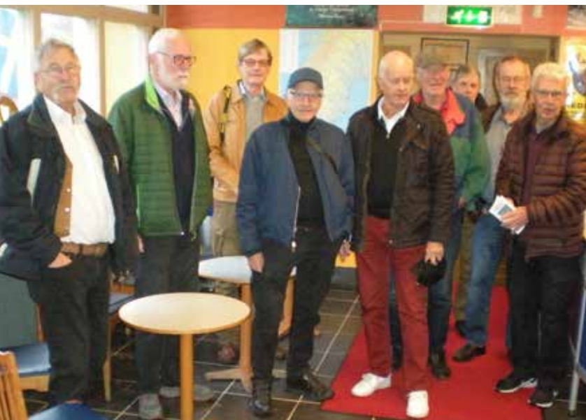
Vi som var med.