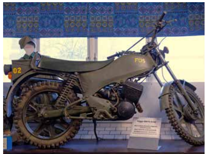
Ett exempel på militärmotorcyklarna. Här Häggo XM74 prototyp 1974.