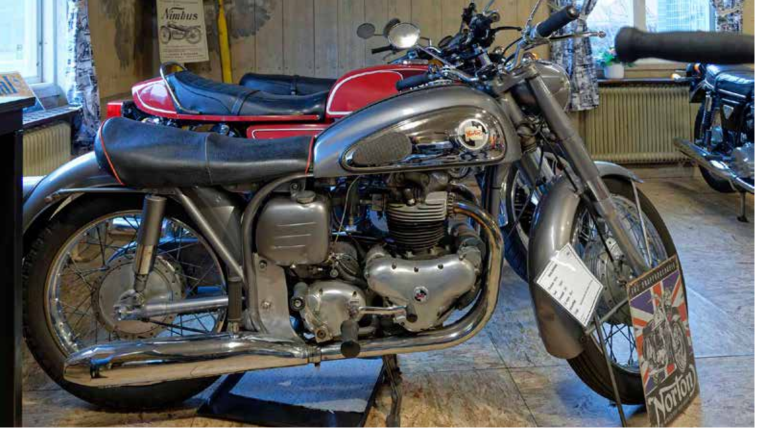
Ett fint exempel på vad britterna kunde bygga. Norton Dominator 600cc 1957.