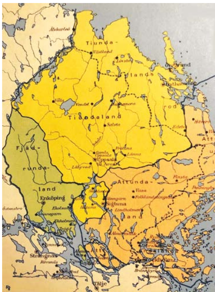
De svenska folklanden i Uppland. Roden är kustområdet till höger om den streckade linjen på kartan. (Svenska skolmaterieförlaget).

Vi fortsätter i Uppland med den gamla indelningen i så kallade folkland. Folklanden var Fjädrundaland (det skrevs så då) i sydväst, Tiundaland – från Håbo härad i söder till Tierps härad i norr – och sydost därom Attundaland (se kartan). Av namnen framgår hur många hundaren varje folkland omfattade. Tiundaland bestod t.ex. av tio hundaren. Ett hundare, var ett rättsligt förvaltningsområde som skulle ansvara för en trupp på hundra man. Ordet utgår från det germanska hund i betydelsen hundra.