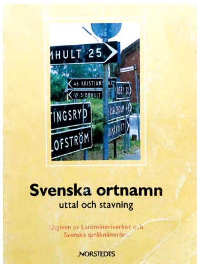
Svenska ortnamn – uttal och stavning.

I de här artiklarna har jag skrivit om gamla ortnamn . Men hur är det vid bildandet av nya ortnamn ? När det gäller namnbildningen i dag ska stat och kommuner följa föreskrifter i kulturmiljölagen, som beskriver god ortnamnsred, vilket bl.a. innebär att ”vedertagna språkliga regler ska följas”. Det gäller alltså att vara noggrann vid namngivningen av platser för att få dem godkända av Lantmäteriet. Det finns även skrifter/handböcker till hjälp, där det tydligt förklaras hur man ska tolka lagen. Riksantikvarieämbetet har en intressant hemsida, där man kan läsa mer om detta.