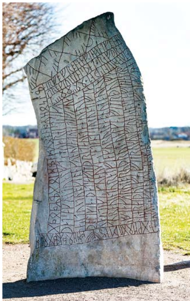
Den höga Rökstenen från 800-talet med Sveriges/världens längsta runinskrift, ristad på alla sidor av stenen.

Sedan ett par platser som fått sina namn på ett annorlunda sätt. I Kosta har samhället vuxit upp kring glasbruket. Namnet består av de första delarna av efternamnen på grundarna (Koskull och Staël von Holstein) som startade verksamheten på 1700-talet.