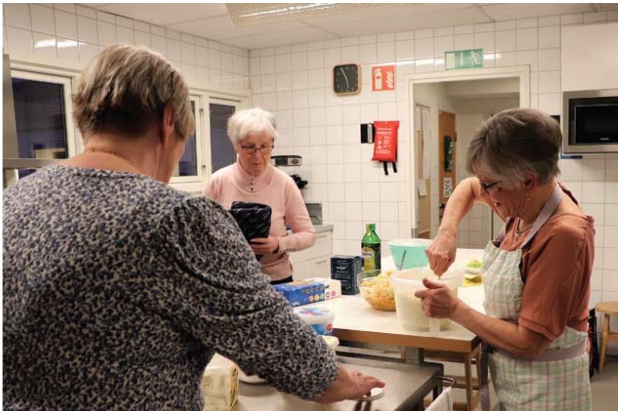
Damerna i köket ska också ha en drös med rosor.