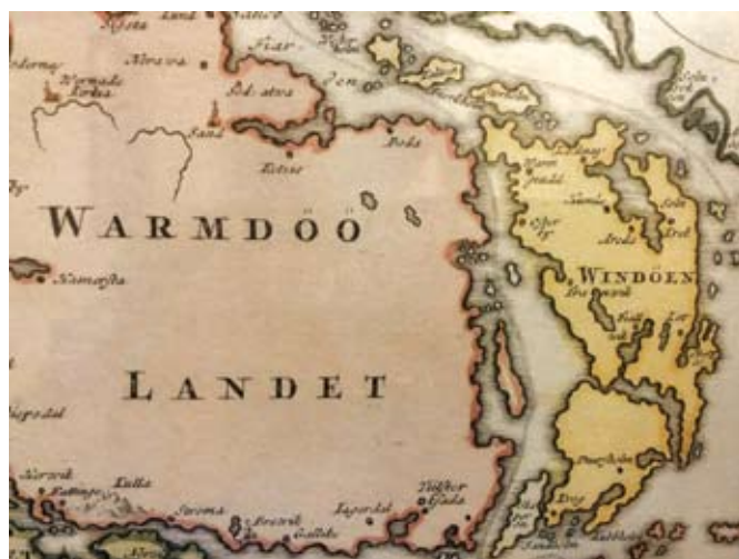
Den norra delen av farvattnet längs Värmdölandet är Vindöström.