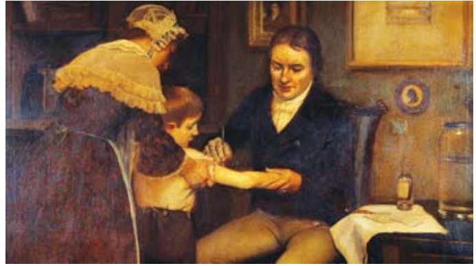
Edvard Jenner utför vaccinbehandling

Jenner gjorde snart hypotesen att den som en gång haft kokoppor kunde inte smittas av den betydligt farligare sjukdomen smittkoppor, eftersom mjölkpigorna som redan haft denna typ av koppor sällan insjuknade av det dödliga smittkoppsviruset.