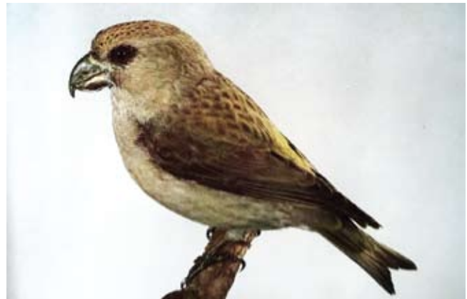
STÖRRE KORSNÄBB, Loxia pytyopsittacus . Nat. Mus. Gbg. (Naturhistoriska Riksmuséet Göteborg.)

Fröna i kottarna är färdigmogna på hösten, för granen tar det ett år och för tallen två år. Vintersolen i solexponerande lägen kan innebära att kottarna öppnas redan under februari-mars och sprids med vinden. Då korsnäbbarna är beroende av fröna för att föda upp sina ungar är det nödvändigt att häckningen sker under dessa kalla vintermånader. Det finns mycket mystik i naturen ett lysande exempel är korsnäbbens häckning anpassad till fodertillgången. Häckning kan även ske något senare. Ungarnas hårdighet i kylan är fenomenal, hårda villkor för de nykläckta ungarna. Honan ligger permanent i boet för värmens skull och hanen får försörja hela ”familjen” med mat. De små fröna i kottarna som ska mätta alla i boet betyder en stor arbetsinsats av hanen.