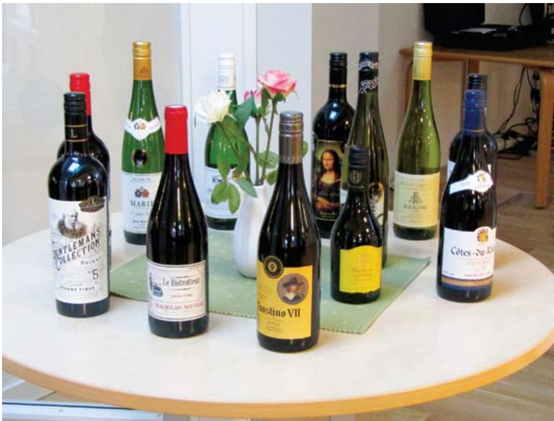
Vinstbordet för de med tur