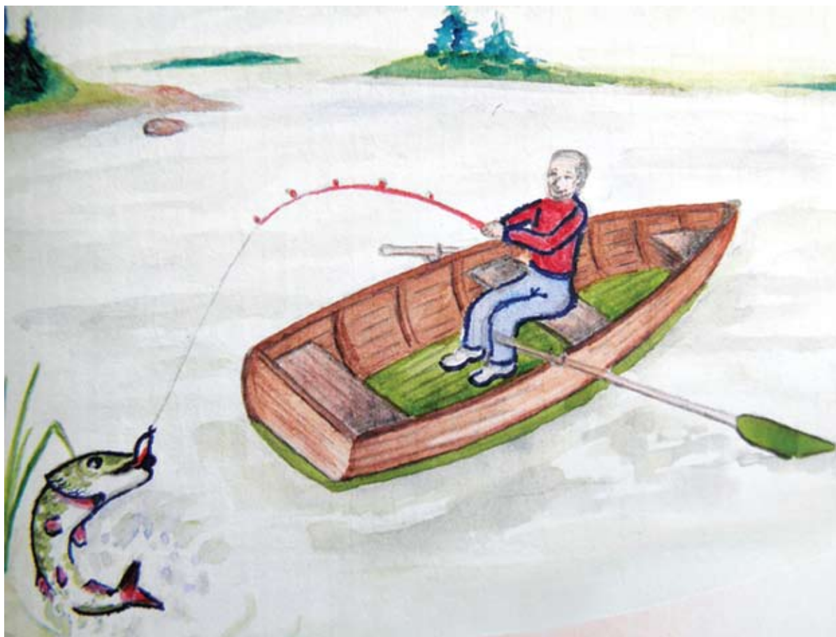
Fiskaren ”Edde” av Arne Due 1971