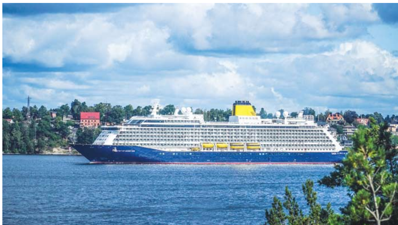
Spirit of Adventure