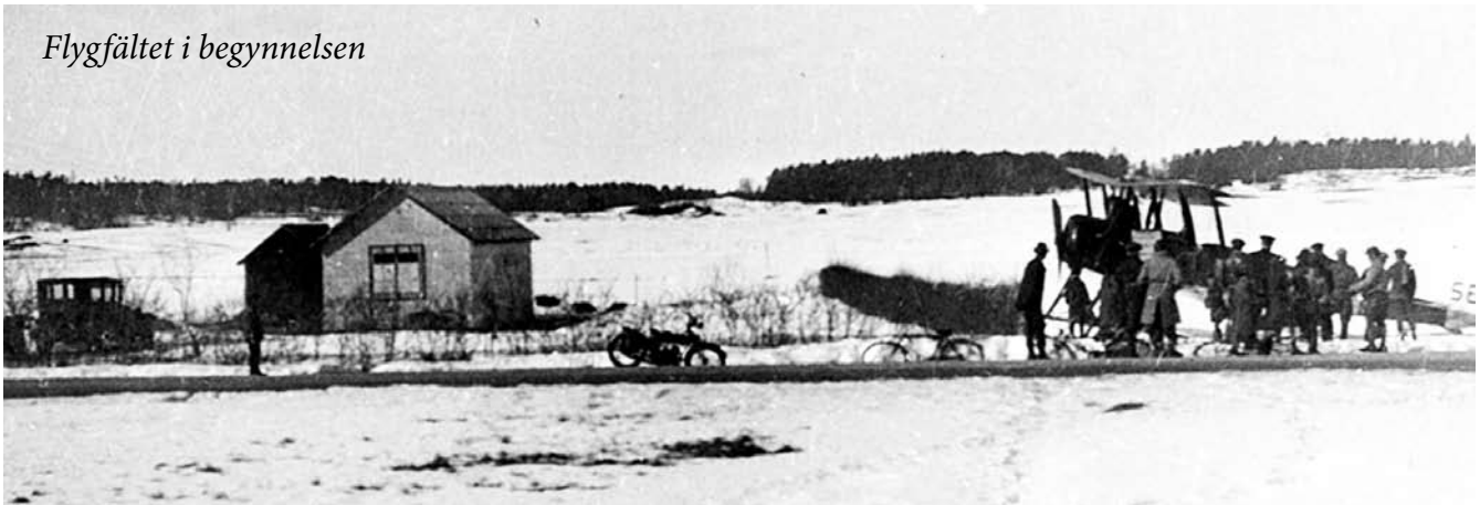
Flygfältet i begynnelsen

Bällstaån flyter fortfarande här under och vidare till Sundbyberg. 1984 kom mycket regn och tunneln under vägen blev ordentligt fyllt med vatten, vilket medförde problem för det 30 tal barn som skulle ta sig till skolan. 1985 byggdes Welcome hotel som även uppfört en nybyggnad på torget för konferens i gammal stil.