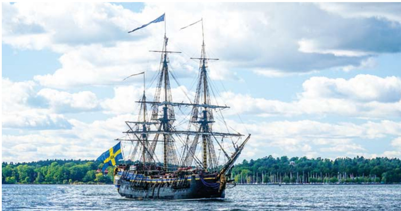
Ostindiefararen Götheborg III