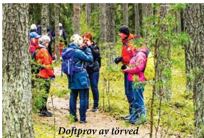
Doftprov av törved