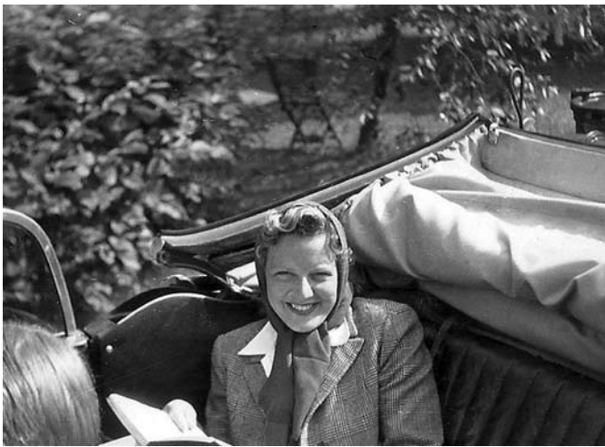
Far och mor på landsbygden år 1939 i sin öppna DKW.

Den första bil jag själv minns var en mörk Citroën, som efter några år lackerades om till ljusbeige. Jag kommer ihåg när pappa kom hem en kväll i början av 50-talet med den nylackerade bilen.