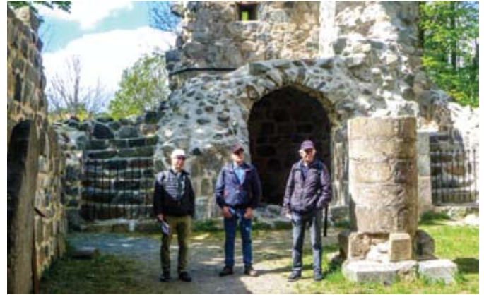
Byggnadsverk i Sigtuna