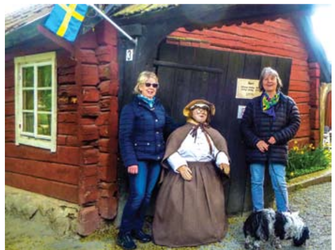
Tant Brun fiket