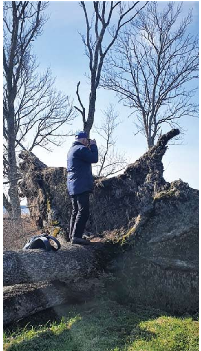
Foto på fotografen