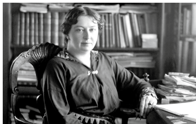
Sigrid Undset, norsk nobelpristagare i litteratur 1928.

Sigrid Undset visade starkt engagemang mot nazismen och var tvungen att under kriget fly till USA via Sverige.