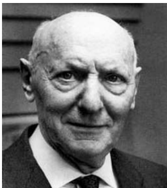
Isaac Bashevis Singer, Nobelpristagaren som skrev på jiddisch.

De nordiska språken tillhör den germanska språkgruppen tillsammans med engelska, tyska, nederländska och frisiska. I gruppen ingår även jiddisch och afrikaans. Jiddisch räknas som ett germanskt språk med tysk bas, uppblandat med några andra språk, bland annat hebreiska. Skriften är också hebreisk. Jiddisch är ett vanligt språk bland den judiska befolkningen i olika länder. Författaren Isaac Bashevis Singer, som fick Nobelpriset i litteratur år 1978, skrev sina böcker på detta språk. Afrikaans är ett av flera officiella språk i framför allt Sydafrika, och har sitt ursprung i de nederländska kolonistörernas språk.