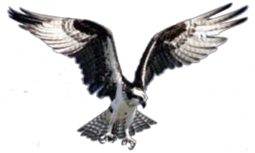
Fiskljuse från Wikipedia som hann med.