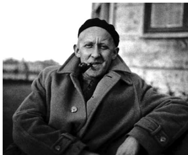
Halldór Laxness, isländsk nobelpristagare i litteratur år 1955.

I maj 2019 deltog vi i en uppskattad Håbo SPF-resa till Island, där gruppen besökte såväl Halldór Laxness villa, som Snorri Sturlusons (isländsk staving) herrgård Reykholt, där Snorri av politiska skäl blev dödad år 1241.