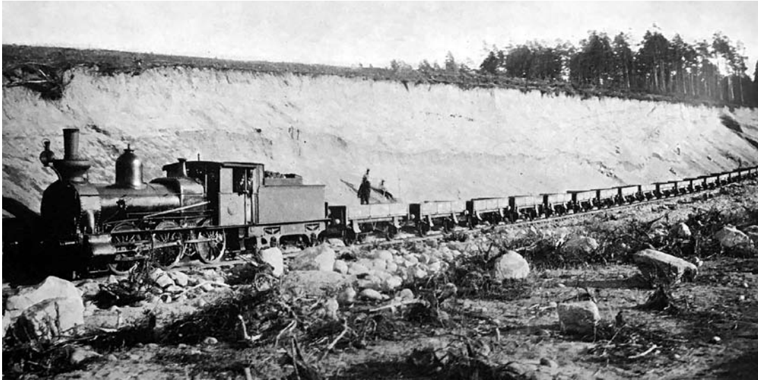
Stockholm – Västerås – Bergslagen 1909

Från ”Stockholm-Westerås-Bergslagens jernvägar” av Rune Ekegren, Leif Dahl & Erik Sundström