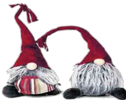
Julhälsningar från Medlemskommittén

Medlemskortet för år 2021 kommer att finnas i Senioren nummer 2.