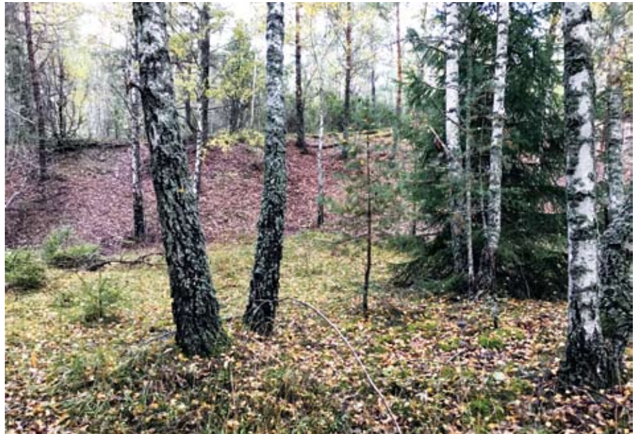
Den gamla gropen

Från ”Stockholm-Westerås-Bergslagens jernvägar” av Rune Ekegren, Leif Dahl & Erik Sundström