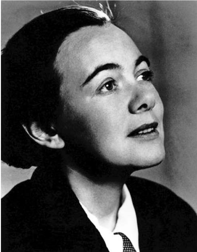
Karin Boye, 1900-1941

Ett par kvinnliga poeter, som ofta citeras är Karin Boye och Edith Södergran. Båda två hann skapa mycket poesi under sina korta liv. Boyes ”Ja visst gör det ont när knoppar brister. / Varför skulle annars våren tveka?” från hennes diktsamling För trädets skull , känner vi alla till.