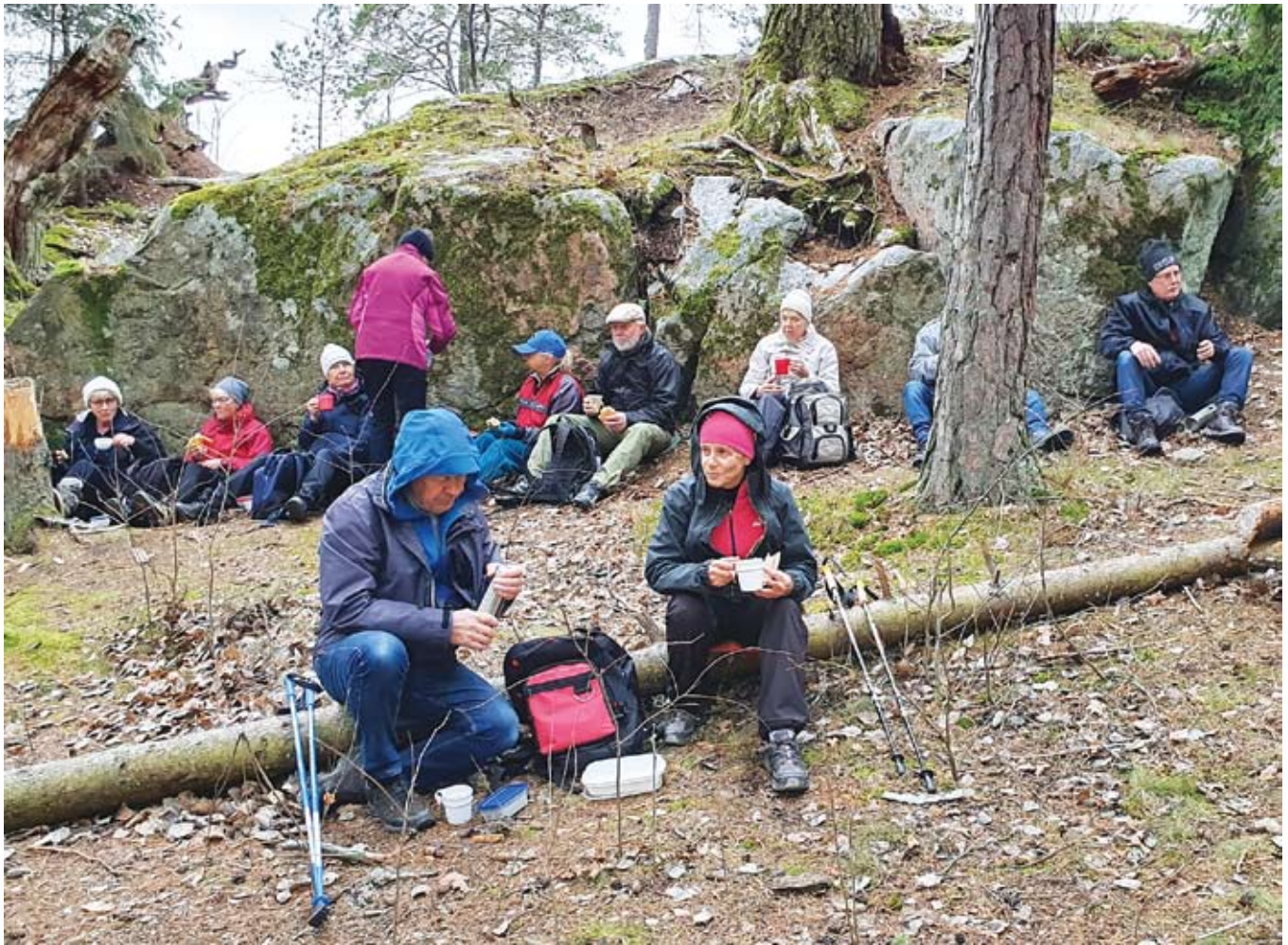
Dags för vårt medhavda