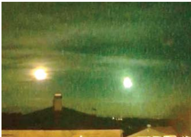
Månen och den gröna boliden på väg mot Fjärdhundra

Då hördes plötsligt en kraftig explosion och ett starkt grön-aktigt sken lyste upp vårt lilla samhälle. Min första tanke var att det troligen var militären som lekte med våra surt förvärvade skattepengar, men när jag gick ut på baksidan av huset och hörde det annorlunda ljudet var det något som inte stämde.