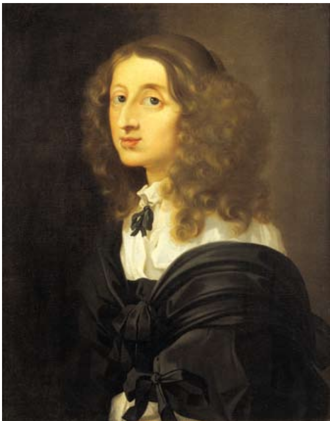
Drottning Kristina, målad av Sébastien Bourdon (Nationalmuseum).

En senare medlem av Vasaätten som lämnat många välformulerade fraser efter sig är drottning Kristina: Man bör säga sanningen, men alla sanningar böra inte sägas och Passionerna äro livets salt.