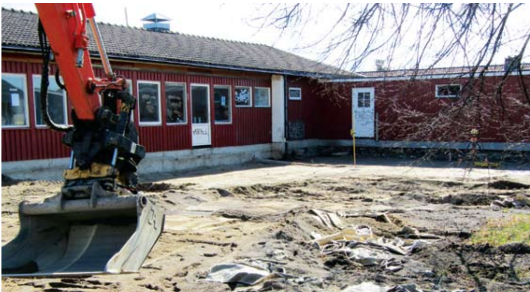
Snart dags för gjutning