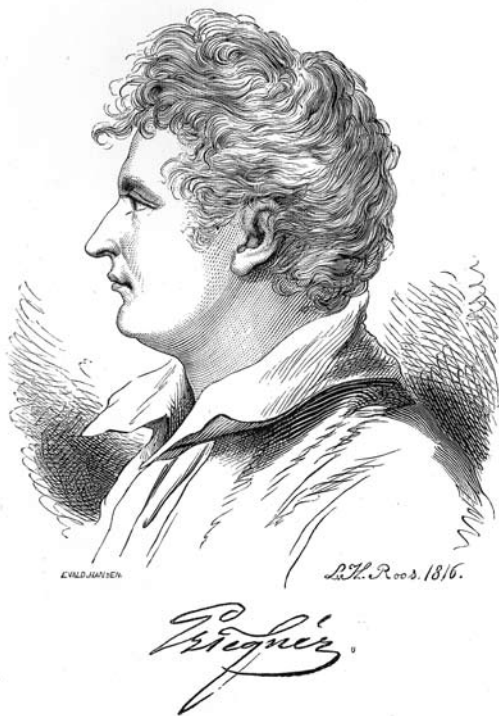
Esaias Tegnér, tecknad av Leonard Roos af Hjelmssäter.

Citatet ovan inleder den sista strofen i Esaias Tegnér's dikt Språken från 1817. I dikten kommenterar han flera europeiska språk, och i den sista strofen hyllar han det svenska språket men fortsätter med uppmaningen: ”Tvätta det främmande smink”, alltså tvätta bort lånorden från vårt språk. Naturligtvis är han påverkad av de götiska, nationalromantiska strömningarna i landet då. Intressant är att nästan samtliga ord i citatet är just lånord, av tyskt ursprung. Ära och hjälte till exempel motsvarar (die) Ehre och (der) Held i dagens tyska. Många tyska ord hade ju funnits i svenskan sedan medeltiden och inlemmats väl i språket. Men man reagerade sannolikt starkare mot nya, ”mer främmande”, ord. Det tyska språket ligger ju ganska nära svenskan.