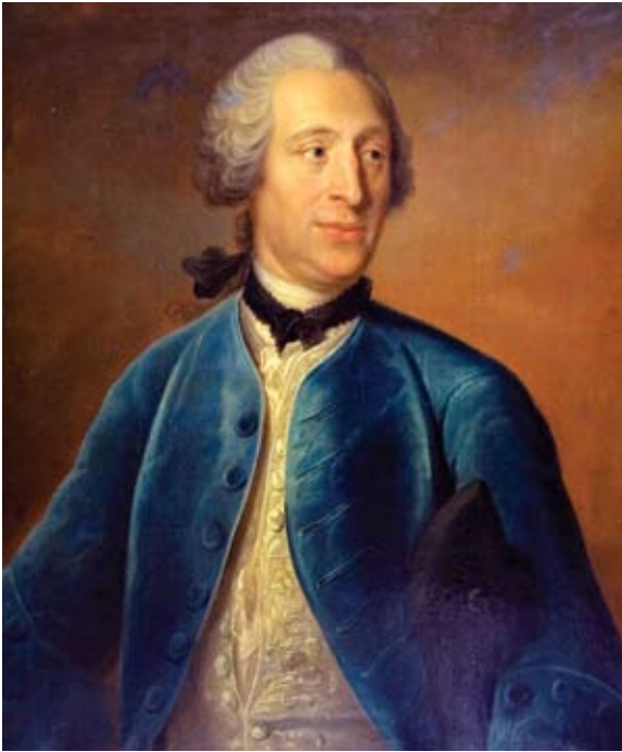
Olof von Dalin, målad av Johan Henrik Scheffel.

Författarna Georg Stiernhielm på 1600-talet och Viktor Rydberg på 1800-talet kämpade också för att rensa språket. Men trots att många försökt bromsa utvecklingen har vi inte kunnat undvika att under årens lopp berika vårt språk med utländska lån.