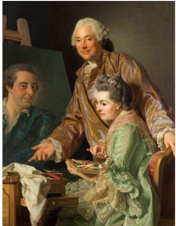
1700-talsidyll. Självportätt av Alexander Roslin med hustrun i centrum.

Det var lån direkt från, eller via, franskan såsom salong, frisyr, fåtölj, roll, ridå, gravyr, karikatyr, roman, glass och likör.