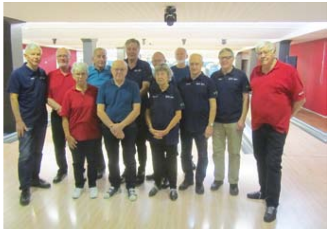
Spelarna i omgång 2.

Innan start av omg 2 kunde Bo komplettera sin information med högsta resultat i första omgången. Gilberth hade fått ihop 795p. Dagens vinnare?