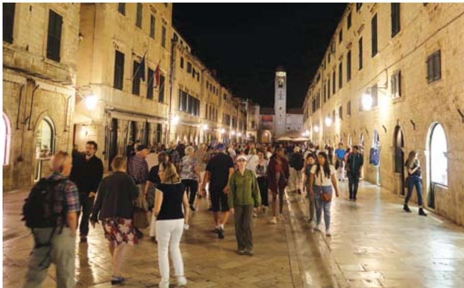
Stradun i Dubrovnik