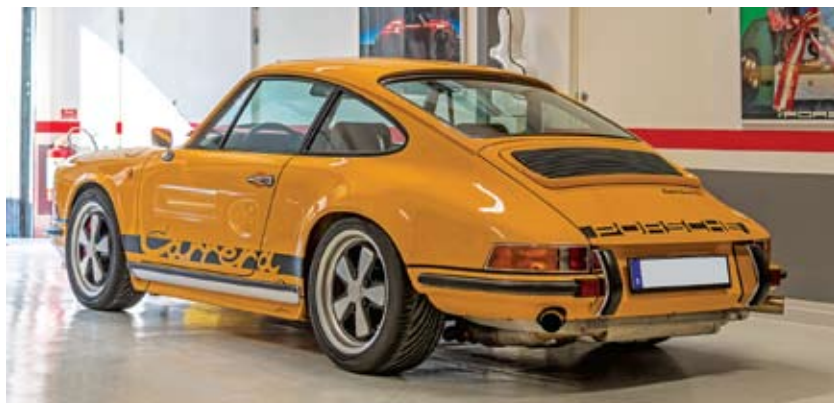
Porsche 964 Carrera 4 1990 hot rod 'J Bonnier Tribute'