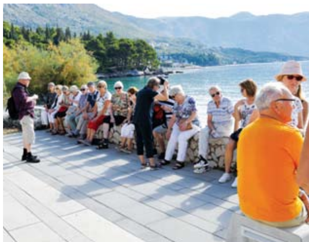
På väg till Srebreno