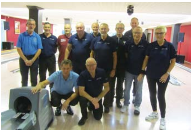
Spelarna i omgång 1.

36 anmälda spelare innebar 3 fulla omgångar. Bosse hälsade klockan 10 de morgonpigga spelarna i Omg 1 välkomna till årets DM och informerade om att vi spelar 4 serier Europeiskt spel, dvs. flytt en bana åt höger efter varje färdigspelad serie. Åldershandicapet innebär att spelare som är 65 år i år har 0 i hcp, 66 år i år har 1 i hcp/serie osv.