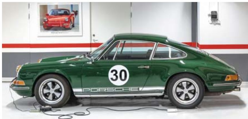
Porsche 911 1988 bakdaterad