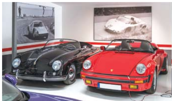
3 Porsche 356 1600 Speedster 1958. 911 3,2 bred Speedster 1989.