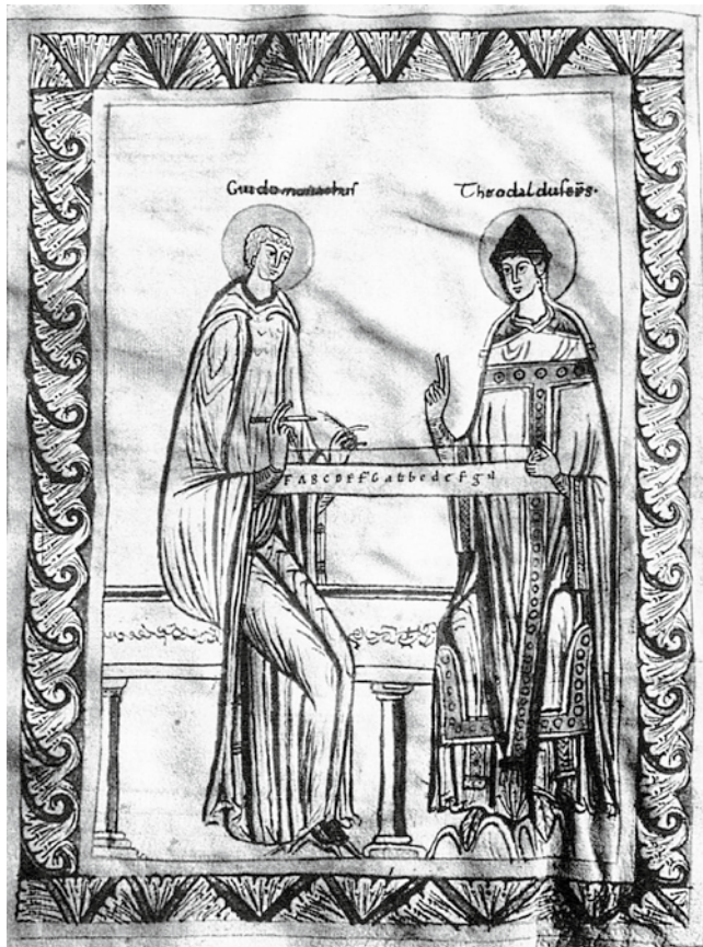
Biskop Theodal och Guido av Arezzo vid ett monokord. Medeltida miniatyrmålning från 1100-talet.