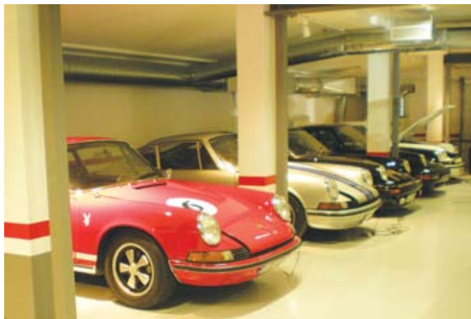
Här står godbitarna i rad.

För något år sedan var vi ett gäng från ”SPF/våra fordon” och besökte den här privata samlingen. Även nu som förra gången, var det genom herr Ömans kontakter som möjliggjorde att vi fick se samlingen. Denna gång, jämfört med förra besöket, ville ägaren själv vara med och berätta om sina bilar.