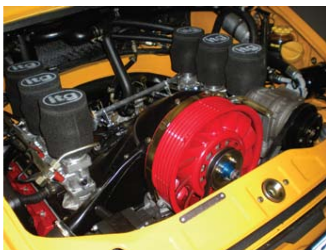
Maskinrummet på Porsche 964 Carrera 4