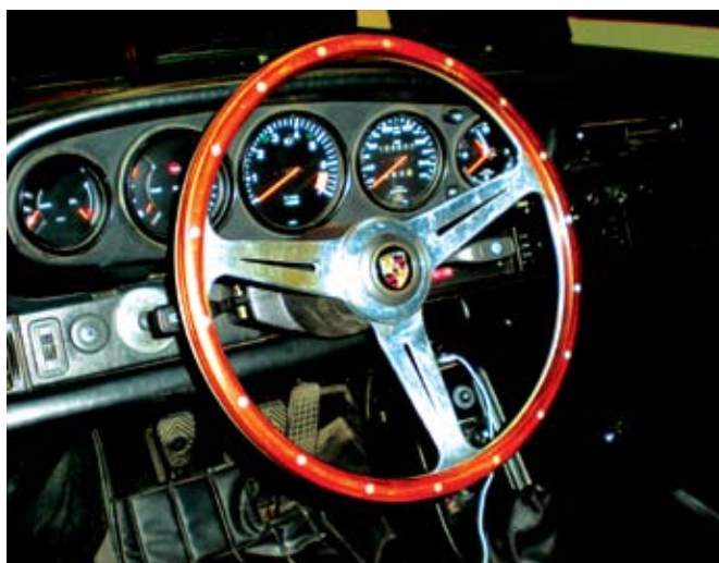
Interiören i Porsche 911 1988