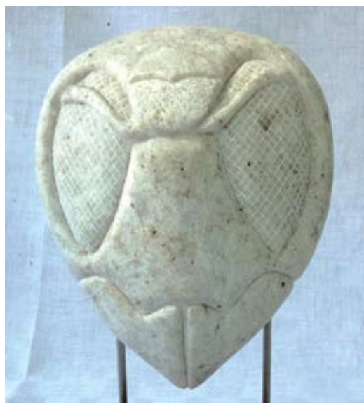
Bålgetinghuvud i marmor. Bernt Eriksson.