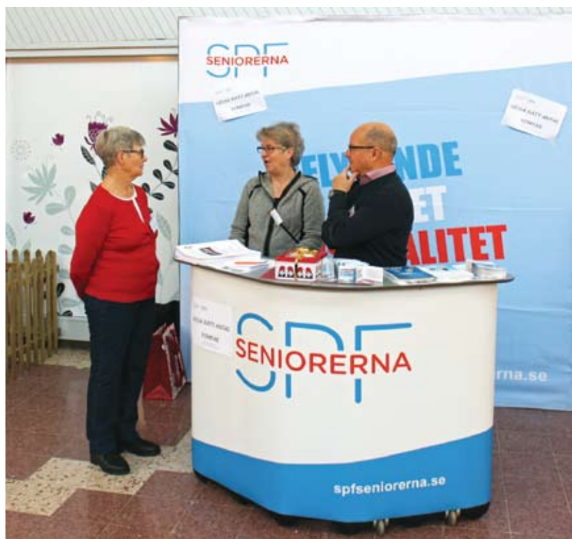
SPF Seniorerna i Centrum

Välkomna önskar Marknads- och Medlemskommittén!