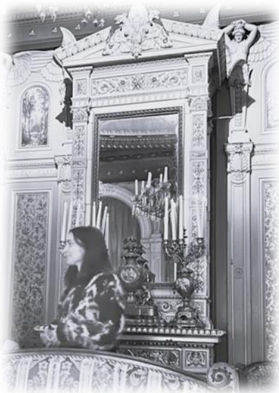
Vår guide framför den pampiga kachelugnen