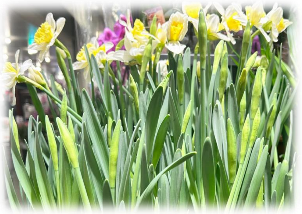
Narcisser hos Bloms Blommor

Fira Grindslanten 40 år den 6 maj i S:t Larsgården!