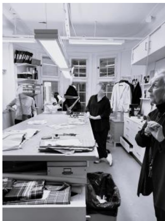
Vår entusiastiska guide visar skrädderiet