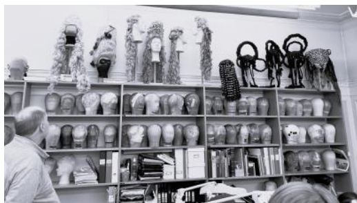
En del av lagret med perukstockar

Var tillverkas Dramatens kostymer – och vem har som jobb att smutsa ner dem när det behövs? + mycket mer.