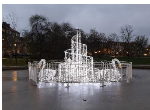
'Svanar' i Svandammsparken, Midsommarkransen.

Manuskript till februarinumret senast 21 januari 2022 Hämtning och distribution av februarinumret 31 januari 2022.