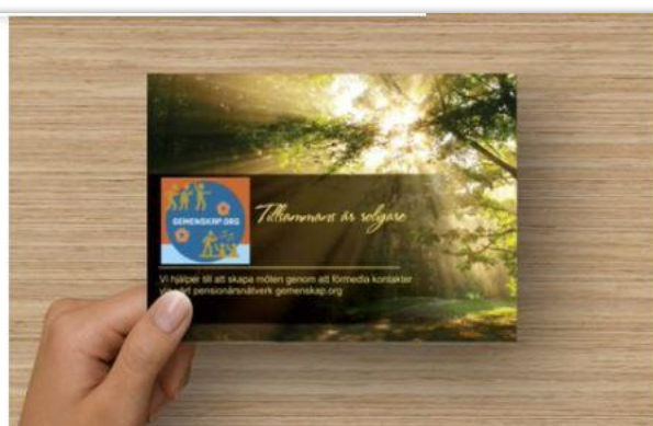
Vykort vår-sommar-höst hälsning