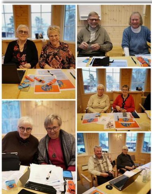
Lokala arbetsgrupper på workshop i Eksjö.