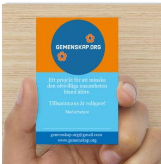
Medarbetarkort framsida med plats för att skriva sitt namn

Vykort, broschyrer och affischer har tagits fram och delats ut vid olika workshopträffar och för att kunna beställas digitalt har de även lagts upp på hemsidan www.gemenskap.org .