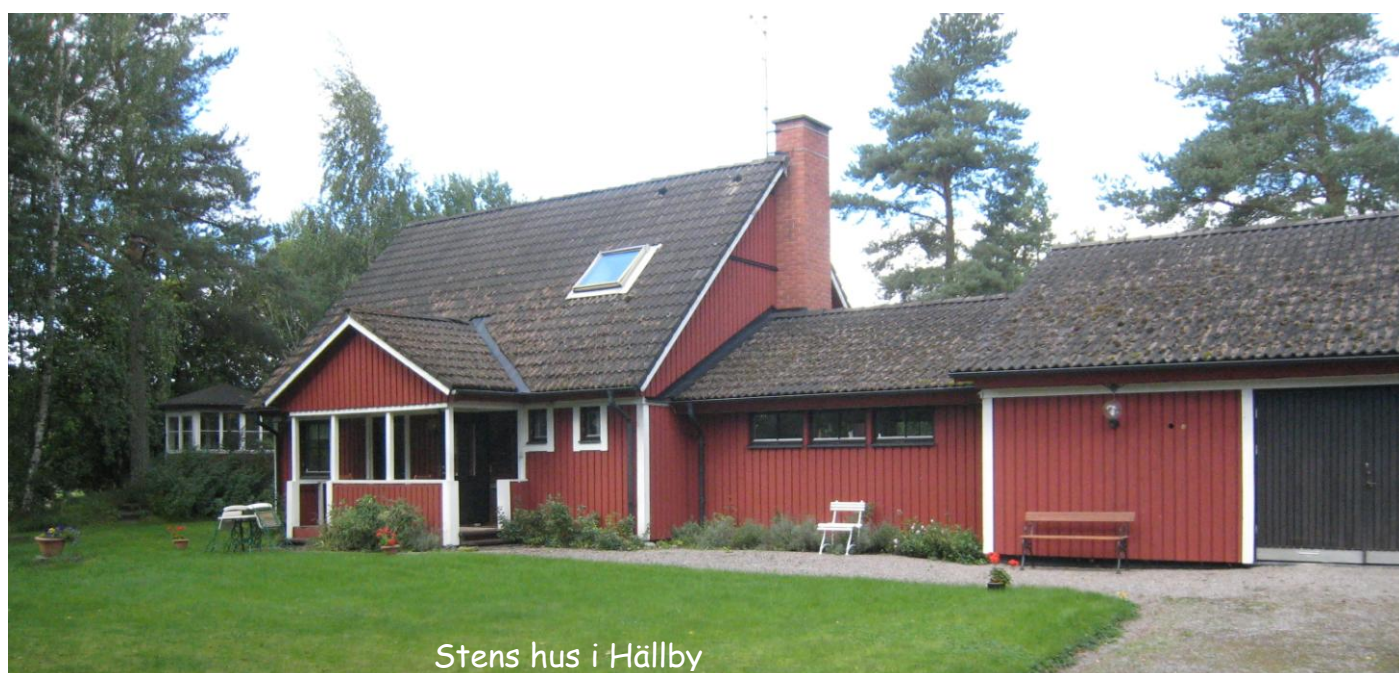
Stens hus i Hällby