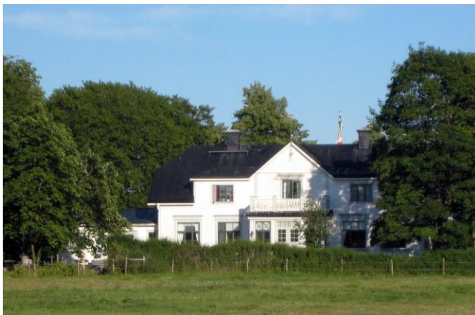
Nyckelby gård idag

År 1950 avslutade han sin militära karriär och började praktisera på Vappa gård utanför Enköping. Gården ägdes av en gammal skolkamrat och blev även familjens bostad under en tid. Efter ett år på gården började han studera vid en numera nedlagd lantbruksskola nära Strängnäs.