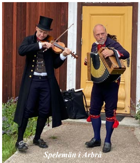
Spelemän i Arbrå

För den som finslipat sin hamboteknik något mer än genomsnittet, finns utmaningen Hälsingehambon, där man en dag per sommar kan mäta