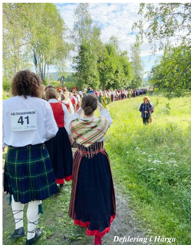
Defilering i Hårga

Och en så'n tur att det aldrig är för sent för en för-första-gången-fäbodfrukost i Hårga. Långbord står uppdukade på gårdstunet kl. 06.30 med god marginal för defileringen till slätterängen kl. 08.00. Med facit i hand påstår jag att denna underbart vackra hälsingegård i arla solig morgonstund, gjorde hela min dag. Jag behövde ingen dans. Jag hade varit fullkomligt nöjd att lämnas kvar där på hälsingetunet med gröt och färskost.