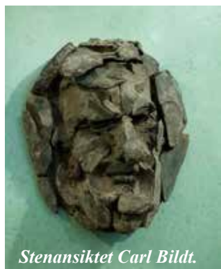
Stenansiktet Carl Bildt.

Att besöka riksdagshuset kan vara både lärorikt och en spännande upplevelse att få vandra i denna kulturhistoriska byggnad tyckte 20 kulturvandrare. Så det blev pendeln in till stan och vandring till Helgeandsholmen.