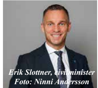
Erik Slottner, civilminister

Eriks Slottner styrde äldreomsorgen i Stockholm, nu är han boss över alla kommuner. Erik är född 1980 i Kalmar, pol.mag. i Linköping, aktiv inom KD. Han var äldre- och trygghetsborgarråd i Stockholm 2018–2022. Sedan oktober 2022 civilminister.