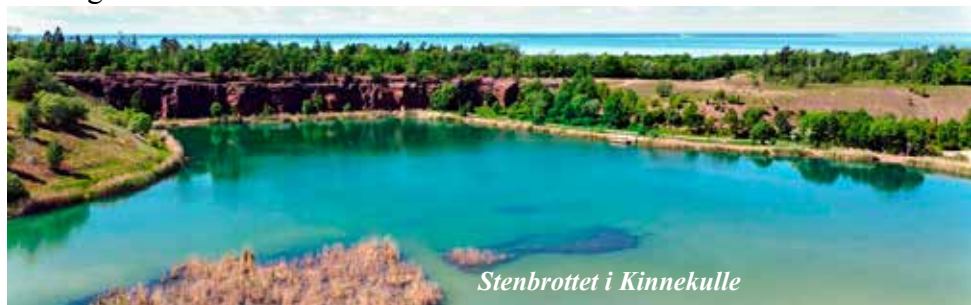
Stenbrottet i Kinnekulle

Nils Ericsson. Vi intar lunch under färden. Vid 16-tiden anländer vi till Bengtsfors, där bussen möter oss och kör oss till hotellet och den väntande middagen.