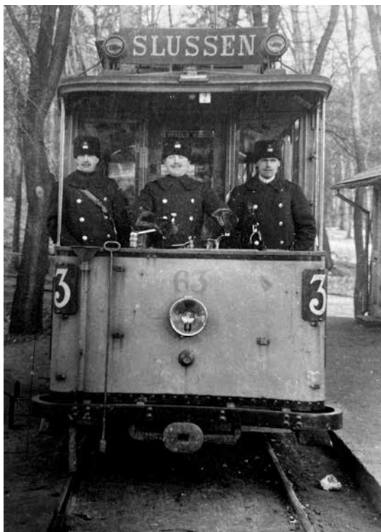
Morfar till vänster i bild.