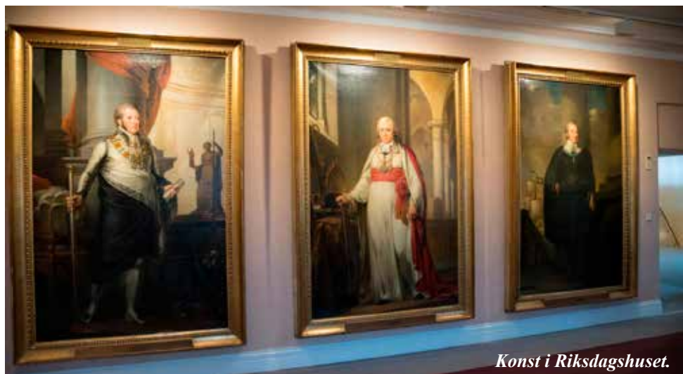
Konst i Riksdagshuset.

Vi fick nu gå nerför den mäktiga trappan till utgången och tacka guiden för att han gett oss en repetition av hur Sverige styrs och lite annat att tänka på. En lunch på närliggande pub avrundade besöket.