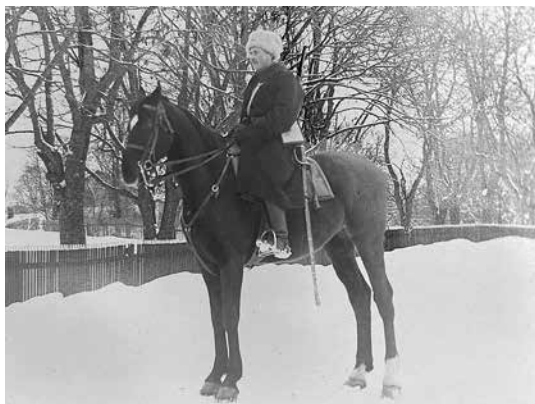
Morfar i sadeln. Året var 2016.