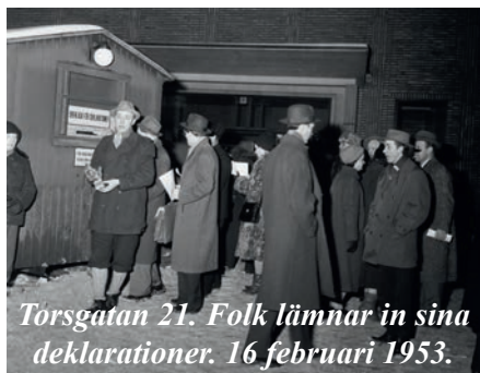
Törsgatan 21. Folk lämnar in sina deklarationer. 16 februari 1953.