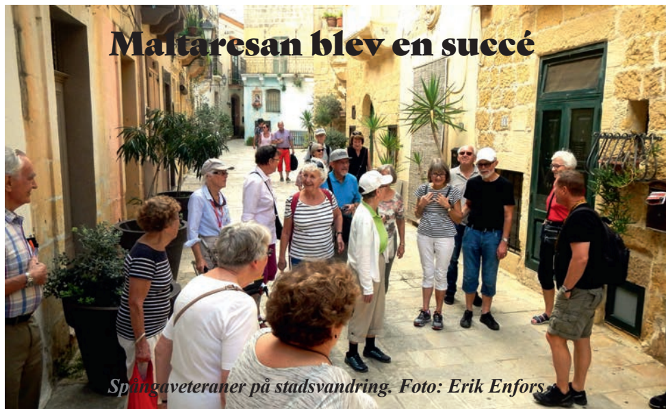
Spångaveteraner på stadsvandring.

Mitt i natten den 15 oktober mellan kl. 4.00–4.30, samlades en skara på drygt 20 Spångaveteraner för att åka abonnerad buss till Arlanda. Planet landade på Malta i rätt tid och vår utmärkte guide Fredrik konstaterade efter snabb räkning att alla var med. Vi for vidare på Malta, Fredrik visade och berättade under restiden och fixade biljetterna till färjan över till Gozo. Vi hamnade så småningom på vårt hotell, St Patricks i Xlendi, där våra resväskor väntade. Hotellet låg precis vid en vik och hade en tältmatsal/altan med tak utanför, där vi serverades middag – trerätters meny med olika val. Trötta gick vi tidigt till sängs eller tog en promenad utefter viken.