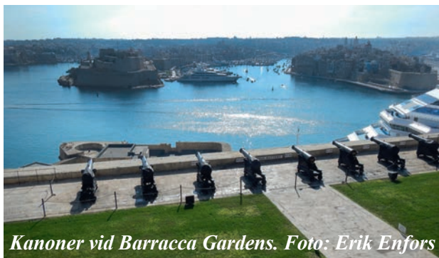
Kanoner vid Barracca Gardens.

Så fortsatte äventyren på Malta, med besök i huvudstaden Valletta. Mycket sevärdheter, mycket riddartid, kyrkor, fartyg, fästningar, mycket folksamlingar och en intressant film om Maltas historia. Dagen därpå