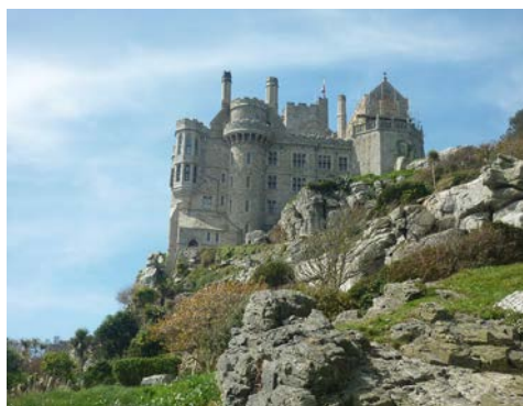
St Michaels Mount

Vänta inte med att anmäla er. För närvarande har vi bara 22 platser, ev. möjlighet att få flera om vi har många anmälningar tidigt!