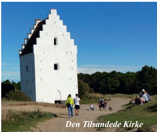
Den Tilsandede Kirke

Skagen Odde Naturcenter besökte vi en eftermiddag där vi i en intressant film fick lära oss hur sanden flyttar och utökar udden så att Skagen bara blir större och större. Där fanns också flera intressanta utställningar och en ovanligt bra pre-