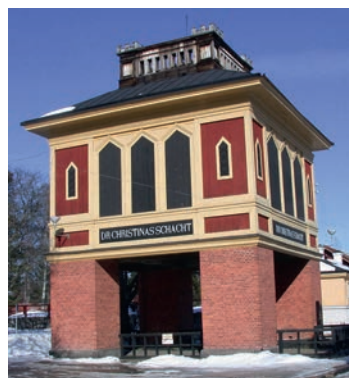
Drottning Christinas schakt

Så är det äntligen dags för lunch och kaffe som intas på Vårdshuset. Efter lunchen finns tid för besök på gruvmuseum och i handelsbodarna. Innan hemfärden åker vi till Aguélimuseet för att ta en titt på Ivan Aguélis konst. Även här finns en liten butik.