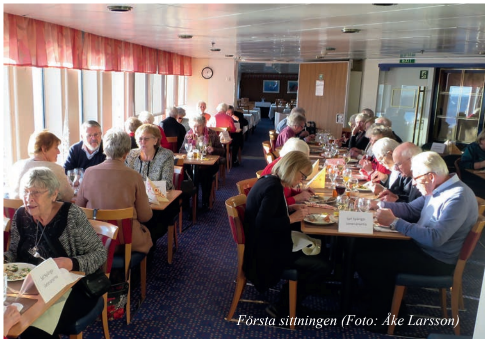
Första sittningen