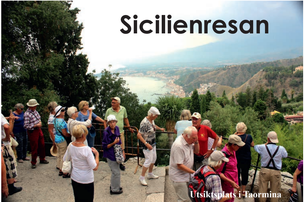
Utsiktsplats i Taormina

Efter en blåsig, regnig och förhållandevis kall sommar här hemma, fick vi några varma sköna veckor i augusti. Och när augusti led mot sitt slut var det dags för 35 Spångaveteraner att flyga till Sicilien – för en bussrundresa. Lördag den 29 augusti kl. 13.30 for vi i abonnerad buss från Spånga Församlingshus till Arlanda. Kommande vecka kom att bli den hetaste vi upplevt, sommaren 2015.