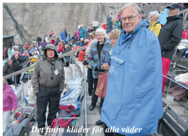
Det finns kläder för alla väder

Efter en god middag på hotellet åkte vi mot Rättvik och Dalhalla. Iklädda värmande fleecetröjor, regnjackor som skydd mot blåsten och gärna vantar och halsduk kom vi fram till Dalhalla. Regnet höll sig borta och