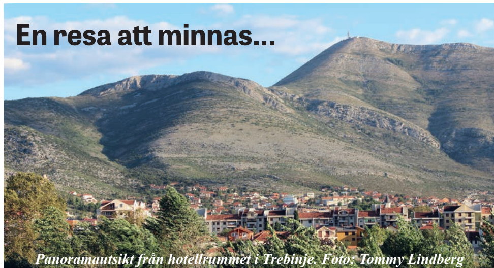
Panoramautsikt från hotellrummet i Trebinje.

Det började med hel-kaos och slutade med halv-kaos, men dessemellan var vi med om de mest fantastiska äventyr både historiskt sett och i våra upplevelser!