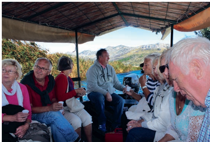
Båtfärd i Neretvadeltat.

I samma stil fortsatte upplevelsorna med guidade turer i slott och palats i Split och Trogir, egen tid i medeltida gränder – och så avslutade vi Makarskadagarna med fisk eller skaldjur på självvald restaurang i gamla stan eller på strandpromenaden.