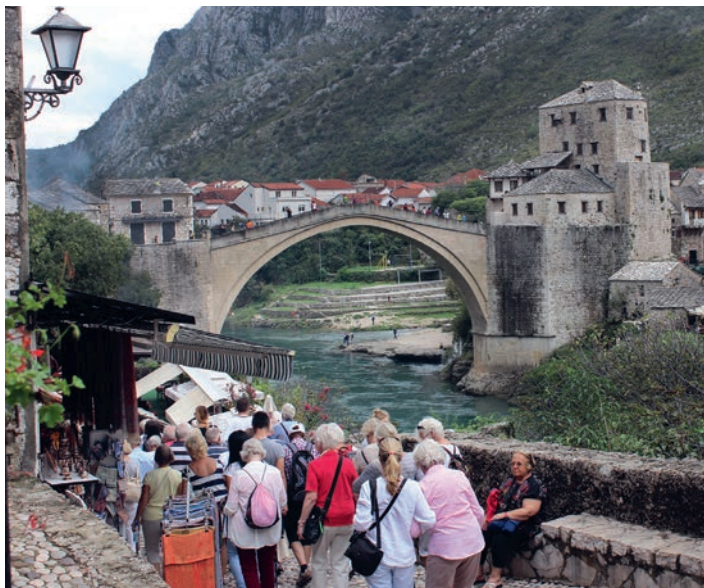
Bron Stari Most.

av manskör. Vi såg och upplevde natur och kultur på många olika platser då vi for vidare genom dalar, upp på höjder, besökte medeltida städer, ”gamla stan”-kärnor, vingårdar, kyrkor, basilikor och moskéer, vi besåg vattenfall och åkte båt på kanaler och dammar. I Trebinje bodde vi på ett litet familjehotell