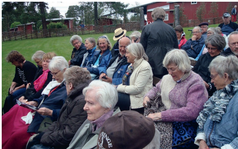
Spångaveteranerna på spelplatsen i Nås.

sina gårdar och utvandrade till det heliga landet. Kvar i Nås blev Ingmar, som fick överge sin käresta och gifta sig med storbondens dotter för att rädda Ingmarsgården kvar i slakten.