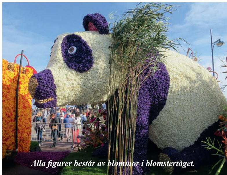
Alla figurer består av blommor i blomstertåget.