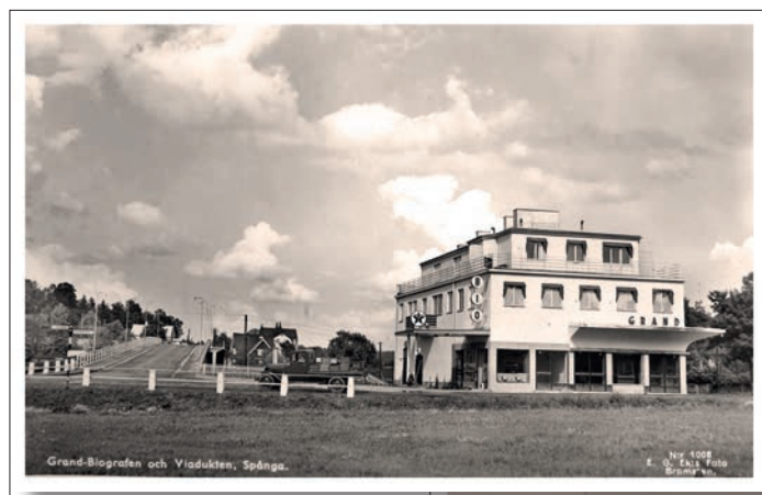
Grand-biografen och viadukten i Spånga.

Max. 20 deltagare per tillfälle. Kaffe serveras till självkostnadspris.