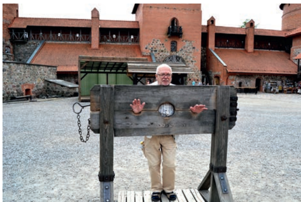
Endast en Spångaveteran åkte fast under resan.

tisdagens lunch besökte vi det berömda slottet i Trakai från 1200-talet. Det var länge säte för landets furstar och ligger väl skyddat på en ö. Under polsk-ryska kriget i mitten på 1600-talet blev det ändå bränt och raserat. Under Stora nordiska kriget i början på 1700-talet blev det ännu en gång raserat. Först på 1960-talet påbörjades återuppbyggnaden och 30 år senare var det klart. Nu är det en av landets största turistattraktioner.