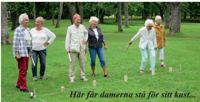
Här får damerna stå för sitt kast...