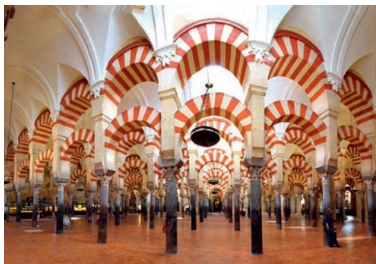
Mezquita-katedralen i Córdoba

Pris 11 990 kr, tillägg för enkelrum 1 600 kr.