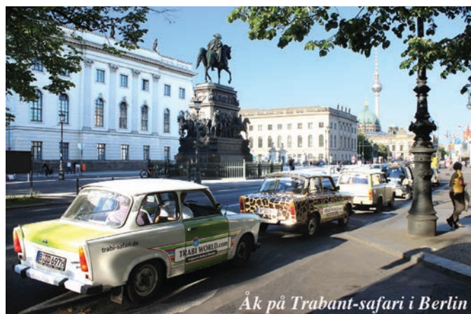
Åk på Trabant-safari i Berlin

fångarna bar. Vilken färg beror på om det var politiska fångar eller andra misshagliga grupper. Till sist gick vi till den plats där Hitlerbunkern legat, men nu totalt utplånad. Sista dagen packning på förmiddagen. Under eftermiddagen gjorde vi en färd upp i TV-tornets glob, 203 m högt, man såg hela