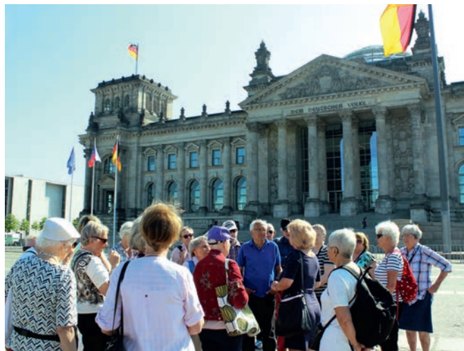
Gruppen framför Riksdagshuset

Nästa dag åkte vi mot regeringsbyggnaderna. På väg dit räddades en kvarglömd kofta från dagen före på en parkbänk. Allmänt jubel. Vi såg minnesstenar från riksdagsledamöter som av olika anledningar inte passat in i nazisystemet. Även Holocaustmonumentet som består av 2711 symboliska gravstenar i betong. Ett vackert monument var också en grund damm med en svart triangelformad sten i mitten som symboliserade de olikfärgade trianglarna som