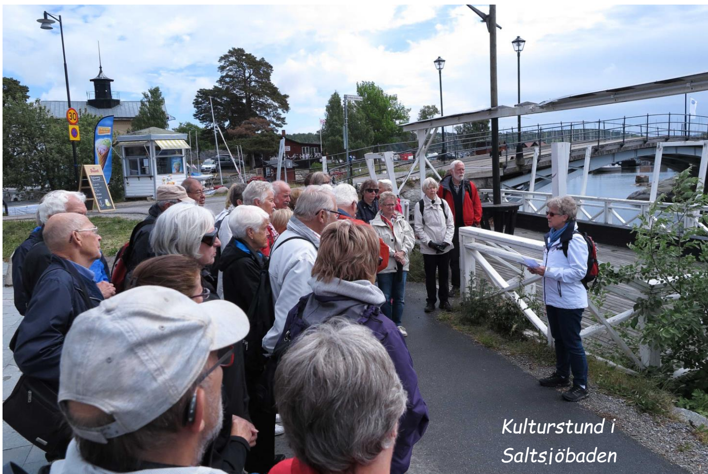
Kulturstund i Saltsjöbaden

Saltsjöbadens historia började med att Knut A. Wallenberg som i slutet av 1800-talet köpte ett stort markområde för att anlägga ett rekreationssamhälle för den moderna människan. Hit sökte sig många konstnärer och andra kulturpersonligheter och naturligtvis bank- och industrifolk. Samtidigt byggdes Grand Hôtel Saltsjöbaden som en samlingsplats för affärsmän, industrimän och diplomater.