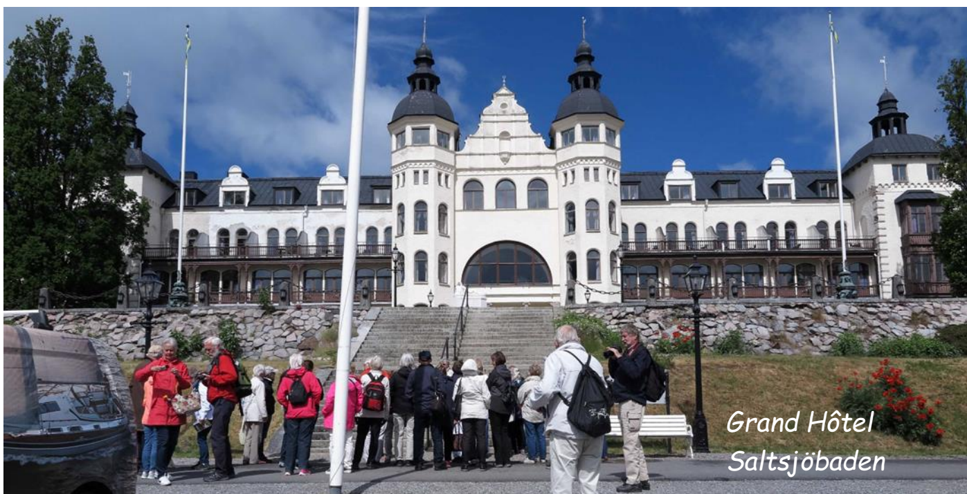
Grand Hôtel Saltsjöbaden

Saltsjöbadens historia började med att Knut A. Wallenberg som i slutet av 1800-talet köpte ett stort markområde för att anlägga ett rekreationssamhälle för den moderna människan. Hit sökte sig många konstnärer och andra kulturpersonligheter och naturligtvis bank- och industrifolk. Samtidigt byggdes Grand Hôtel Saltsjöbaden som en samlingsplats för affärsmän, industrimän och diplomater.