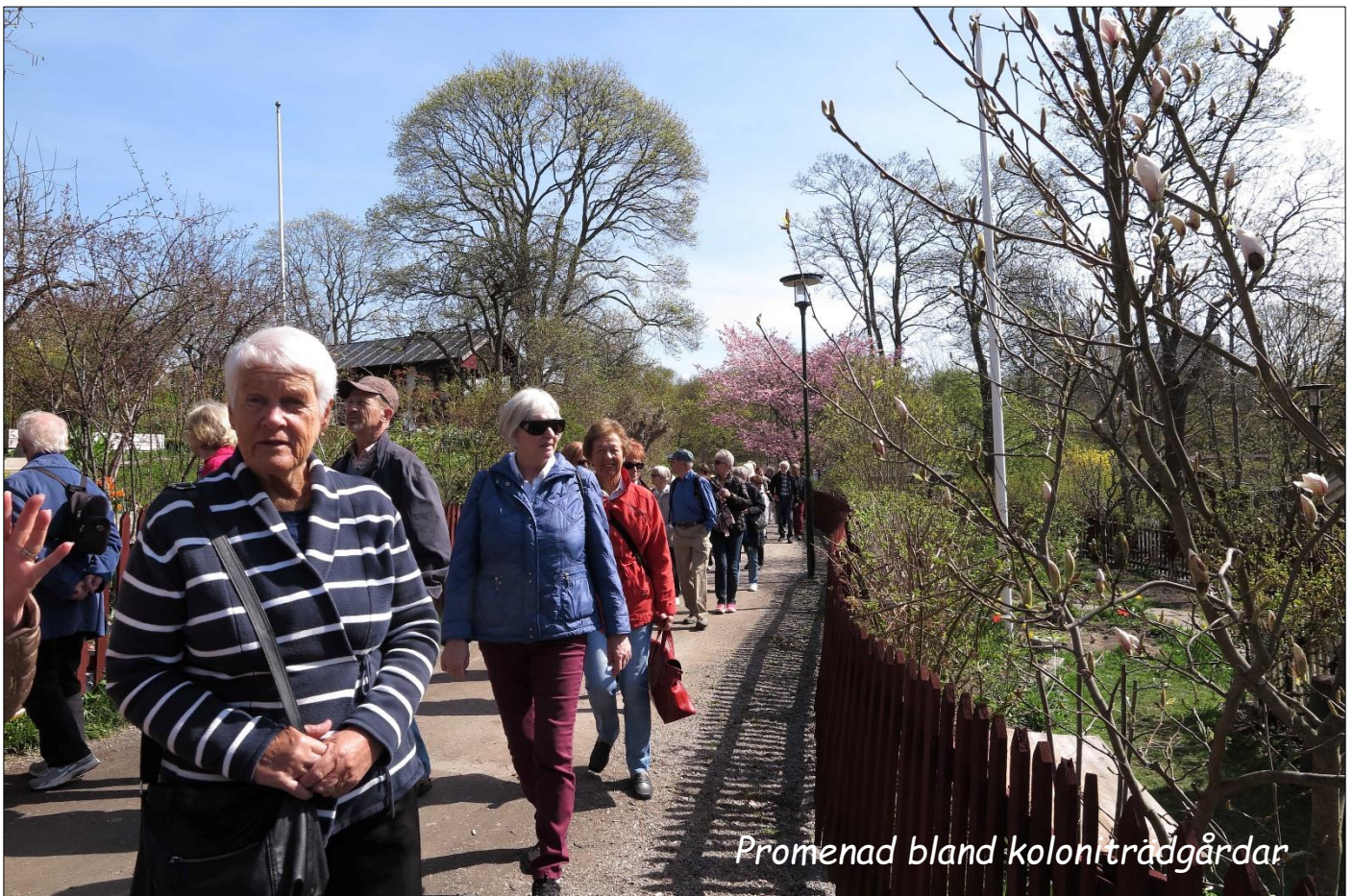
Promenad bland koloniträdgårdar

När vi kom fram till koloniområdet var trädgårdarna fulla av blommande träd och buskar. Små kolonier, som sköts föredömligt av sina ägare. Husen ägs av privatpersoner och marken av Stockholms stad. Kolonin är mycket eftertraktad och föreningen bestämmer priset vid försäljning. För att få möjlighet att köpa en lott måste man stå i kö 10 - 15 år. Vi gick vidare och njöt av blomsterprakten och kom snart ner till Årstaviken.