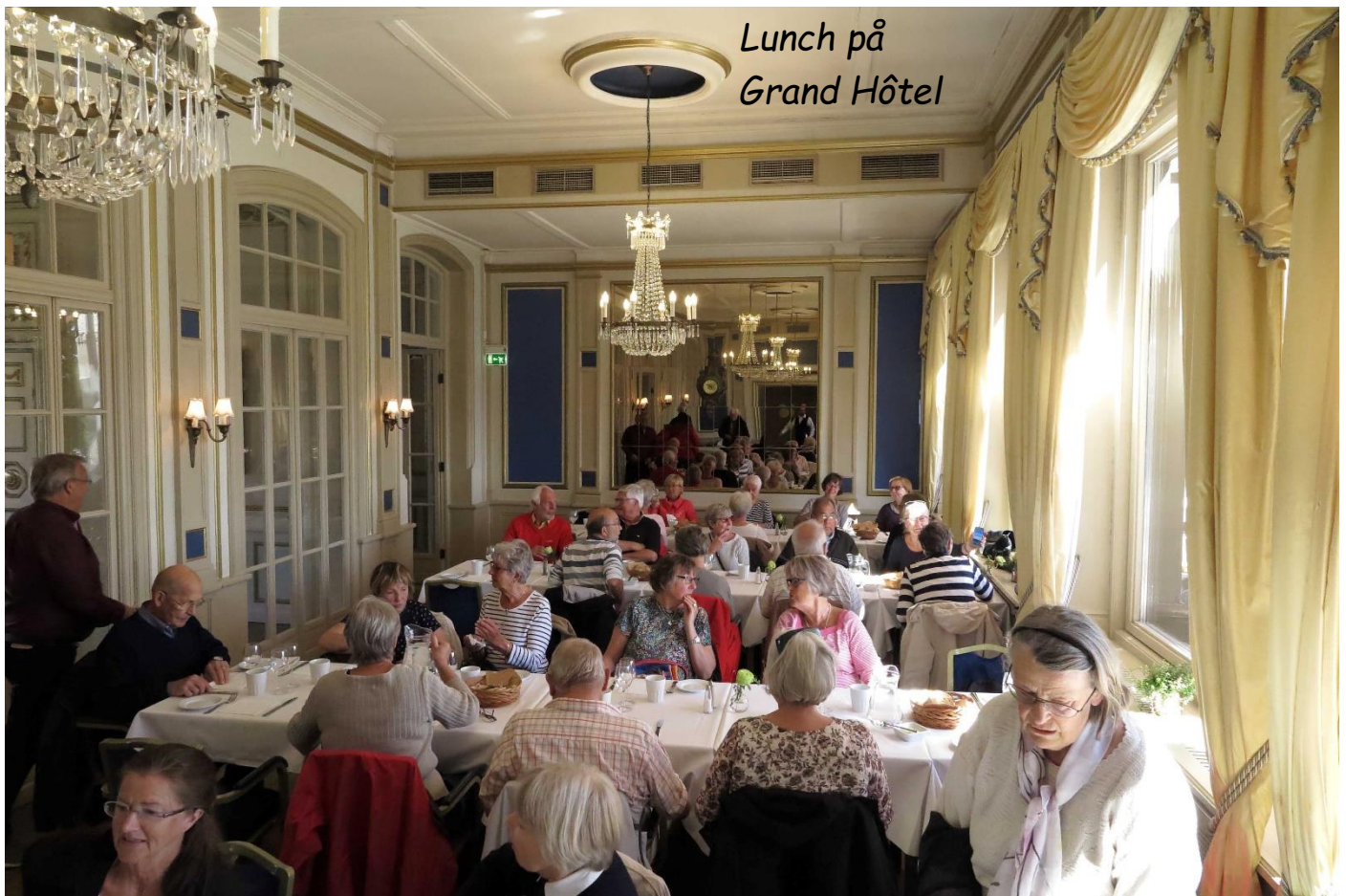
Lunch på Grand Hôtel