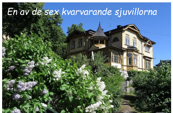
En av de sex kvarvarande sjuvillorna

Vidare förbi Sjuvillorna som uppfördes 1896 enligt tidens smak med torn, terrasser och verandor. Det var en "gruppbebyggelse", men ingen ville bo i ett likadant hus som grannen, så alla villorna var olika utsmyckade. Nu finns sex av villorna kvar.